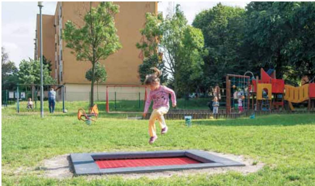
Feldobott hangulatban | A szakemberek kéthetente ellenőriznek, és megteszik a szükséges intézkedéseket

Legalább kétheti gyakorisággal minden kerületi játszótéren lekaszálják a fűvet, rendezik a terület és környékét, hogy a kerületi gyerekek és szüleik kulturált környezetben tölthessék szabadidejüket.