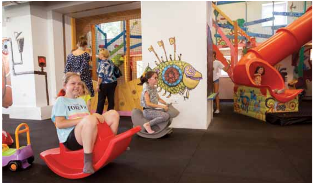
Integrált játszóház | Kerületi kisiskolások vendégségben

2018. március 21-én, a Down-szindróma világnapján nyi-