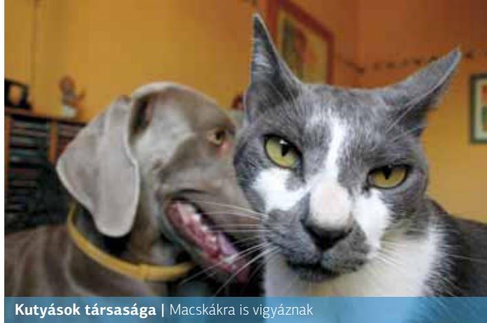
Kuttyások társasága | Macskákra is vigyáznak

– Jelenleg 10-20 aktív taggal rendelkezünk. Mindenkinek megvan a feladata. Elsődleges munkánk, hogy az elkóborolt állatokat visszajuttassuk a gazdáikhoz. Ha pedig chip nélküli állatot találunk, azt magunk