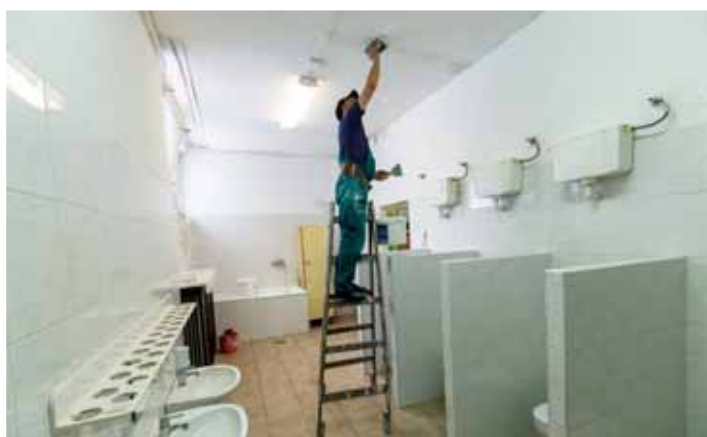
Komfortosabb körülmények | Kisebb-nagyobb felújítások

A nagyobb felújítások mellett, mint például a tanuszoda rekonstrukciója, a Bújócska óvoda tálalókönyhájának megújítása vagy a Budai II. stadion szigetelésének elvégzése – melyekről előző lapszámainkban már beszámoltunk –, a kerületi óvodák, bölcsődék karbantartási, felújítási munkáit is elvégzi a GMK a nyári hónapokban.