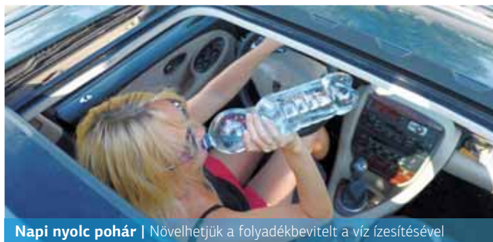
Napi nyolc pohár | Növelhetjük a folyadékbevitelt a víz ízesítésével

Az okostanyer.hu oldalon a szülők egy energiaigény-kalkulátor és élelmiszer-adagolási útmutató segítségével