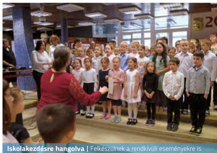
Iskolakezdesre hangolva | Felkészülnek a rendkívüli eseményekre is