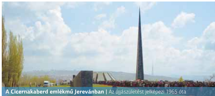
A Cicernakaberd emlékmű Jerevánban | Az újjászületést jelképezi 1965 óta

Talaat pasa az ifjú törökökkel kormányprogrammá nyilvánította a keresztény örmény nép megsemmisítését. Az első világháború elterelte a nagyhatalmak „figyelmét” a török kormány gaztettéről.