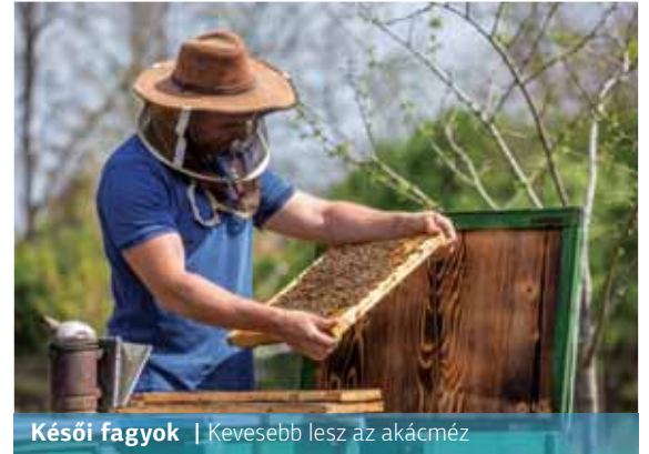
Késői fagyok | Kevesebb lesz az akácmez

– Kéthetes késéssel, de elkezdődött a méhek felkészítése a fő hordásnak számító akácvirágzásra. A késői fagyok miatt idén előre láthatóan kevesebb lesz a hungarikumnak számító akácmezéből – írja az MTI.