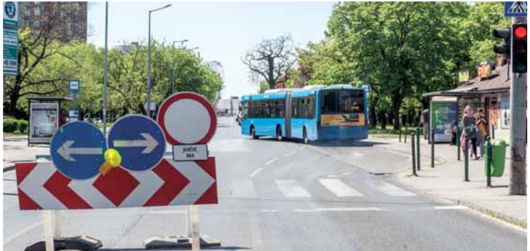
Felújítás december végéig | Csak a BKK járatai hajthatnak át

A XV. kerületet és Zuglót összekötő felüljáró felújítási munkáira a BKK vállalkozási szerződést kötött a Colas Közlekedésépítő Zrt.-vel. Ennek alapján megkezdődtek a híd alatti vizsgálatok, melyek eredménye szükségessé tette a forgalomkorlátozás tervezettnél korábbi bevezetését – írta közleményében a BKK.