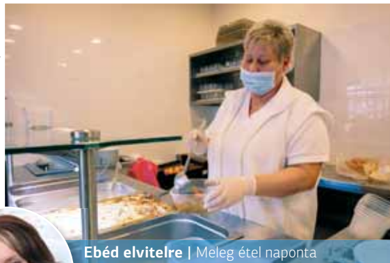
Ebéd elvitelre | Meleg étel naponta

Mint megtudtuk, kevesen élnek ezzel a lehetőséggel, hetente mintegy 200-220 gyerek számára főznek a kerületben. „Ez nagyon alacsony szám, figyelemmel arra, hogy a kerületi bölcsődékbe 450-500, az óvodákba 2046 gyerek jár, az iskolások száma pedig 5167” – mondta a főosztályvezető.