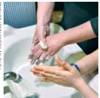
Sűrű kézmosás és krémezés

Különösen az úgynevezett semleges, vagy más néven „illatmentes” krémek, ezek gyógyszerértékben is beszerezhetők, és képesek lenyugtatni a bőrünket.