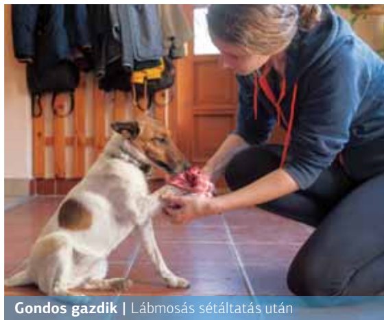
Gondos gazdik | Lábmosás sétáltatás után

A vonatkozó jogszabályok értelmében az állattartó köteles a jó gazda gondosságával eljárni, az állat fájának, fajtá-