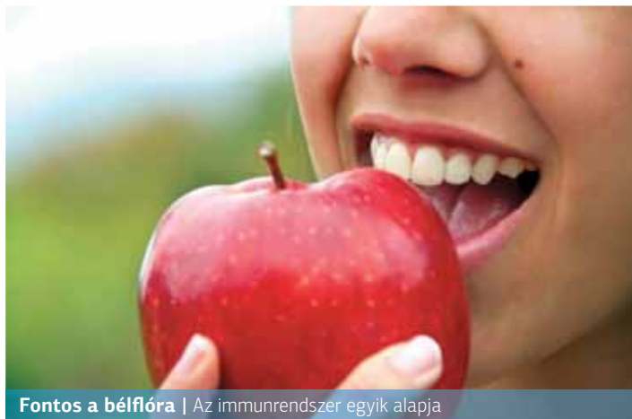
Fontos a bélflóra | Az immunrendszer egyik alapja

– A bélflóra, vagy más néven mikrobiom, az emésztőrendszerünkben (főleg a vastagbélben) élő mikroorganizmusok sokszínű, dinamikusan változó közössége. A velük élő és együttműködő baktériumok összességét elképesztő módon 1-2,5 kilogramm közé becsülik, összetétele pedig minden emberben eltérő, tehát minden-