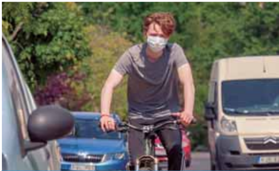
Nagyobb sebességkülönbség | Nagyobb távolság

A jó idő beköszöntével amúgy is megnő a két kéreken közlekedők száma az utakon, a világjárvány miatt pedig jóval többen választják ezt a közlekedési módot. Vannak közülük, akik rutintalanabbak a rendszeren kereközöknél, de nem csak emiatt kell nagyon odafigyelni a biciklizőkre.