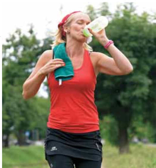
ILLUSZTRÁCIÓ: XVI. MÉDIA, NAGY BOTOND

Nézzük csak! Egy: mindennap együtt ebédelünk. Kettő: nincs reggeli rohanás, így ordibálás sem, hogy azonnal kelj ki az ágyból, öltözz fel, induljunk már és társai. Három: nekem sem kell időben beérnem. Négy: amióta napjaimat a lakásban töltöm, ha pedig ki kell mozdulnom, sem találkozom 3-4 autónál többel, az arcbőröm szebb lett, eltűntek a gyulladások, aminek nagy részéért a rossz levegő a felelős. Öt: amióta el tudtam fogadni, hogy nemcsak érdemes lassítani, de muszáj is, mert különben megbolondul az ember, jó pár fordulattal