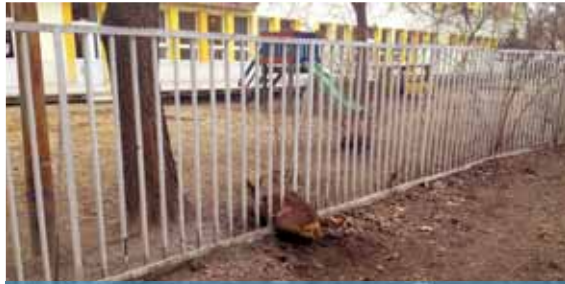
Mezőőrök szolgálata | Kiszabadították a beszorult állatot

Március végén őzet találtak az egyik újpalotai óvodában. Nem a kertben bóklászva, hanem a kerítésbe szorulva.