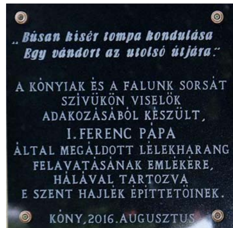
Az Emléktábla a ravatalozó falára került.

kévalóságnak. Emléküket mostantól ez az emléktábla is őrizze!