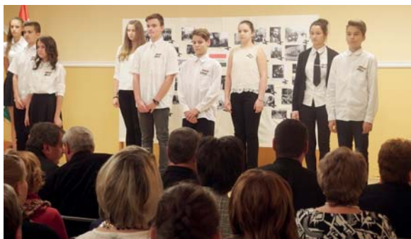
A 8. osztályosok emlékműsora