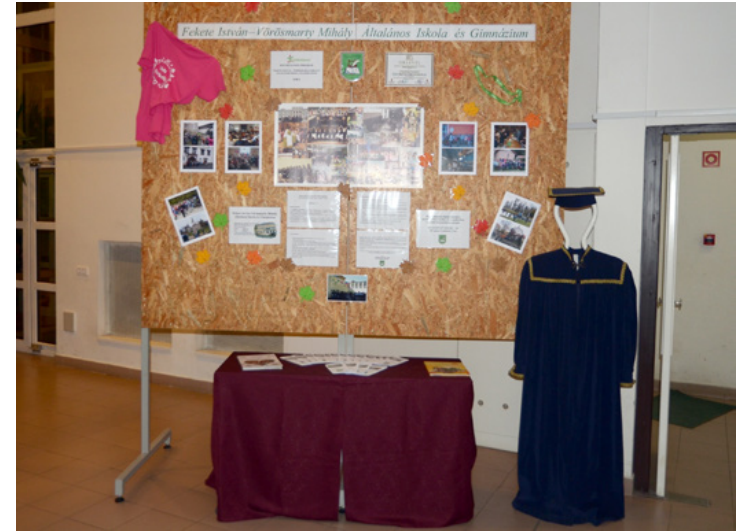
Házi kiállítás az iskola jellemző tárgyaiból

Legutóbbi számunkban már foglalkoztunk a középiskolákkal a felvételi időszak kapcsán. Ezúttal a Fekete István - Vörösmarty Mihály Általános Iskola és Gimnázium Fürst Sándor utcai központjában jártunk, ahol bemutató órákkal és tájékoztatóval kívánták segíteni a hatodikos diákok és szüleik döntését.