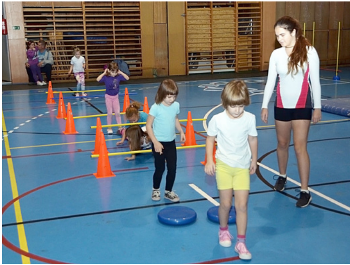
A gyerekek lelkesen próbálgatták a különféle ügyességi feladatokat, akadálypályákat

Zsivaj, jókedv, zene, és izgó-mozgó társaság fogadta az iskolába lépőket november 22-én délután. A tornacsarnokba szülők tereltek be gyermekeiket, hogy a kicsik egy vidám sportfoglalkozáson vegyenek részt, amíg a családjuk megismerkedik az iskolában folyó nevelő-oktató munkával és az intézmény kínálatával. Több mint ötven óvodás érkezett szüleivel, hogy megtapasztalja a Fekete sulii légkörét.