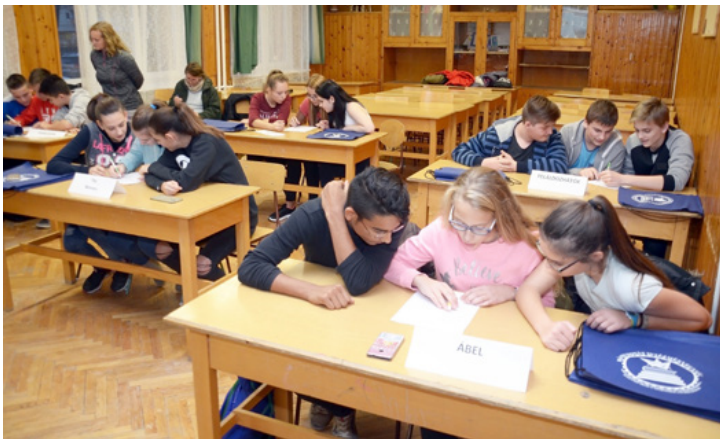
A tájékoztató után sporttal kapcsolatos totót töltöttek ki a csapatok

Az Ajkai Gimnázium, Szakközépiskola, Általános Iskola, Sportiskola és Kollégium Bánki Donát Intézményegysége pedagógusai minden alkalmat megragadnak, hogy felhívják a figyelmet az új képzésekre.