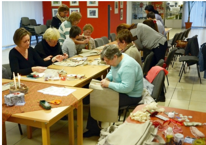
Készül a karácsonyi táská