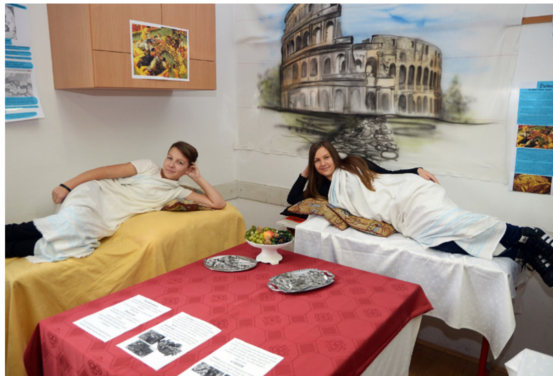
A lakoma szerényebb, de a testhelyzet autentikus egy lucullusi dőzsöléshez