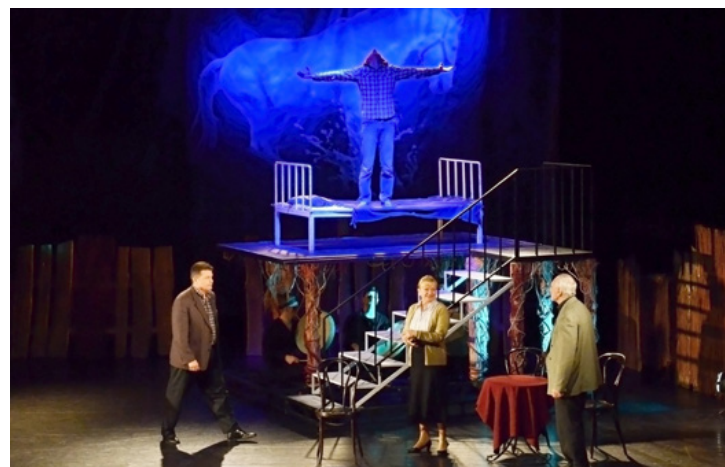
Hol van a határ a normális és a nem normális között?

Az Equus valós történeten alapszik. Peter Schaffer angol drámaíró egy újságcikk ihlette meg, amely arról szólt, hogy egy 17 éves lovászfiú lovakat vakított meg az istállóban, ahol dolgozott. Ezt az alapsztorit gondolta újra a szerző, és alkotta meg 1973-ban a felkavaró színdarabot. A dráma a 70-es években mintegy ezer előadást ért meg New Yorkban, és több díjat is elnyert. Vándorfi László a mai magyar környezetbe helyezve áldotta színpadra a darabot, felerősítve üzeneteit.