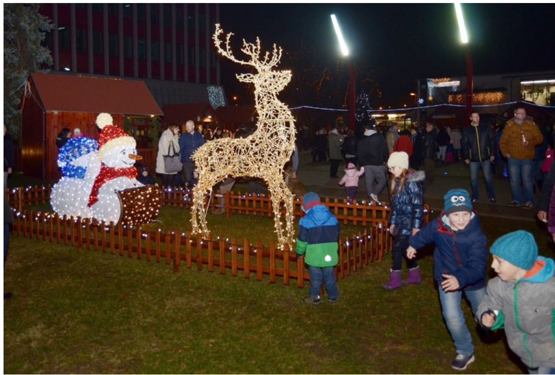
Az idei adventi dekoráció slágere az Agorán a világító, rénszarvasszánon érkező Mikulás