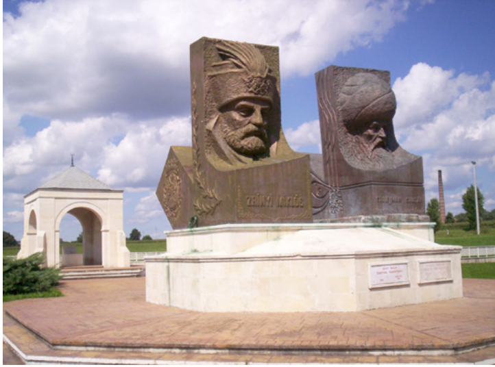
Zrínyi és Szulejmán közös szobra Szigetváron