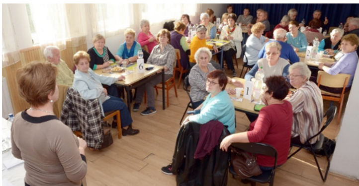
Hat csapat harminc résztvevője mérte össze tudását a vidám hangulatú vetélkedőn