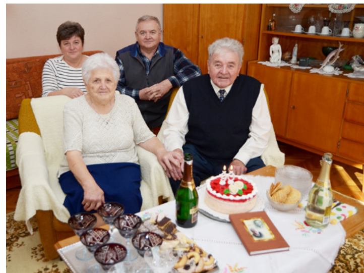
Ünnepelés családi körben