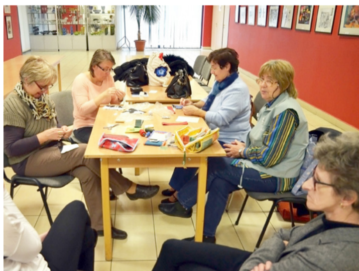
Kevesen voltak a kreatívok

Varrás közben a foglalkozásvezető elmondta, hogy a közös munkák alkalmával