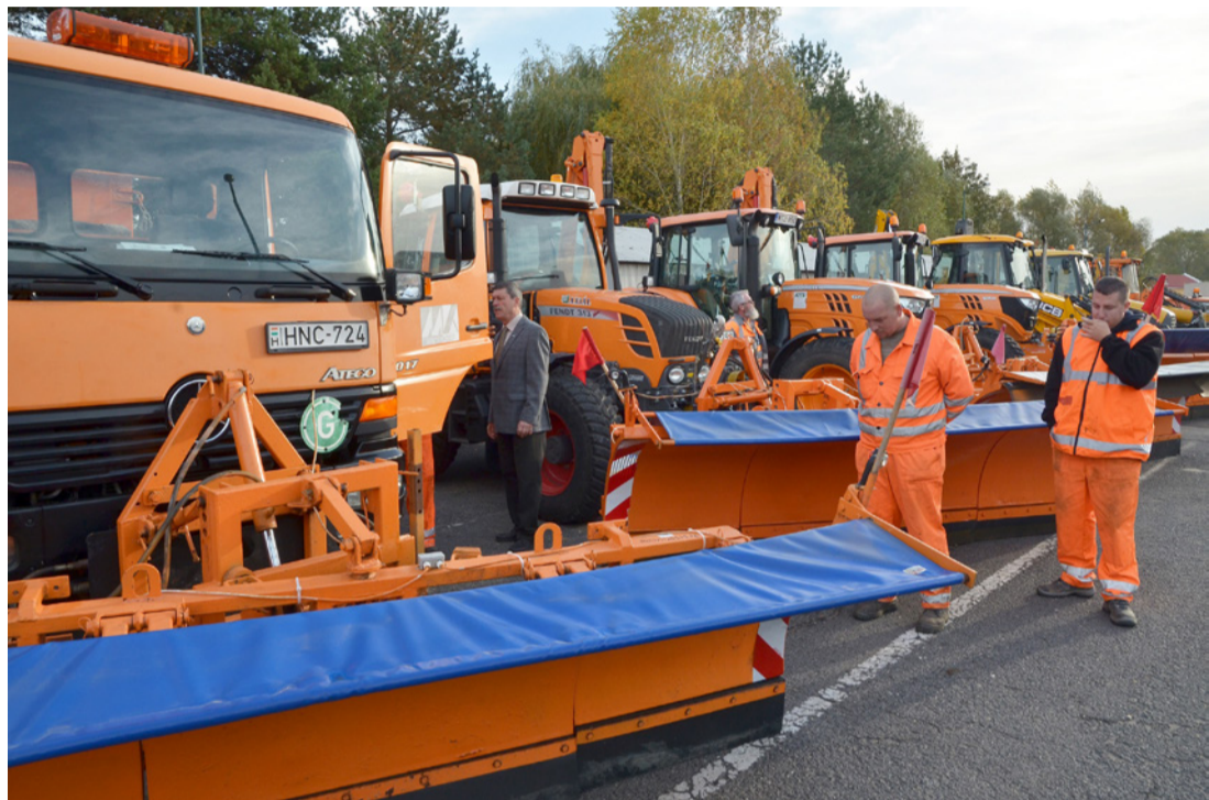
Impozáns látványt nyújtottak a felsorakozott gépek