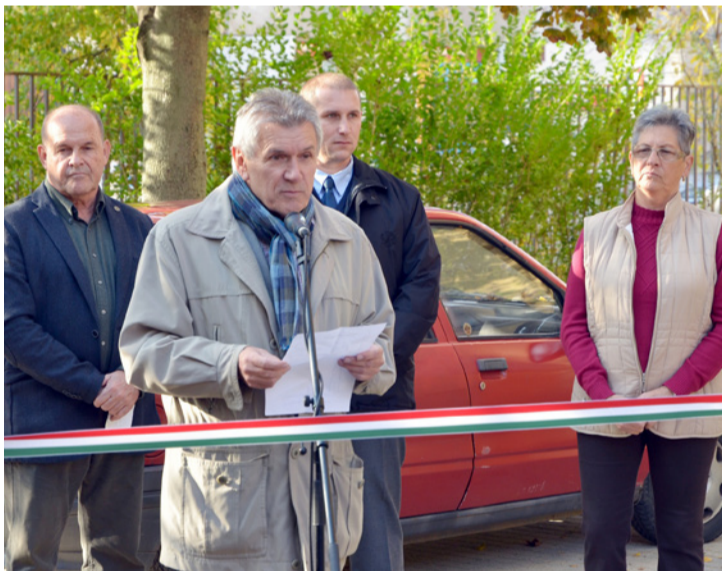
Schwartz Béla szerint a város egyik legszebb utcája lett a Kosztolányi

A Kosztolányi u. 6-8. közötti parkoló felújítása alkalmából tartott avató ünnepséget az önkormányzat október 27-én.