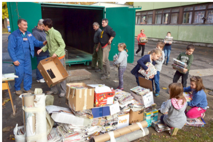
A leadott papírt az Avar Ajka Nonprofit Kft. szállította el további feldolgozásra