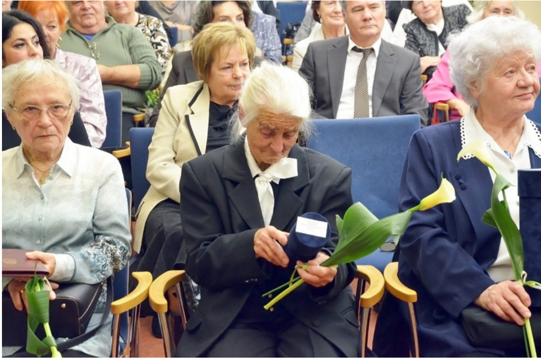
A tanári pálya életre szóló hivatás