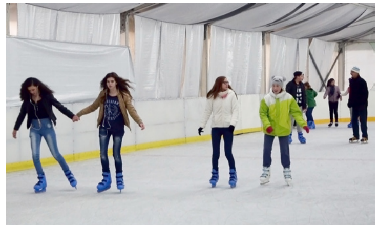
Az első napokban még bőven volt hely a korcsolyázásra