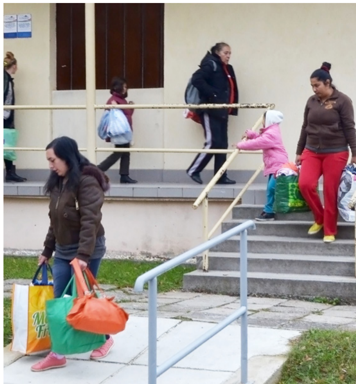
Senki se távozott üres kézzel a ruhabörzéről

A szombat délelőttre meghirdetett börze nyitása előtt már gyülekeztek a rászorulóknak. Legtöbbször a Családok Átmeneti Otthonából érkeztek. Ők azok, akik 2013 óta évente kétszer a legjobban várják ezt az ingyenes lehetőséget. Izgatottan válogatták a zsákok tartalmát, ahol többségében jó minőségű portékát találtak. Természetesen nemcsak az otthonból,