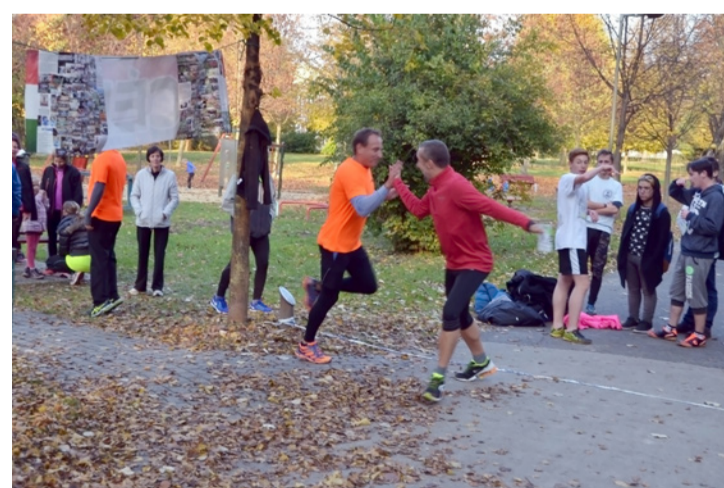
Igazi futóidő és színes levél kavalkád fogadta az indulókat

Harmincnyolc kört kellett teljesíteni a különböző összeállítású (nők, férfiak, felnőttek és diákok) és létszámú (14-22 tagú) váltóknak, hogy ötvenhét kilométer megtétele