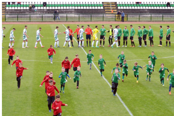
Labdarúgó gyerekek vezették fel a csapatokat az FC Ajka – Győr meccsen

Az FC Ajka csak megnehezíteni tudta a bajnokság egyik legjobb csapatának dolgát. Gaál Zsóka kilencedik lett a sakk világbajnokságon.