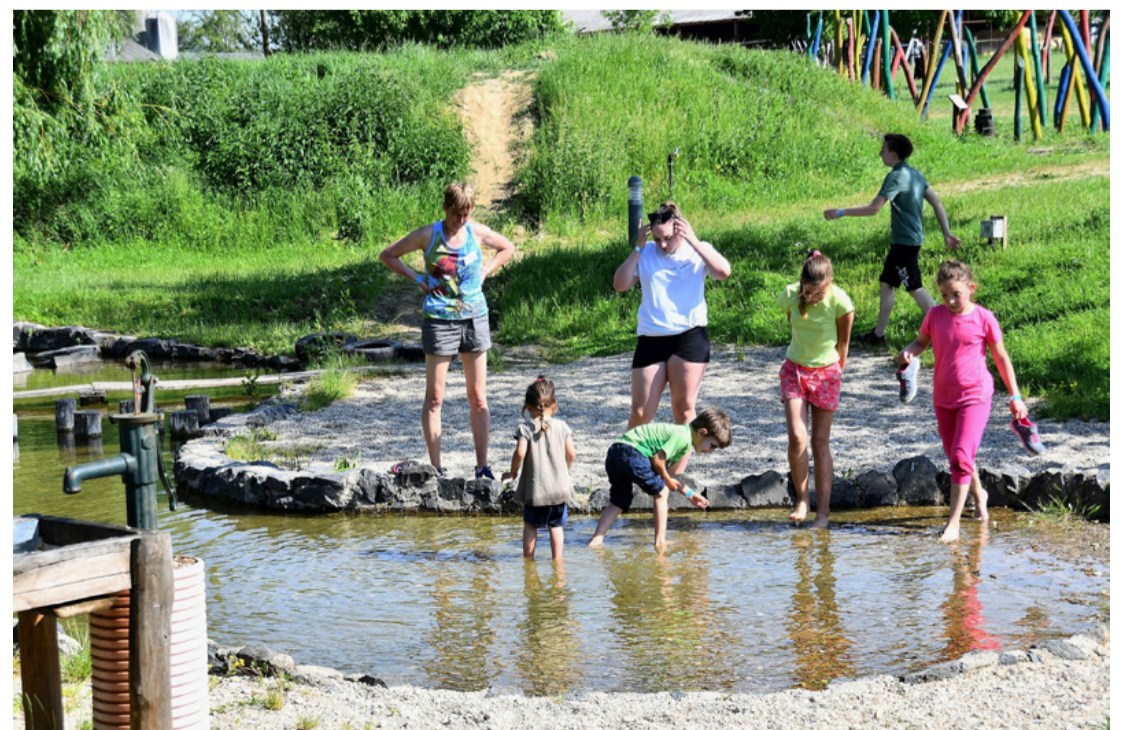
A tóban békát is lehet fogni