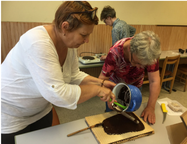
Nagy gonddal készül a rumos-csokis ostya

■ Karamell, tejszín- és csokiillat töltötte be május 17-én a Nagy László Városi Művelődési Központ és Könyvtár, József Attila úti épületét. A felnőtteknek kreatívan foglalkozás utolsó napján, sütés nélküli finomságokkal érkezett Szurics Nándorné a tósoki cukrászkereskedésből.