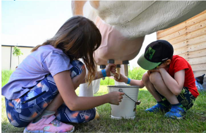
Ha még valaki nem tudná, hogyan kell (mű)tehenet fejni

■ A hátrányos helyzetű gyermekek értelmi és érzelmi fejlődésének segítésére hivatott, ajkai Te Számítasz Egyesület május 21-én ismét megszervezte az általuk elnevezett Anyák-Gyermekek Napját, a Nomádia Szabadidőparkban.