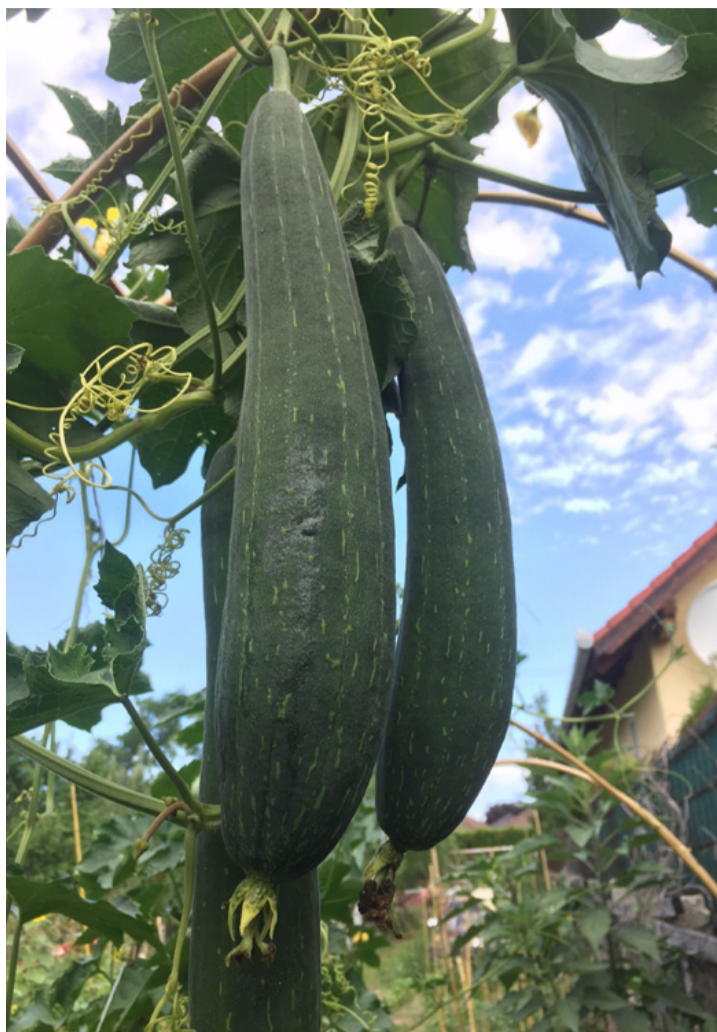
Luffa tök, az „ehető szivacs”