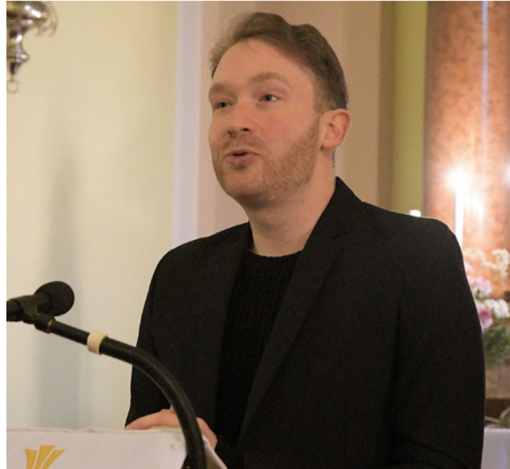
Két és fél évig erősítette Ajka egyházzenei életét

– 2010 óta koncertezem a harmóniummal, amely még napjainkban is kuriózumnak számít Magyarországon, ezért kértem meg a zenésztársaimat, hogy egy koncert erejéig jöjjenek el Ajkára megszólaltatni ezt az orgoná-