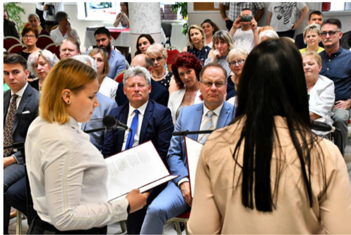
A verses összeállítást a közönség, köztük tanárok és politikusok követték nyomon

■ Fennállása 30. évfordulóját ünnepelte a Veszprémi Szakképzési Centrum Szent-Györgyi Albert Technikum és Kollégium május 20-án. Az intézmény aulája megtelt volt diákokkal, tanárokkal, támogatókkal, a városban működő oktatási intézmények vezetőivel. A köszöntőket és a kulturális műsort követően bemutatták az évfordulóra kiadott könyvet.