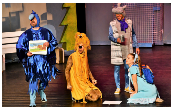
A legjobb, ha maguk a színészek is élvezik az előadást. Márpedig az arcok erről árulkodnak

A színház vezetője köszöntötte a türelmetlen gyerekeket, akik tapssal hívták a szereplőket a színpadra. A színészek az előadás alatt folyamatos interakcióban voltak a közönséggel, akik sűrűn visszajelezték, hogy követik az eseményeket, sőt aktív résztvevői a mesének. A díszletet többször változtatták, átforgatták, játszottak a fényekkel, a hangeffektekkal, színes és látványos jelmezeket viseltek a szereplők. A különböző jelenetekhez kreatív színpadi kellékeket használtak. Az író figyelt arra is, hogy a párbeszédbe beleillessze a mai gyerekek szóhasználatát. A táncból és a vidám dalokból sem volt hiány. A prózai és a zenés jelenetek egyensúlya jellemezte a darabot, amit humorral fűszereztek. A mesejáték legfontosabb mondanivalója, hogy a barátok mindig kitartanak egymás mellett, összefognak és segítenek a bajban. RE ■