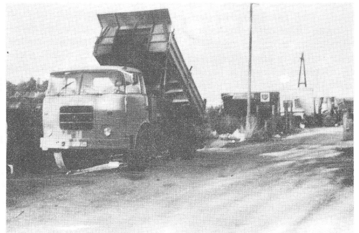
Az Úttörő utca rémei a több tonnás teherautók