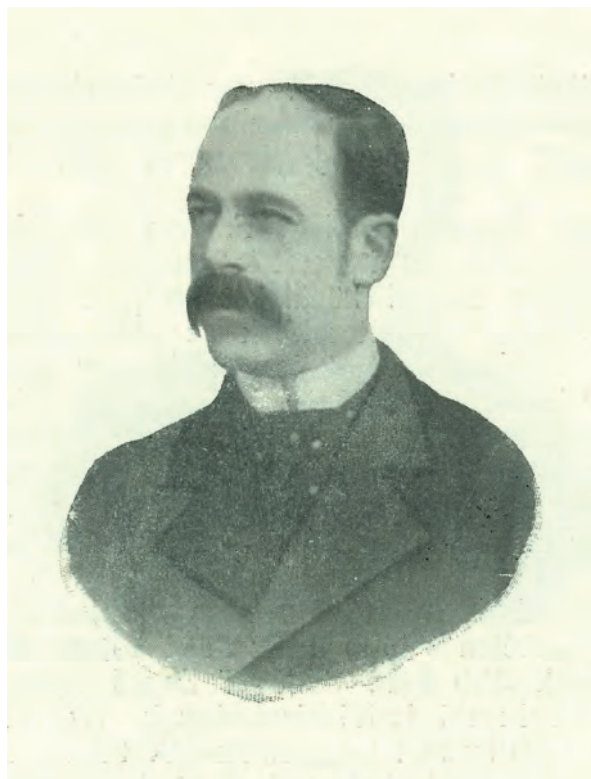
■ Földes Béla (1848–1945) közgazdász, statisztikus, egyetemi tanár, 1917. augusztus 18. és 1918. május 8. között átmenetgazdasági tárca nélküli miniszter (Magyar országgyűlési képviselők arcképcsarnoka 1906–1911. Bp. 1906.)

Springer Ferenc (Budapest) felszólalásában ismertette a Gazdaszövetség és az Országos