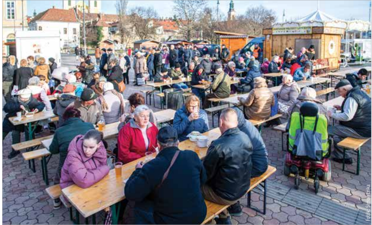
Ezerötszáz adag ízletes étel készült, amit hétfőn délután közösen fogyasztott el a város apraja-nagyja

„Szép hagyomány, hogy az új év első napján lencsét eszik a magyar, és a családok így kívánnak egymásnak az egész esztendőre jó szerencsét és boldogságot. 2013 óta az év nyitá-