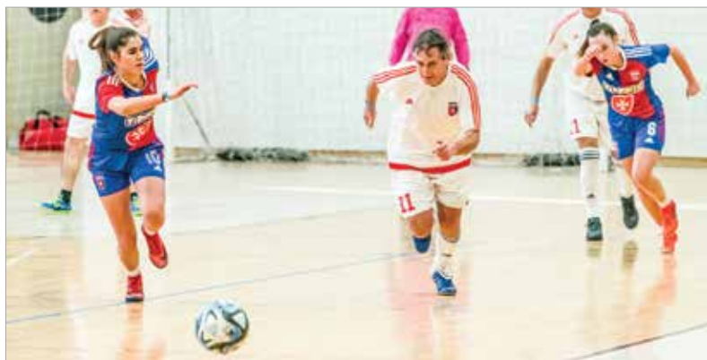
A Videoton-öregfiúk sorozatban háromszor nyerték meg az MLSZ által kiírt bajnokságot