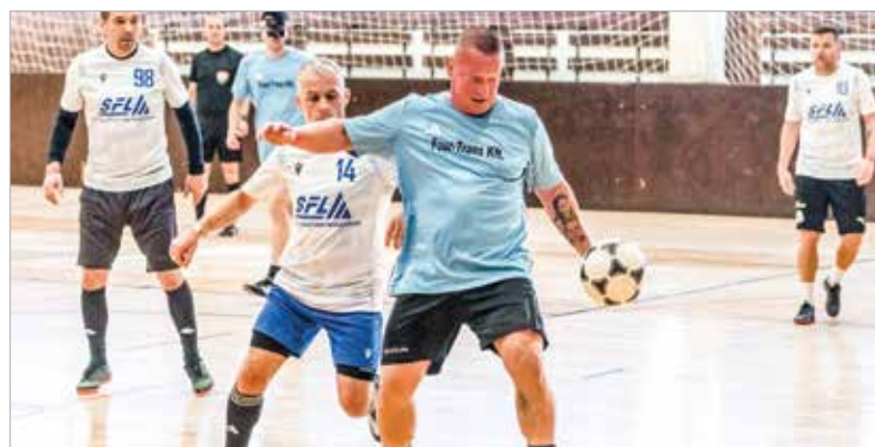
Közel ezer játékos lépett pályára