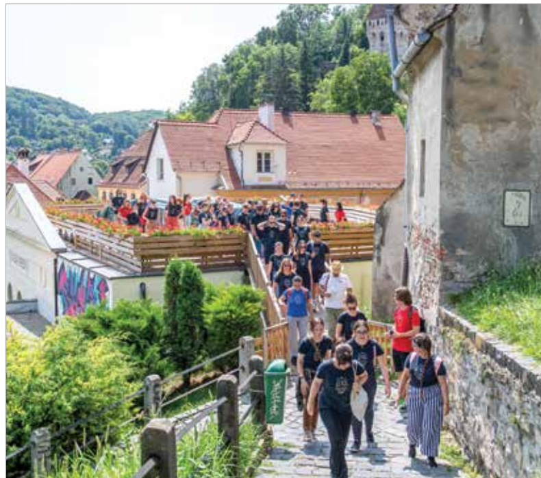
A tizenkét döntős eljuthat a Székelyföldi Verstaborba is...

A XIV. Fehérvári Versünnep zsűrijének elnöke ezúttal is Kubik Anna Kossuth- és Jászai Mari-díjas Érdemes Művész lesz. A jelentkezés január 15-én indul. Minden szükséges információ hamarosan elérhető lesz a www.versunnep.hu oldalon. A megmérettetés elődöntőjére február 24-én kerül sor a Szent István Hitoktatási és Művelődési Házban. Itt kerül majd kiválasztásra a legjobb tizenkét versmondó, akiknek a felkészülését ezúttal is szakemberek segítik majd. A döntőnek április 13-án a Városháza Díszterme ad otthont.