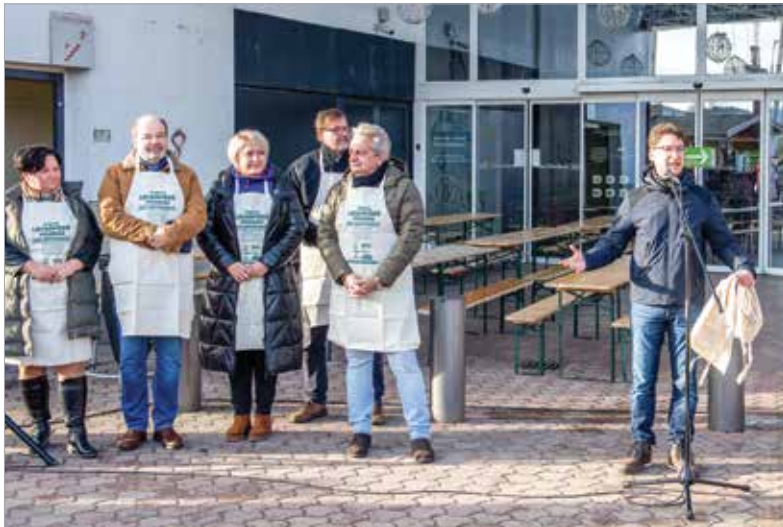
A polgármester kiegyensúlyozottabb, békés, nyugodt, boldog új esztendőt kívánt a fehérváriaknak

nyaként bevezettük ezt a város közössége életében is. Lencsével indul az év, köszönhetően a katonáknak, köszönhetően azoknak az embereknek, akik segítenek nekünk, hogy a szerencsehozó étellel köszönthessük a fehérváriakat. Bízom benne, hogy mindenkinek békés, nyugodt, boldog és szerencsés éve lesz!” – fogalma-