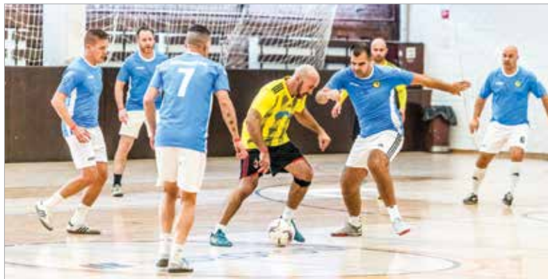
A Kiss Lajos Öregfiúk Kupát a Sárépszer csapata nyerte meg