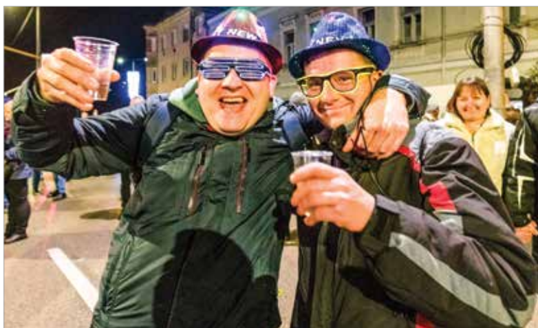
Az óév alaposan el lett búcsúztatva!