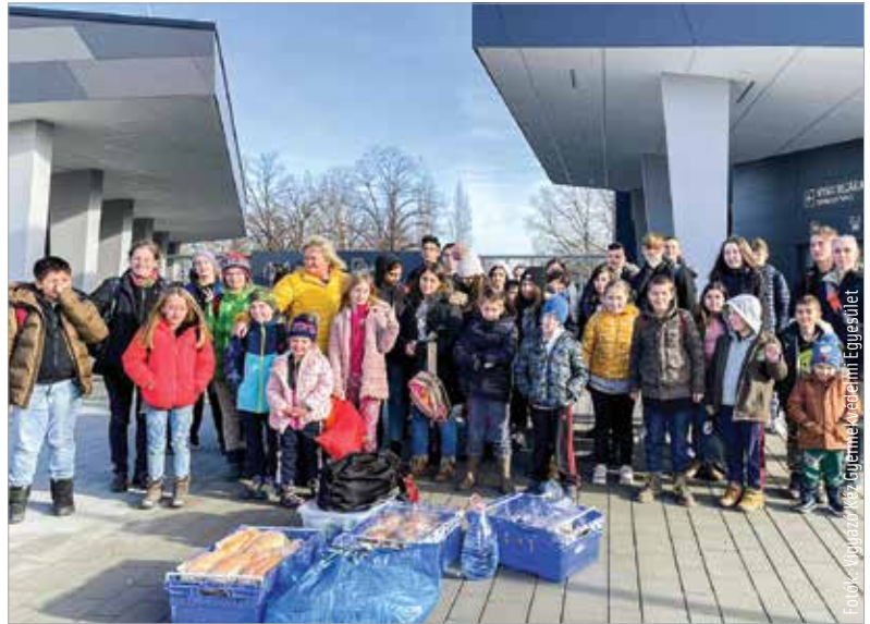
A Vigyázó Kéz és a Lurkó Gyermekevédelmi Egyesület szervezésében, magánszemélyek és cégek finanszírozásának köszönhetően utazhatott el negyven, négy és tizenhét év közötti, állami nevelésben élő gyermek, valamint önkéntes kísérőik a győri élményfürdőbe. Azok a saját családjuk nélkül nevelkedő gyerekek kirándultak a tavalyi év utolsó napjaiban, akik a karácsonyi ünnepeket is az ellátási helyükön töltötték. A támogatók életre szóló élményekkel és személyre szóló figyelemmel okoztak vidámságot és örömet. B. G.