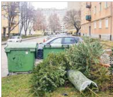
Január közepétől kezdik elszállítani a karácsonyfákat

A hulladéknaplók tartalmazzák, hogy az adott településen mikor szállítják el a vegyes, a szelektív és a zöldhulladékot, valamint a fenyőfákat, és mikor van gyűjtési-nap-áthelyezés.