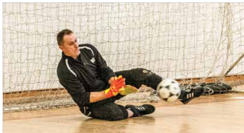
Nemcsak gyönyörű gólok, de nagy védéseket is láthattak a nézők