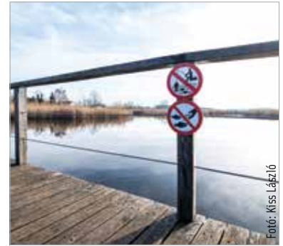
Piktogramok hívják fel a figyelmet arra, hogy tilos a horgászat

A területen a Közterület-felügyelet térfigyelő központjába bekötött kamera és több vadkamera is működik, melyek helyét folyamatosan változtatják. A Közterület-felügyelet rögzített is felvételt arról, amint három személy a jégen a horgászbójával próbált léket ütni, a rendőrök pedig elfogták azokat a férfiakat, akik horgásztak a tóban. A város szívében található, védett zöldterületen minden bejáratnál – nemzetközi jelzések szerinti, nyelvismerettől függetlenül felismerhető – piktogramok hívják fel a figyelmet arra, hogy tilos etetni a vízmadarakat és a halakat, tilos poráz nélkül sétáltatni a kutyákat,