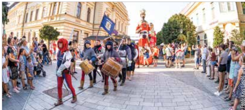
Szent István ünnepén is lesz egy négynapos hosszú hétvégénk

Minden évkezdetkor kérdés, hogyan alakulnak az ünnepnapok, hány hosszú hétvégére és dolgozós szombatra kell számítanunk az új évben. Először kezdjük a ros-szabbal: 2024-ben három szombati napon kell majd dolgozni, augusztus 3-án, december 7-én és december 14-én. Bár ez a három hétvégénk egynapos lesz, cserébe több hosszú hétvégével is számolhatunk, köztük egy hatnapossal!