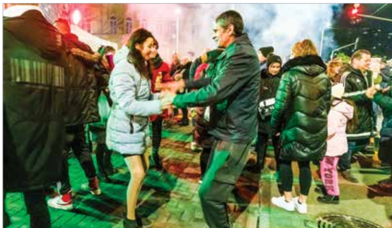
Felcsendültek többek között az ABBA, az Ottawan, az Eruption, Gloria Gaynor és Donna Summer táncos slágerei is