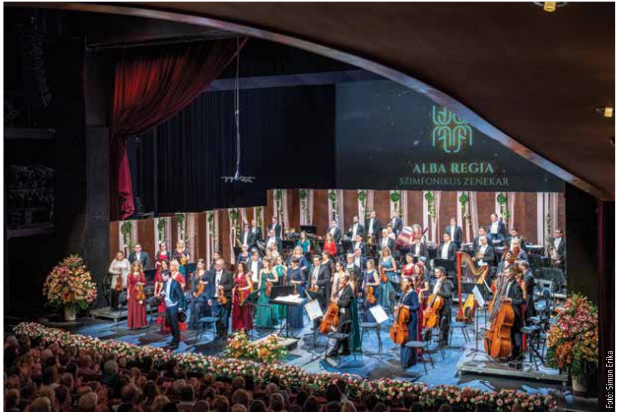
Fergeteges koncerttel köszöntötték a klasszikus zene barátait az új évben