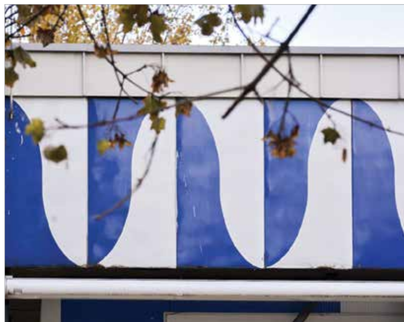
Pécs és Kaposvár büszkélkedhet még hasonló alkotással

egy-két rozsdafolttól, jól állják az idő vasfogát.” Lantos Ferenc munkássága előtt az óvoda területén egy emléktábla is tiszteleg, ezt 2022-ben avatták fel.