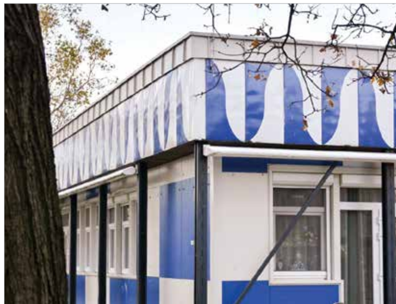
A tűzzománc fríz 1972-ben készült