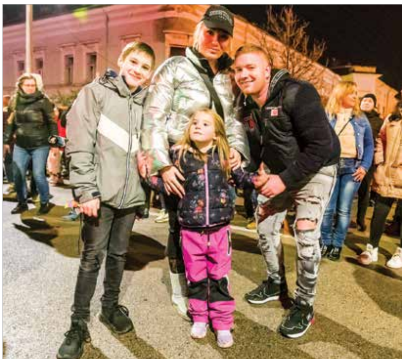
Sokan családotól érkeztek köszönteni az új esztendőőt