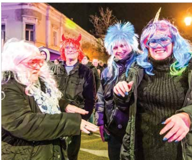
A színes paróka kedvelt kiegészítő volt ezen az éjszakán