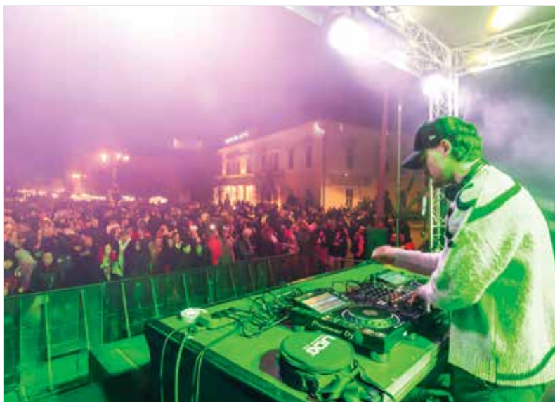
Rengeteg zenei stílusból merítették a fellépők az ünneplők örömeire