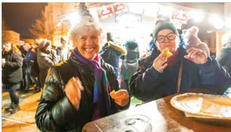
A zene mellett finom ételek és italok is várták a belvárosban ünneplőket