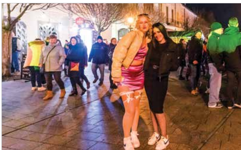
Aki csak élvezte a forgatagot, az is jól érezte magát