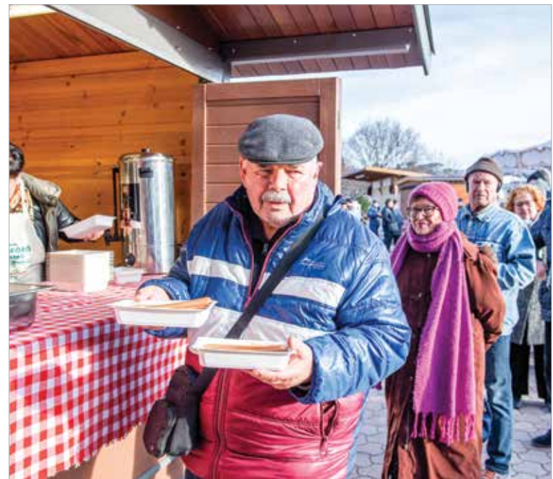
Az elmúlt évek során igazi közösségi programmá nőtte ki magát a szerencsehozó lencse közös elfogyasztása

Az apró szemű hüvelyeshez a néphit a pénzt és a gazdagságot társítja: minél többet fogyaszt belőle valaki az év első napján, annál nagyobb szerencséje lesz, és bőség jellemzi majd az évét.