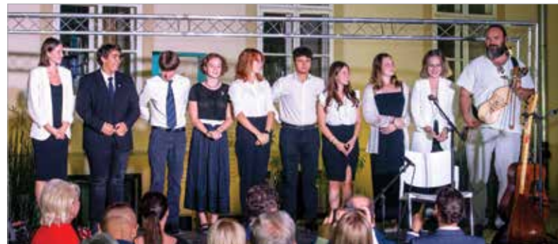
...és közös élményeket szerezhetnek a Vershúron gálán

Csoportokat is fogadnak, azonban kizárólag előzetes regisztráció alapján. A tervezett látogatás előtt legkevesebb öt munkanappal kéri az előzetes bejelentkezést!