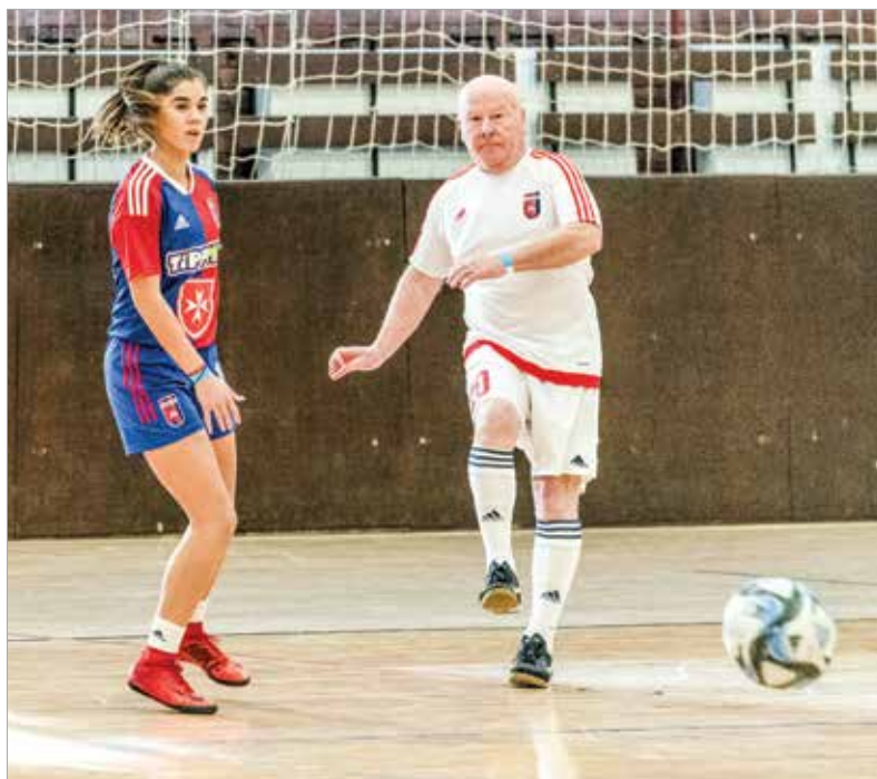
Két gálamérkőzést is beiktattak a szervezők a programba, az egyikben a Videoton-öregfiúk csapata lépett pályára a Fehérvár FC női labdarúgói ellen