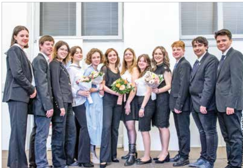
A tavalyi Fehérvári Versünnep döntősei a megmérettetés után

Akik korábban részt vettek a tehetséggondozó programon, azok megtapasztalhatták, hogy igazi közösségi esemény a Fehérvári Versünnep. A különleges program sok esetben vált kapcsolattá, mely