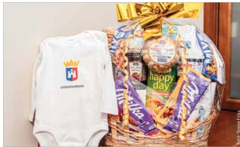
Az év első fehérvári újszülöttje megkapta a városi címerrel díszített rugdalózót, illetve a nevére szóló és nagykorúvá válása után kiváltható biztosítási kötvényt

Szép hagyomány, hogy a minden fehérvári újszülöttnak ajándékozott, a város címerével ellátott babapléd mellett egy szépen díszített rugdalózót, az édesanyjának összeállított csomagot, valamint a gyermek nevére kiállított biztosítási kötvényt is átadnak, ami a gyermek nagykorúvá válását követően váltható ki. A kamatokkal megemelkedett összeg segítheti majd az idei év első fehérvári újszülöttje számára is felnőtt élete megkezdését.