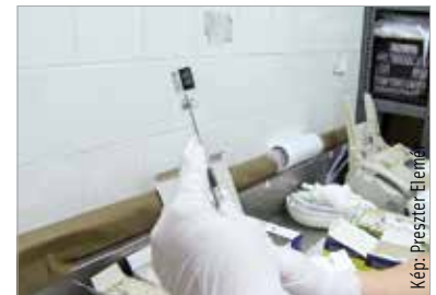
Az oltás felvételére időpont foglalása nélkül nincs lehetőség!

A Nemzeti Népegészségügyi Központ tájékoztatója szerint az ország több városában, így Székesfehérváron is csökken a koronavírus örökítőanyagának szennyvízben mért koncentrációja, de az eredmények továbbra is emelkedett értékeket mutatnak. A Szent György Kórház oltópontja az infektológiai ambulancián (U épület) várja azokat, akik szeretnék beadatni a vírus elleni oltást – tette közzé az intézmény a napokban. Az oltópont szerdától péntekig várja a pácienseket 13 és 16 óra között. Szerdai és pénteki napokon Pfizer-, csütörtökönként pedig Moderna-oltóanyag választható. Időpontot kizárólag az EESZT-felületen lehet foglalni, oltás felvételére időpontfoglalás nélkül nincs lehetőség – figyelmeztet a kórház.