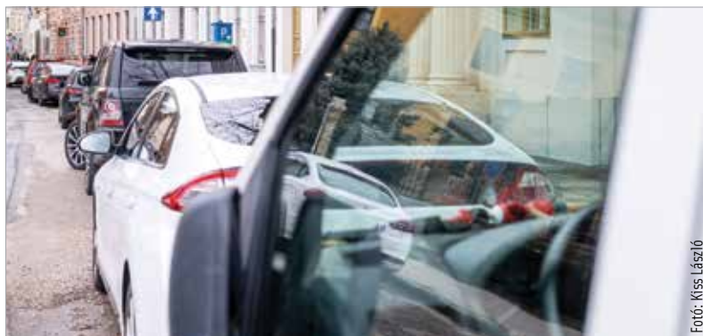
Érdemes elkerülni a sorban állást, és online kiváltani a parkolóbérleteket!

Ügyfélfogadás a Parkolási Csoportnál (Szent Vendel u 17/A.) Hétfő, kedd, csütörtök: 8 órától 15.30-ig, Szerda: 8-tól 18 óráig, Péntek: 8-tól 13 óráig.