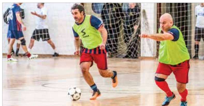
A labdarúgás szerelmesei hat tornát követhettek figyelemmel