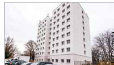
Már az állványok is lekerültek, kívülről is látványos a változás

Hamarosan befejeződik a nővérszálló épületének felújítása, mely egyike a Szent György Kórház elmúlt tíz évben megvalósuló fejlesztéseinek – számolt be róla közösségi oldalán Cser-Palkovics András. A polgármester elmondta: az elmúlt évtizedben számos fejlesztést tudtak végrehajtani a kórházban, köztük két új kórházi tömb építésével és a szülészeti-nőgyógyászati teljes megújításával. „A Szent György Kórház régióink, megyénk és városunk legfontosabb egészségügyi intézménye, egyben egyike a legnagyobb munkáltatóknak is. Az itt dolgozó orvosok, ápolók és segítők körülményeinek, juttatásainak javítása alapvető fontosságú, amit a bérek mellett esetenként a lakhatással is lehet segíteni. Kórházunk orvos- és nővérszállójára már igencsak ráfért a felújítás, mely kívülről is igen látványos, hiszen megtörtént a homlokzati szigetelés, korábban pedig a nyílászárók cseréje. A kivitelező kisebb-nagyobb belső beavatkozásokat is elvégzett az épületen, sokkal energiatékonyabbá és komfortosabbá téve azt!” – írta a polgármester, azt is kiemelve, hogy a Szent György