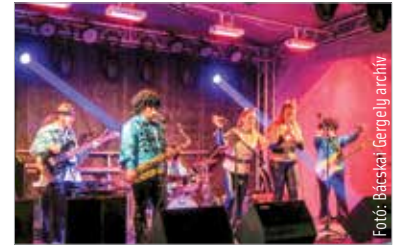
A fehérvári zenészekből álló Discover Band évek óta fergeteges hangulatot varázsol az év utolsó napján