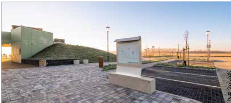
Látogatóközpont épült, nyolcvannégy napelemes lámpával ellátott sétányt és parkolókat alakítottak ki, nyolcszáz fát telepítettek, továbbá kerékpártárolókat, napozóágyakat és árnyékolóval ellátott asztalokat, padokat helyeztek ki az Alsóvárosi-rétre

A Bakony utca felől megközelíthető területen rendszeresen tartanak nordic walking foglalkozásokat, ösvényei pedig alkalmasak futásra és kutyasétáltatásra is. A korábban ipari beépítésre szánt területet a Modern Városok Program keretében, Magyarország kormányának segítségével vásárolta meg, majd minősítette át Székesfehérvár önkormányzata. A Széchenyi 2020 programnak köszönhetően indult projekt kétmilliárd forintos vissza nem térítendő uniós támogatásból valósult meg.