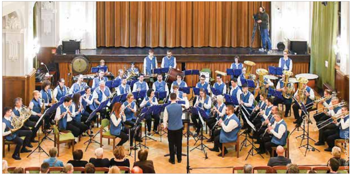
Az ünnepi koncertről készült felvétel megtekinthető a Fehérvár Televízióban november huszonhatodikán 19.20-kor!

„Nagyon sok szép élményünk volt ennyi idő alatt, igazi közösség lettünk. Már több száz ember megfordult a zenekarban, de vagyunk páran még alapítótagok. Nagyon jó barátságok alakultak és alakulnak ki a mai napig. Jártunk mindenfelé a világban, nagyon szeretünk együtt