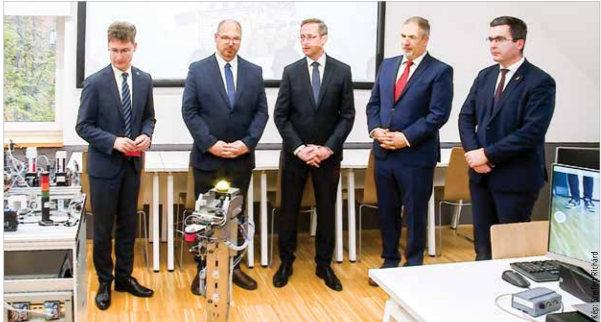
Az új laborok hozzájárulnak ahhoz, hogy a hallgatókat a legmodernebb technológiák segítségével képezzék, és versenyképes tudást kapjanak

Székesfehérvár polgármestere az ünnepélyes átadáson hangsúlyozta: az ipar rohamos változáson megy keresztül, ezért a szakmunkást, de a mérnököt is erre a világra kell felkészíteni, ez pedig nem megy együttműködés nélkül. Az egyetem, a vállalati és az állami támogatás és a helyi önkormányzat által biztosítható környezet együttműködéséről szól a