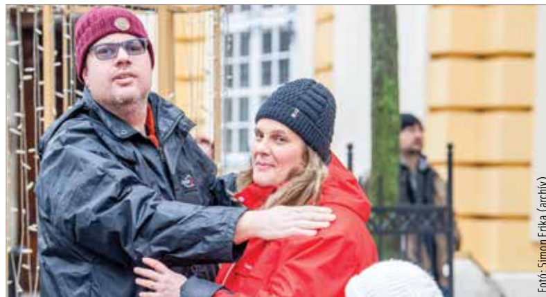
Az ölelés az épek és a fogyatékkal élők egységét szimbolizálja

A szervezők mindenkit buzdítanak a részvételre, és kérik, hogy legyenek minél többen a fogyatékoság világnapján a belvárosban. A rendezvény fővédnöke Cser-Palkovics András polgármester.