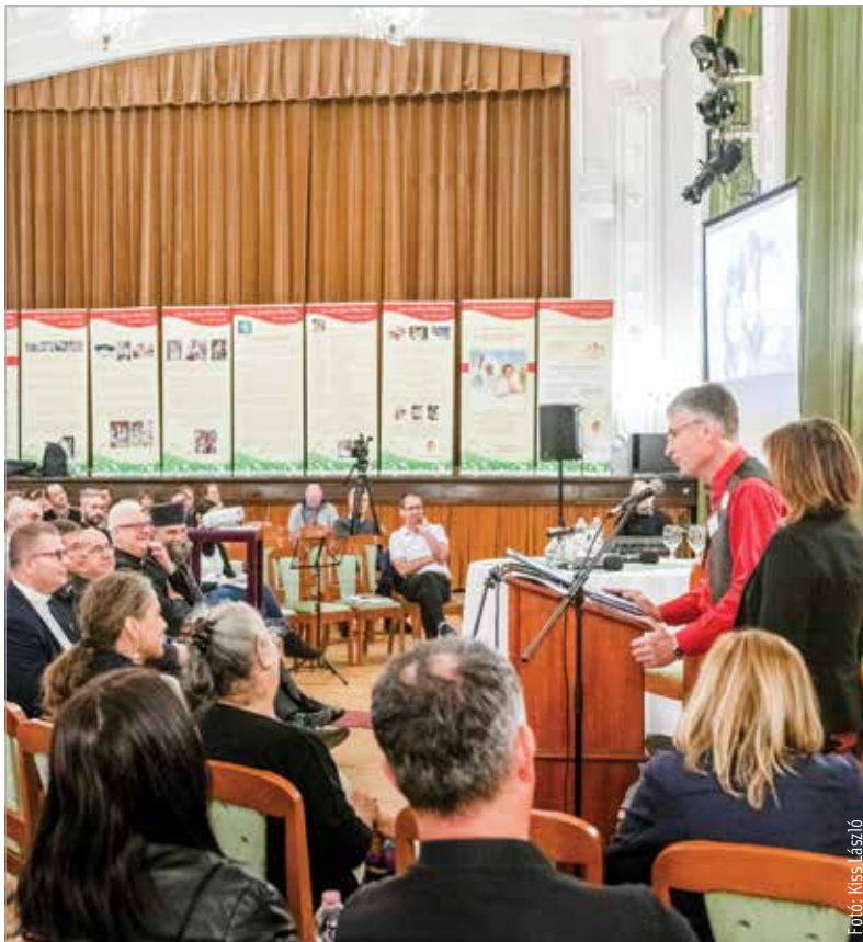
Közös ima, beszélgetések, tanúságtétel is volt a Szent István Hitoktatási és Művelődési Házban

hogyan kell hozzáállni az élethez, az élet szolgálatához, az élet elfogadásához, az élet felneveléséhez. Ezekben a kérdésekben, ahol bizonytalanságok vannak, mert sokféle vélemény hangzik egyforma erővel a világban, azt érezzük, fontos, hogy a Katolikus Egyház álláspontja is elhangozzék megfelelő erővel, megfelelő súllyal.” A nap folyamán a természetes fogantatástól a természetes halálig többféle témában tájékozódhattak a résztvevők. Szóba került a családtervezés, az abortusz, az örökbefogadás, a nevelőszülőség, a lelki örökbefogadás, a közösség megtartó ereje és az időskor. A rendezvényen standokon keresztül mutatkoztak be az életvédelem területén dolgozó szakemberek, közösségek, szervezetek.