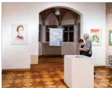
Petőfi élete, munkássága és kora ihlette a kiállításon látható műveket

A mai Magyarország területén belül Székesfehérvár ad elsőként helyet ennek a szép és elgondolkodtató kiállításnak. Büszkeség, hogy a szervezők is úgy érezték: a nemzet egykori fővárosában helye van ennek a tárlatnak – mondta köszöntőjében Cser-Palkovics András polgármester. Székesfehérvár őrzi Petőfi emlékét: ott, azon a helyen, ahol egykor maga is fellépett, a ma fiataljai vitték színre a Vörösmarty Színház produkciója keretében a Petőfi rock című musicalt az emlékévé eseményeként. A