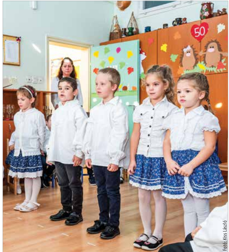
A tóvárosi gyerekek színes műsort adtak az ünnepség résztvevőinek

1973 decemberében nyitotta meg kapuit a Tóvárosi Óvoda. Akkor több mint kétszáznegyven gyerek járt ide. Az intézmény ma kisebb létszámban, ötcsoportos óvodaként működik. A nyáron felújítás zajlott: a város ötvenmillió forint