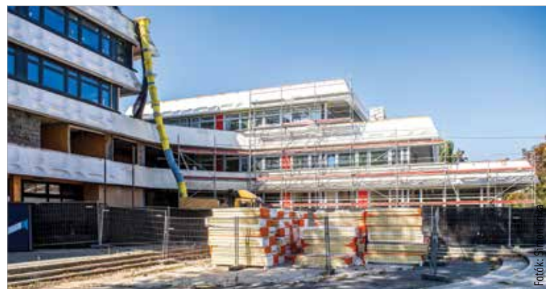
A Szabadművelődés Háza felé eső terület is megújul

Az iskolafelújítások folytatódnak. A Tópartihoz hasonlóan a Kodolányi gimnázium Ybl-épülete is teljesen megújul. A munkaterületet napokon belül átadják a kivitelezőnek.