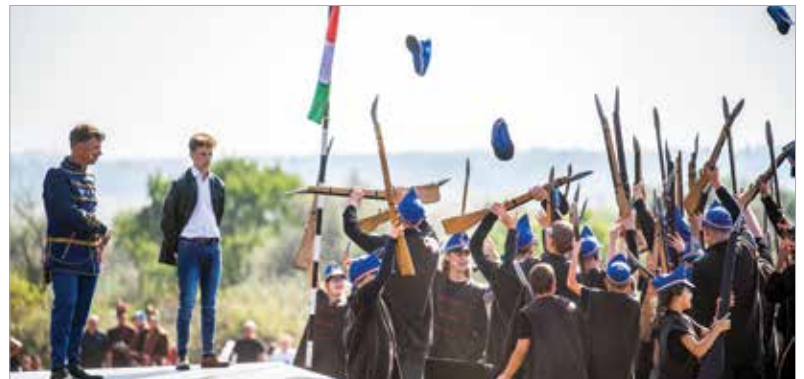
A csatát és az azt követő diadalittas pillanatokat elevenítette fel a Matuz János által rendezett előadás az 1848-as harcok helyszínén

sors valami olyat, ami testet, lelket gyönyörködteitől volt!” Molnár Ferencet október 11-én, szerdán 14 órakor kísérik utolsó útjára a Béla úti temetőben.