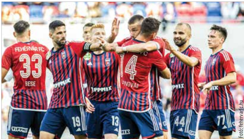
Végre volt minek örülni Sóstón! Az előrelépéshez azonban még sok ilyen meccs kellene!