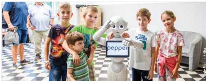
Az Alba Innovár jól ismert robotja, Pepper is ott volt a rendezvényen: táncra és zenével szórakoztatta a gyerekeket

Háromdimenziós modellezés, otthon is kipróbálható fizikai kísérletek, rádiózás és portrébeszélgetés is várta szombaton a látogatókat a Kutatók éjszakája idei rendezvényén az Óbudai Egyetem Alba Regia Műszaki Karán. Az intézmény ismét azzal a szándékkal csatlakozott a kezdeményezéshez, hogy a közönség előtt megnyithassa kapuit, bemutathassa az ott zajló munkát, továbbá minden korosztályhoz közelebb hozza a tudományok, a kutatások világát.