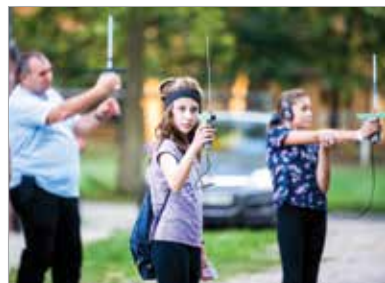
A Magyar Rádióamatőr-szövetség szakembereinek segítségével különböző kereső-kutató feladatokban vehettek részt az érdeklődők