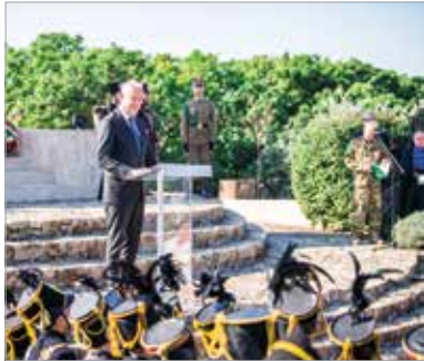
Ahhoz, hogy a békét megőrizzük, erő kell – fogalmazott köszöntőjében a honvédelmi miniszter

nek szervezett fesztivál és az 1848-as obeliszknél tartott ünnepség Novák Katalin köztársasági elnök jelenlétében zajlott. Szalay-Bobrovniczky Kristóf honvédelmi miniszter ünnepi köszöntőjében