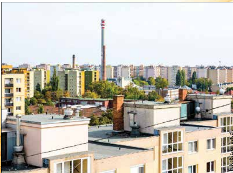
A szolgáltató készen áll a fűtés indítására

Bár szeptember tizenötödikétől már bármelyik társasház kérhette a fűtés elindítását, az idei évben az enyhe idő miatt senki nem élt ezzel a lehetőséggel. E hónap közepén azonban mindenhol elindítja a fűtést a SZÉPHŐ. „Október tizenötödikén kezdődik a fűtési idény, amikorérés nélkül is elindítjuk a fűtést. Ehhez külön igényt nem kell bejelenteni. Arra csak akkor van szükség, ha a lakók úgy gondolják, hogy még ekkor sem szeretnének fűtést. A lakásszövetkezetek esetében a fűtési megbízottak, más társasházakban a közös képviselők nyilatkozhatnak ebben az ügyben” – hívta fel a figyelmet Szauter Ákos, a SZÉPHŐ Zrt. vezérigazgatója.