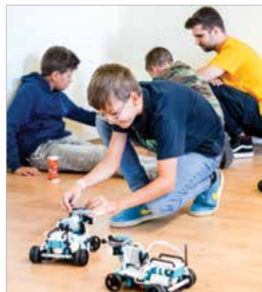
A késő estig tartó előadások mellett robotfocira és ördöglatkok megfejtésére is volt lehetőség