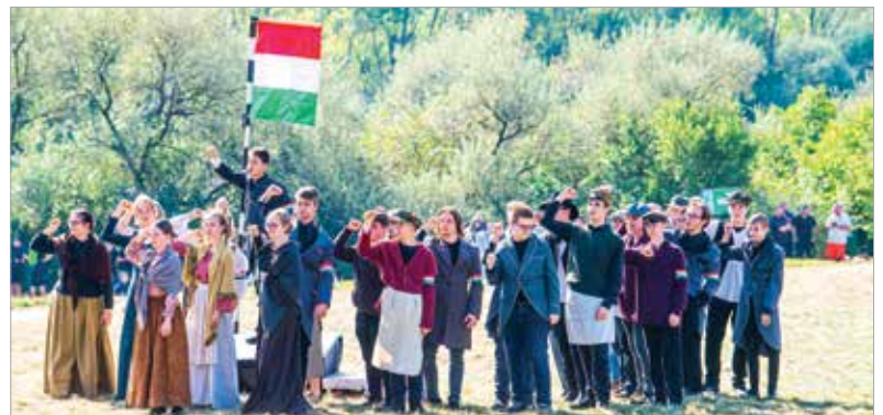
A Győzelemre születtek című produkcióban háromszáz Fejér vármegyei iskolás keltette életre a történelmet a kultikus helyszínén

a Honvéd Férfikar is részese volt a programnak. A csatabemutatón közel háromszáz hagyományőrző, negyven lovas hozta el a győzelmet. A rendezvényt Szabó Balázs Bandájának fellépése zárta.