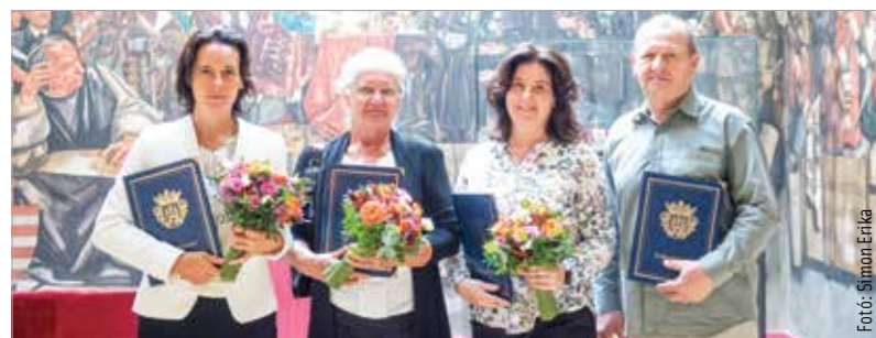
A szociális és gyermekjóléti területen dolgozók munkáját ismerték el

A fórum keretében a hosszú ideig tartó, töretlen, lelkiismeretes és szakmai hozzáértéssel végzett munkájuk elismeréseként a területen dolgozó szakembereknek Cser-Palkovics András polgármester elismerő okleveleket adott át. A kétnapos tanácskozáson a szociális és gyermekjóléti szolgáltatások rendszere, a helyi jogalkotás mechanizmusa, a szolgáltatások fejlesztésének lehetőségei és a szakmatámogatás témaköre is terültre került.