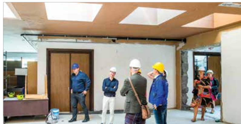
Bár az épület tavaszra újul meg, várhatóan csak a következő tanévre térnek vissza a diákok