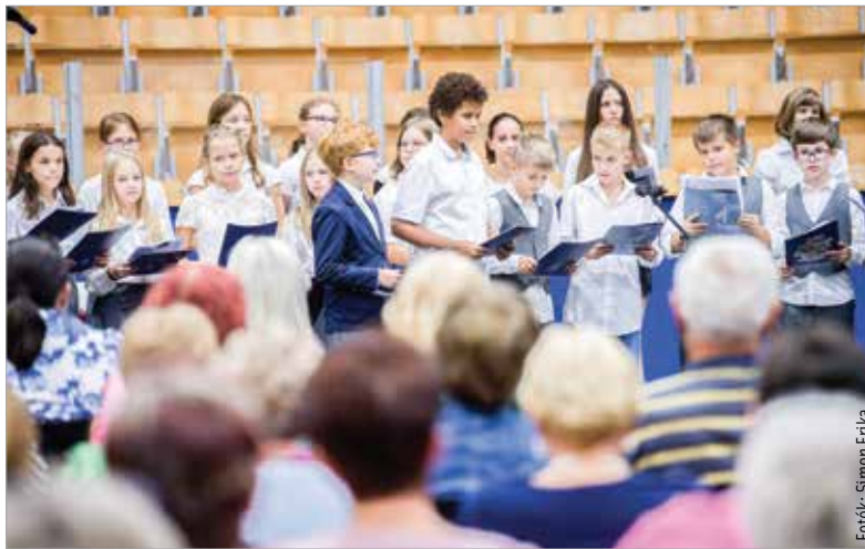
A Comenius Csufapül kórusa nagy örömet szerzett fellépésével az ünnepeleeknek

szórakoztató rendezvénnyel kedveskedjen a város az idősebbeknek, mivel nélkülük nem tarthatna itt Székesfehérvár: „Ez az alkalom arra is jó, hogy felhívjuk a figyelmet a nyugdíjasklubok hálózatára. Örül-