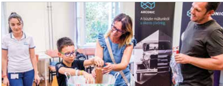
A székesfehérvári vállalatok közül az Arconic egy QR-kód segítségével előhívható kvízzjátékot hirdetett meg a Kutatók éjszakája látogatói között, valamint bemutatták, hogy a sörösdobozok akár menta és kakukkfű ültetésére is alkalmasak