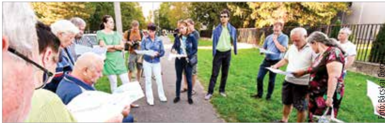
A fórumon az volt a lakók többségének véleménye, hogy a szedreskerti hőközpont előtti területre készüljön el a parkolóbővítés terve, és ne változzon az utca kétirányú forgalma