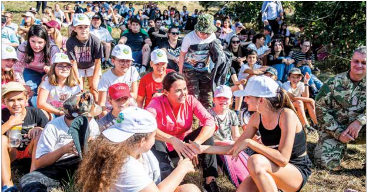
Novák Katalin köztársasági elnök több ezer gyermek társaságában nézte meg az előadást

A Magyar Honvédség megalakulásának évfordulóján a pákozdi csata emlékére szolt a díszlövés a Nemzeti Emlékhelyen. A gyerekek