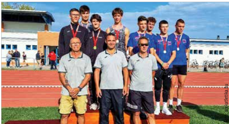
Az U-18-as csapat tagjai a dobogó tetején, edzőik előttük