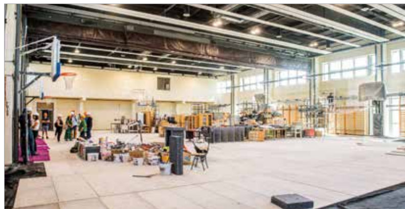
Három ütemben valósul meg a felújítás. A tornaterem már korábban elkészült.