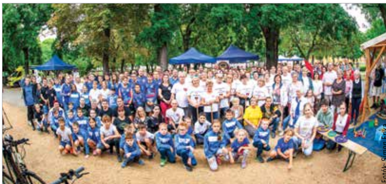
A hétfvégén több mint hetven civilszervezet mutatkozott be a Zichy ligetben, melyek többek között az egészségügy, a kultúra, a sport, a családügy, a nyugdíjasügyek és az állatvédelem területén tevékenykednek

Duplájára emelné az önkormányzat a karitatív és szociális civilszervezetek támogatását. A Cser-Palkovics András által jegyzett előterjesztés azt is tartalmazza, hogy több mint nyolcmillió forinttal segítse a város a fehérvári civilszervezetek működését – tájékoztatott Róth Péter alpolgármester: „Az elmúlt másfél év nehézségeiben partnerünk volt az önkormányzat, az intézmények és az önkormányzati cégek minden munkavállalója. Az ő fegyelmettségük teszi azt lehetővé, hogy a városi költségvetésben maradt mozgástér, és Székesfehérvár polgármestere pénteken a Közgyűlés elé azt a javaslatot tudja betervezni, hogy a karitatív és szociális civilszervezetek támogatását a duplájára emelje a város.”