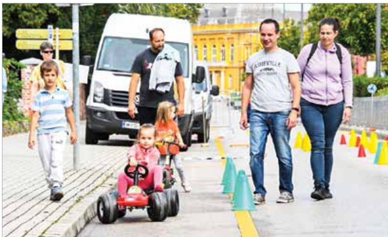
A kisebbek játszhattak az akadálypályán, és volt KRESZ-tanpálya is

ciklik, robogók is egyre fejlettebb technológiát képviselnek: „Az ilyen események azért is fontosak, mert a felnőttek mellett a jövő generációja számára is átadhatjuk az üzenetet, hogy nem autósok, gyalogosok és kerékpárosok, hanem közlekedők vannak jelen az utakon, akiknek együtt kell működniük, hiszen közösen adják egy város közlekedését. Aki egyik nap autós, a másik nap kerékpáros vagy éppen rolleres.”