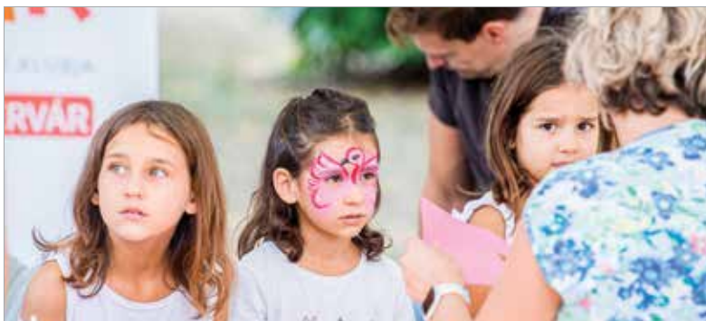
A Fiatal Családok Klubja arcfestéssel és kézműves-foglalkozással várta a kisebbeket

Az alpolgármester hozzátette: „Reményeim szerint több mint nyolcmillió forint lesz az a keretösszeg, amire a város civilszervezetei pályázhatnak, hogy a működésüket segíthesse az önkormányzat.”