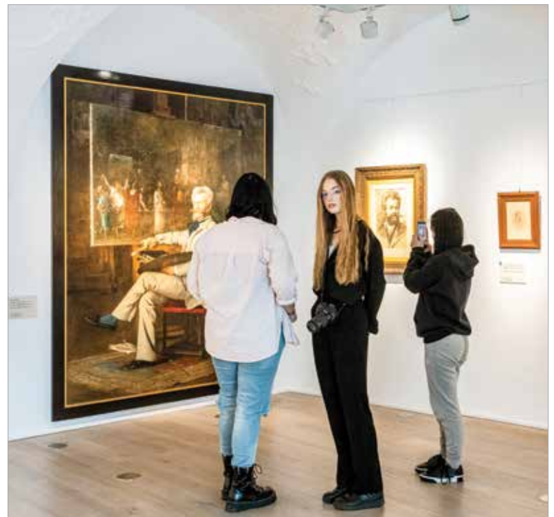
A kiállítás január közepéig látogatható