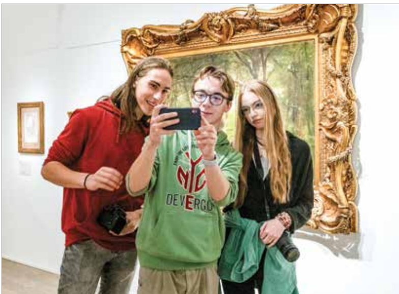
Munkácsy minden korosztály körében népszerű