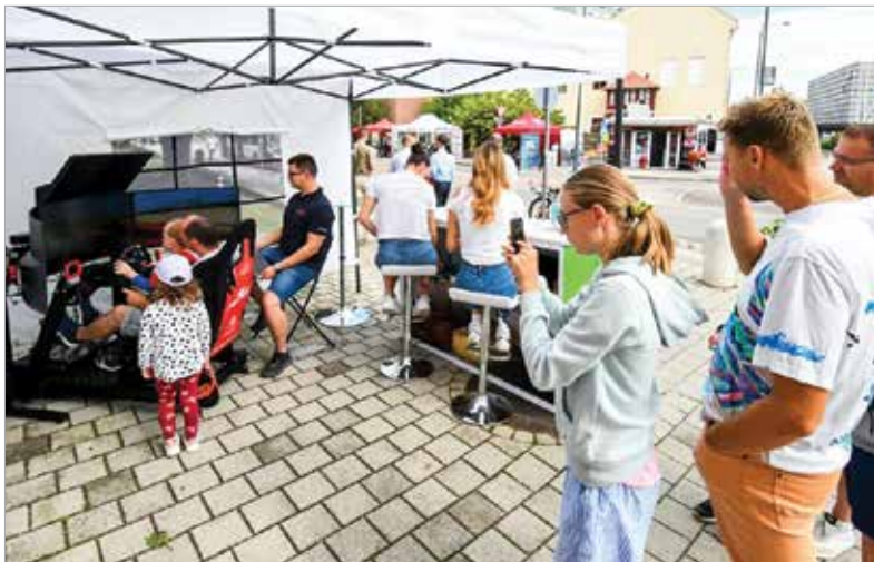
Az autószimulátor igen népszerű volt

elektromos járműveket bemutatnassák a székesfehérváriaknak: „Ezek az eszközök környezetvédelmi és közlekedési szempontból is fontosak, különösen egy városban, ahol a zaj- és légszennyezettséget is