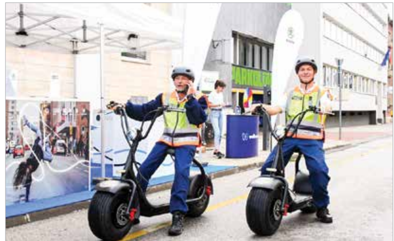
A rollerek, biciklik, robogók is egyre fejlettebb technológiát képviselnek

jelentősen csökkenthetjük velük.” A polgármester hozzátette: a kezdetek óta sok minden változott, hiszen manapság már egyre több elektromos meghajtású közlekedési eszköz járja az utakat. Pukler Gábor, a Jövő Mobilitása Szövetség elnökségi tagja szerint ezek között mindenki megtalálhatja a számára szimpatikusát, hiszen az autókban is egyre nagyobb a kínálat, valamint a rollerek, bi-