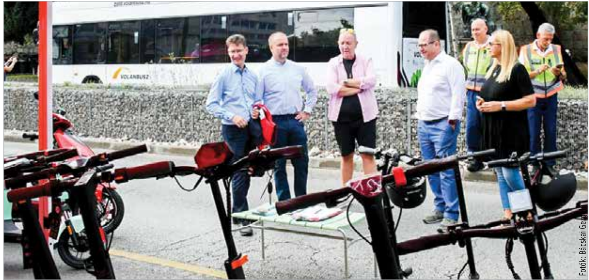
A rendezvényen az Ikarus elektromos busza próbakörre vitte a látogatókat

Ötödik alkalommal adott otthont szombaton az elektromos járművek napjának Székesfehérvár. A Rákóczi utca és a Vár körút lezárt szakaszán, valamint a Prohászka ligetben az érdeklődők kipróbálhatták a legújabb elektromos autókat, rollereket és más közlekedési eszközöket. Cser-Palkovics András elmondta: évekkkel ezelőtt azzal a céllal hívták életre a rendezvényt, hogy az akkor még gyerekcipőben járó