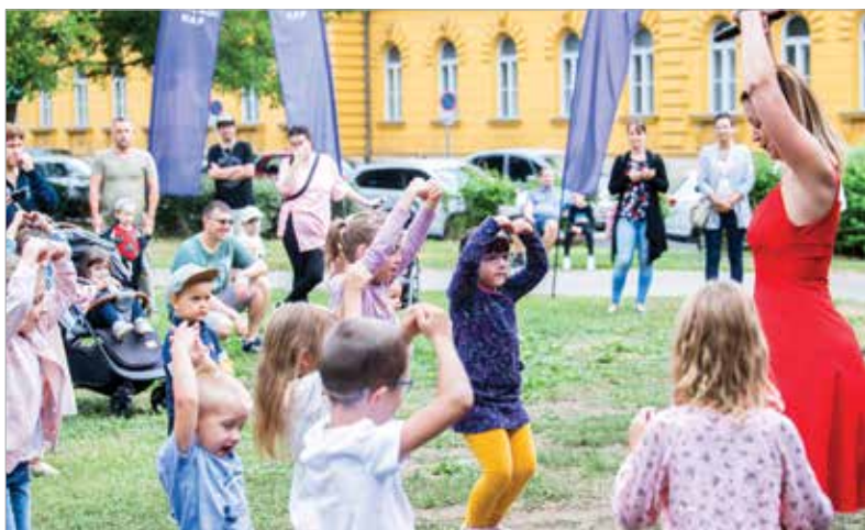
A gyerekeket a Pitypang zenekar varázsolta el