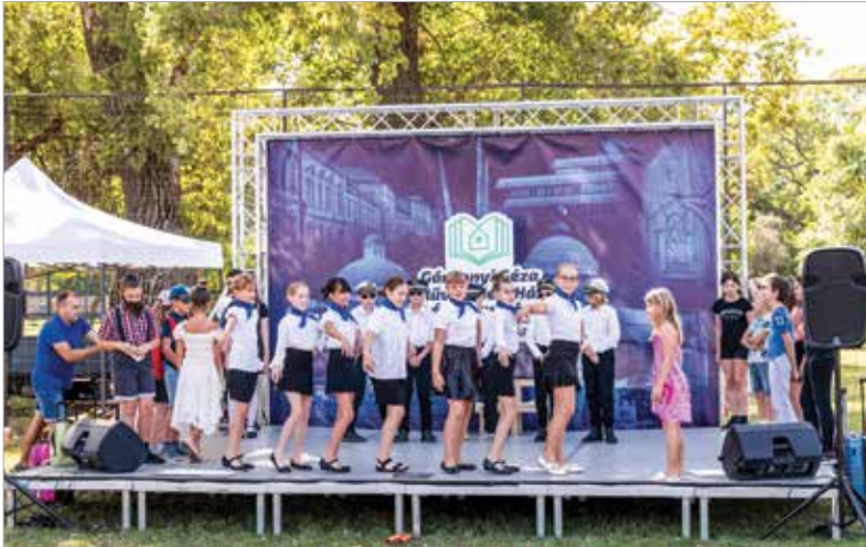
Színpadai produkciókkal készültek a maroshegyi óvodások, iskolások és a művészeti csoportok

Maroshegy legnagyobb közösségi programja a Böndörödő, melyet tizenötödik alkalommal rendeztek szombaton a Gárdonyi Géza Művelődési Házban és környékén. A jó időben több százan vettek részt a szüret köré szerveződő programsorozaton, ahol bemutattok a városrészi művészeti csoportjai, de volt örömfőzés, kiállítás, lovaskocsizás és koncertek.