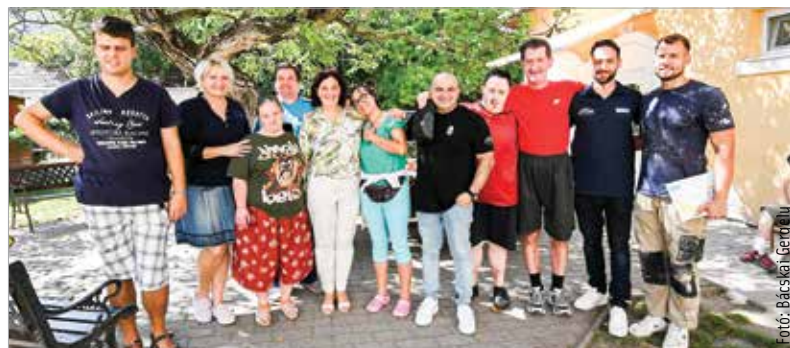
A szakemberek időt, energiát és pénzt nem sajnálva várásolták újjá az otthon fürdőszobáját, nagy örömet szereve ezzel a gondozottaknak

Sporton át mások megsegítéséig – az Adni Jó Kupa Baráti Kör Alapítvány azontúl, hogy játékonysági focikupákat rendez, sportklubok által felajánlott mezeket bocsát licitre, adományokat is gyűjt, és az ebből befolyt pénzt rászoruló családoknak vagy intézményeknek ajánlja fel.