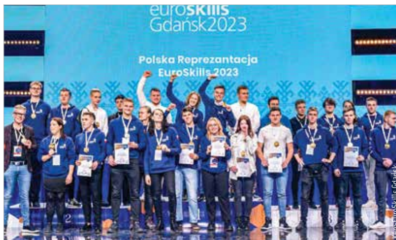
Hazánkat huszonkét versenyszámban huszonhatan képviselték