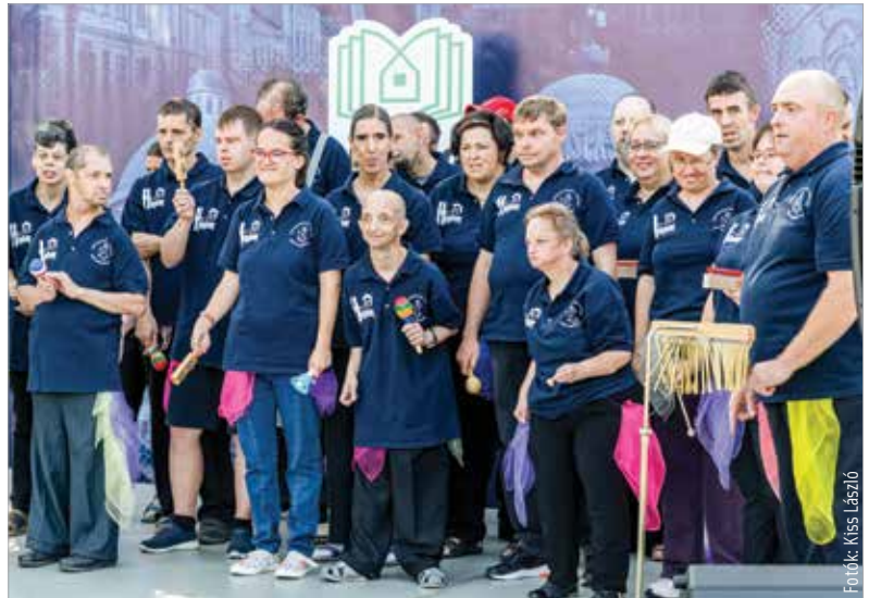
A Szent Kristóf-ház gondozottjai is színpadra léptek