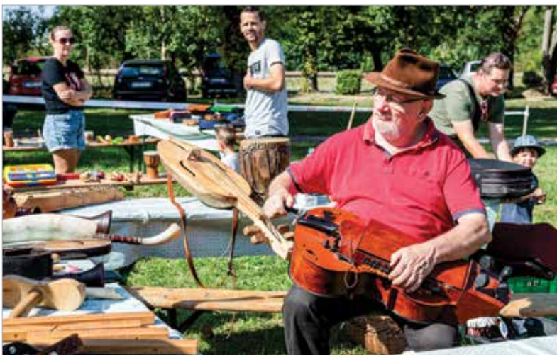
Népi hangszereket is kipróbálhattak az érdeklődők