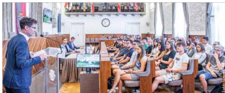
A vitafórumon a települési fenntarthatóságról beszélgettek a fiatalok, arról, hogy mitől lesz vonzó egy város a XXI. században

Középpontban a fenntarthatóság volt a Városháza Díszterme. Az ország húsz településéről érkeztek fiatalok, hogy a fenntarthatóságról beszéljessenek, hallgassanak meg előadásokat. A fiatalok, a kreatív generáció helyben tartása című konferenciát Székesfehérvár polgármestere nyitotta meg: „Az szoktuk mondani, hogy gondolkodj globálisan, cselekedj lokálisan, és ebbe az utóbbiba beletartozik az is, hogy bevonjuk a fiatalokat. Hiszen az ő jövőjükéről, az ő környezetükről van szó!” – hangsúlyozta Cser-Palkovics András. A konferenciát a Székesfehérvári Diáktanács szervezte. A fenntarthatósági napon környezettudatos vállalatként bemutatkozott a Arconic-Kőfém Mill Products Hungary Kft. A karbonlábnyomról, az ipari létesítmények károsanyag-kibocsátásának csökkentéséről is hallhattak a résztvevők. A rendezvényen a vállalat ügyvezetője, Varga Zsuzsa adta át az Arconic Alapítvány huszonezer dolláros támogatását, mellyel a Junior Achievement Magyarország fenntarthatósági programjait segítik.