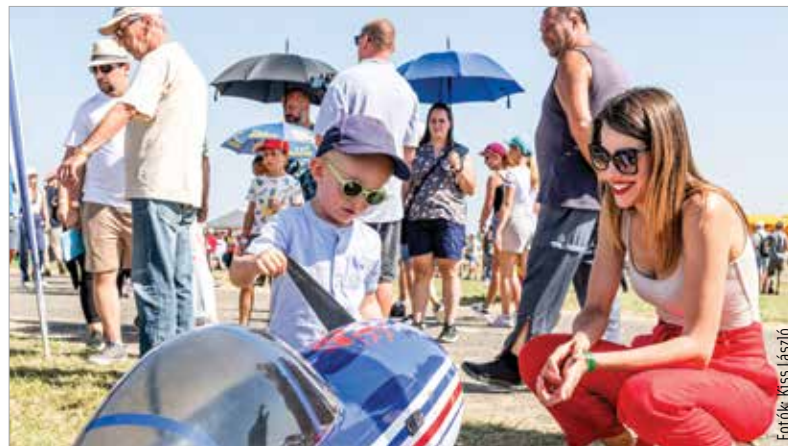
Nagyok és kicsik is találtak számos érdekességet