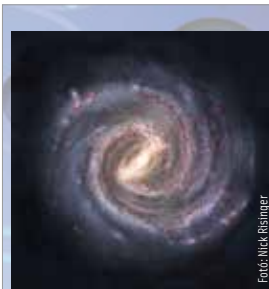
2023. szeptember 14-20.

A rendezvénysorozat zárasaként idén is megrendezik a Gurulj velünk! elnevezésű kezdeményezést, melynek során a legkisebbek kismotorjaikon és kerékpárjaikon vonulnak fel a Gáz