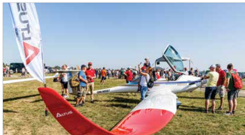
Közelről is meg lehetett csodálni a gépeket