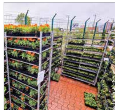
Nemcsak a virágok, hanem a komposztáló és az esővízgyűjtő esetében is kérnek képeket arról a helyről, ahová azt szeretnék elhelyezni

Hétfőn reggel elindult a Virágos Székesfehérvár pályázat regisztrációs időszaka a Városgondnokság külön erre a célra létrehozott felületén. A www.viragosfehervar.varosgondnoksag.hu oldalon lehet leadni a pályázati igényeket szeptember huszonegyedikéig. Egy ingatlanra csak egy pályázat érkezhet, és az igénylőnek döntenie kell, hogy virágot, komposztládát vagy esővízgyűjtőt szeretne. A növények, a komposztládák és az esővízgyűjtő tartályok átvétele Székesfehérváron lesz, a pontos helyszín azonban csak a