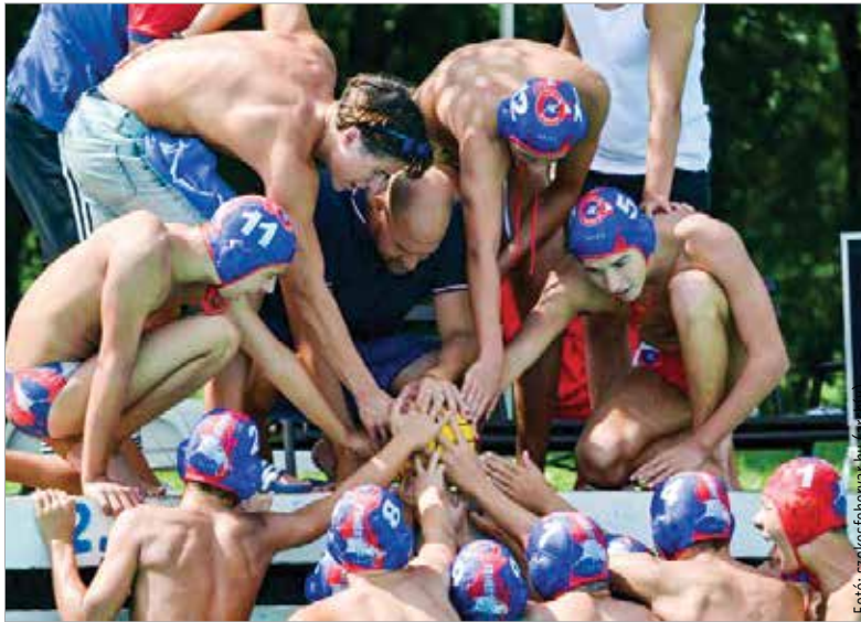
Egységben az erő: mindhárom korosztály jó teljesítménye kellett a feljutáshoz