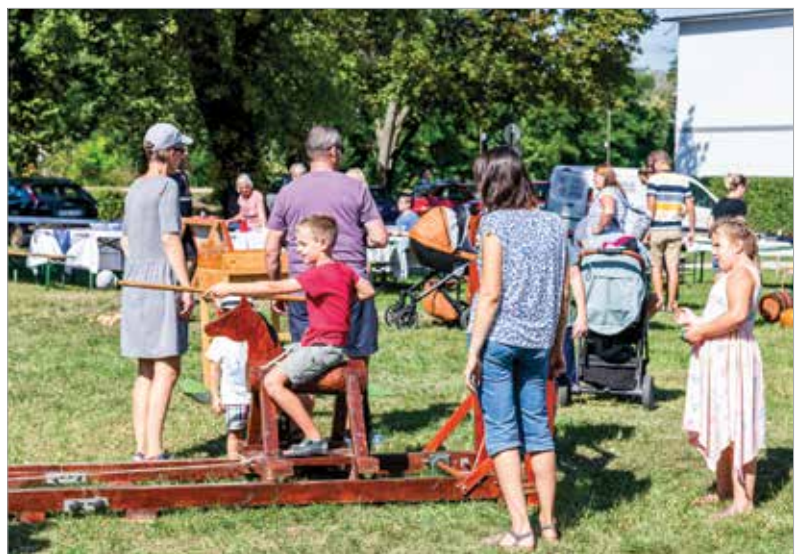
Volt lehetőség lovaglásra, lovaskocsizásra, népi játékok kipróbálására is