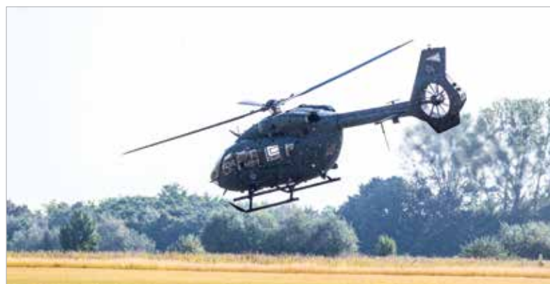
Helikopterek is érkeztek a rendezvényre