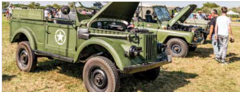
Égész nap bemutatókkal várták az érdeklődőket