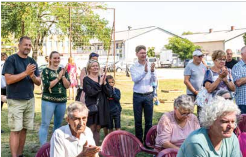
Minden adott volt ahhoz, hogy a vendégek jól érezzék magukat a Maroshegyi Böndörödőn