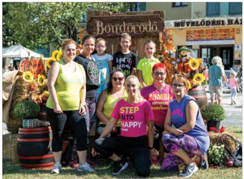
A szüreti multság immár a városrészi legnagyobb közösségi programja