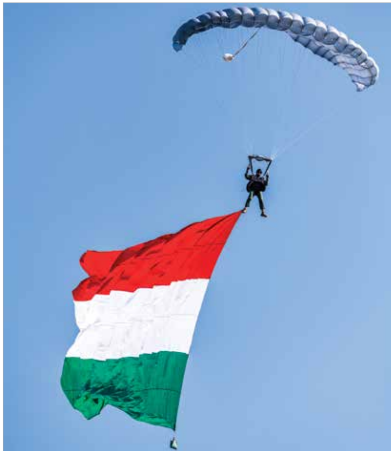
Érkezés nemezeti színű zászlóval

Az idei immár a huszonnyolcadik alkalom volt, hogy a repülés szerelmeseit repülőnapra várták Börgöndre. A légiaradé azonban egy tragikus balesettel zárult.