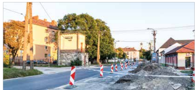
Az épülő körforgalom komoly torlódásokról mentesítheti a csomópontot

Megállási korlátozást vezettek be a Móri úton az Irányi Dániel utca és a Szent Vendel utca közötti