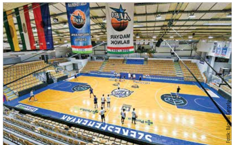
Az önkormányzat és a klub közösen dolgozik a csarnok felújításán

Az energetikai korszerűsítések mellett az első ütemben felújították az épületben lévő öt apartmant, a vizesblokkokat és az egészségügyi szobát is