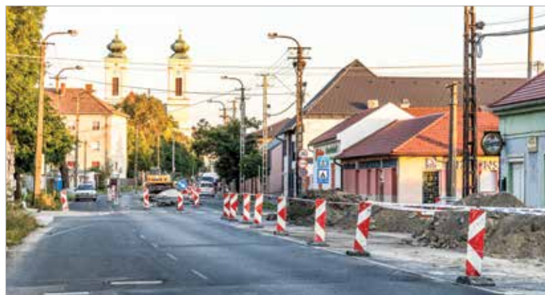
A Móri útról nem lehet behajtani a Szent Vendel utcába, a Malom utca irányából pedig zsákutcaként működik

be. Ezzel együtt megváltozott a parkolási rend is, a páratlan oldalon megállási tilalom lépett életbe. Ezzel a forgalmirend-változással a Malom utca megközelíthető és elhagyható a Móri út irányába. A Móri út felújításával kapcsolatosan korábban bevezetett forgalmkorlátozások érvényben maradnak.