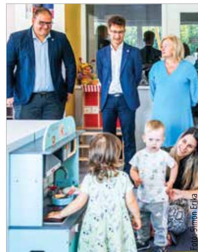
A legmodernebb körülmények várják a gyerekeket az új maroshegyi bölcsődében

„A gyerekek már birtokba vették a bölcsődét. Jó volt látni őket, hiszen nekik épült körülbelül egymilliárd forintos uniós forrásból, önkormányzati beruházásként. Nagyjából egy év alatt készült el, és nagyon szép kivitelezést láthatunk!” – mondta a bejáráson Cser-Palkovics András polgármester. A városrészen önkormányzati képviselője, Brájer Éva elégedett az elkészült épülettel. Mint mondta, az építészeti megoldásokon túl a játszóeszközök minősége, funkciói is kiválóak, így ideális környezet fogadja a gyerekeket. A minden igénynek megfelelő intézményben négy csoportszobát