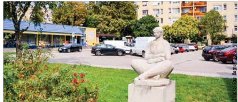
Az Ülő nő 1965 óta az Eszperantó téren figyeli a város forgalmát

Gádor Magdának összesen tizenöt köztéri alkotását tartják számon hazánkban. Egy-egy alkotása Szlovákiában, Németországban és az Alaszakai Nemzeti Parkban is megtalálható. A sorban az első az 1961-ben a fővárosban felavatott Ülő fiú névre keresztelt ivókut volt. Érdekes, hogy első három köztéri alkotása ülő alakot formál: az 1961-es, budapesti Ülő fiú után