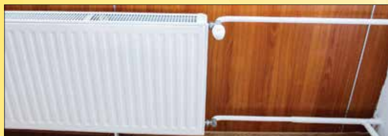
A fűtés elindításához elengedhetetlen, hogy a házakban folyó átalakítások, felújítások, radiátorcserék mielőbb befejeződjenek!

már csak hiba esetén tudnak leürítésre vonatkozó kérést fogadni, illetve a következő napokban leürítendő rendszerek az idő rövidsége miatt valószínűleg már csak szeptember közepe után kerülnek visszatöltésre. Bár a fűtési idény hivatalosan október tizenötödikén kezdődik, rossz idő esetén akár már egy hónappal korábban is befűthetők a távhős ingatlanok. A lakók