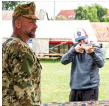
A pontos lövések gyakorlása kicsit mást jelentett, mint a jég

Cser-Palkovics András polgármester az új csarnok építéséről is beszélt a találkozón: „Ott tart az építkezés, ahol az ütemterv szerint tartania kell, így nem lesz akadály annak, hogy december végén, januárban megtörténhessen a műszaki átadás. Ezután kezdődhet el az engedélyezési eljárás, ami hatvan-kilencven nap. Eppen ezért úgy döntöttünk a klubbal, hogy a csapat a Raktár utcában kezdi az idényt, és ott is fejezi be. Amikor a bajnokságnak vége lesz, akkor költözik majd át a klub az új otthonába. Ennek az idejű csapatnak pedig az is feladata lesz, hogy felkészítse a szurkolókat és a hazai jégkorongbarátokat arra, hogy belépünk egy 21. századi csarnokba, ami nagyobb, mint a Raktár utca, így nézőszámot is lehet növelni!”