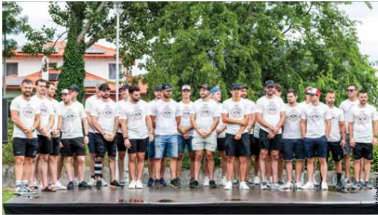
Jégre készülnek, de most színpadra léptek a fehérvári játékosok

Akadálypályával, dedikálással, szurkolói kérdezz-felelekkel és izgalmas feladatokkal várta a Hydro Fehérvár AV19 és a honvédség sportszázada a résztvevőket. Elhangzott, hogy izgalmas szezon elé néz a fehérvári hokiklub, hiszen a keretben és az edzői stábjában is tör-