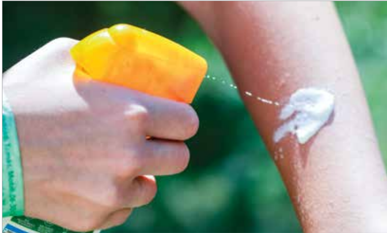
A napfény elleni védelmet ne vegyük félvállról!