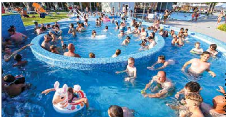
A legnagyobb sláger mindig az élménymedence!