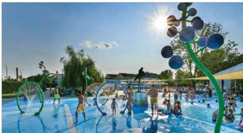
A gyerekek felhőtlenül élvezik a vízi paradicsomot