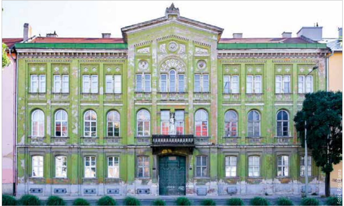
Az épületet valószínűleg Ybl Miklós tervezte

A Vörösmarty tér a régi épületek iránt rajongók számára kihagyhatatlan élmény. A különleges építészeti megoldások, érdekes vonalvezetések mellett a házak díszítőelemnek szánt műalkotásai is gyönyörűek és egyediek. A tér helyén korábban hosszú ideig majorság működött. A XIX. században a vár déli sarkának megnyitásával, valamint az áthaladó forgalom erősödésével szerepe felértékelődött. A tér forgalmának rendezése és első kialakítása az 1870-es évekre fejeződött be, a tér közepén ekkor egy liget állt. Évtizedekkel később a forgalom erősödése miatt változtatni kellett ezen az állapoton. A Vörösmarty-szobor és a 69-es gyalogezred Bory Jenő által készített emlékművének átköltöztetése után alakult ki a végleges állapot. A Vörösmarty tér 5. alatti ház valamikor 1860 körül épült, csakúgy, mint a tér házainak nagy