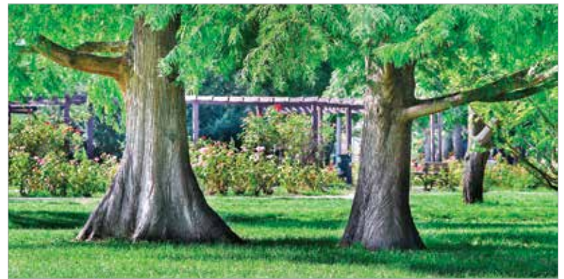
Mocsári ciprusok a Rózsaliigetben

zösségi oldalain egy-egy balesetveszélyes fa kivágásakor gyakran kapnak hideget-meleget, ám a városi környezetben mindennél fontosabb szempont, hogy ne