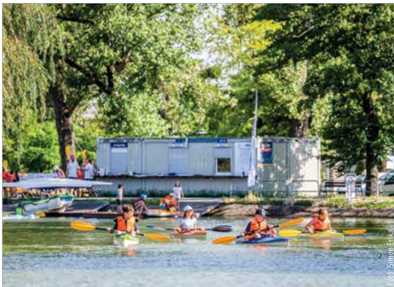
Várják azokat a gyerekeket is, akik a versenyzést is kipróbálnák!

elnöke elmondta, hogy az összes hajót igénybe vehetik a székesfehérvári iskolák és a máshonnan érkező, maximum húszfős csoportok, előzetes egyeztetés alapján. Ehhez időpontot kell kérniük a vitalclub@vitalclub.hu e-mail-címen. Szipola Antal hozzátette, hogy a nagyközönségnek szóló szabadidős tevékenységek mellett folyamatosan, a hét minden napján zajlanak a versenysporttal kapcsolatos foglalkozások, amire várják azokat a gyerekeket, akik szívesen kipróbálnák magukat, és akár versenyeznének is!