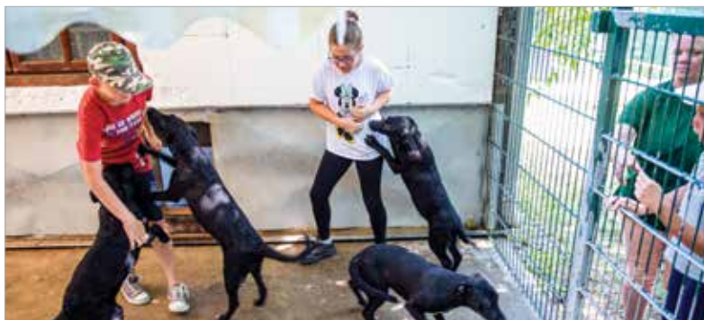
A HEROSZ táborát nemcsak a gyerekek, de a gazdira váró állatok is nagyon szeretik