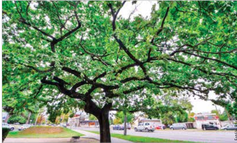
Székesfehérvár legidősebb fái több mint százévesek. A Haleszban, az 1848-as emlékmű és a Kossuth-cimer mellett áll a város legidősebb kocsányos tölgye.

A városban nyolcvanezer közterületi fa található, melyek fenntartása, gondozása folyamatos munkát jelent a szakembereknek. Székesfehérvár Városgondnokságán két faápoló szakmérnök is dolgozik. „Szerencsére olyan sok fa van Fehérváron, hogy nehéz minden egyedre figyelni, éppen ezért nagyon köszönjük a hibabejelentőnkön keresztül érkezett lakossági jelzéseket, hiszen a fényképes bejelentések nagyban segítik a munkánkat!” – emelte ki a viharok kapcsán Homoki László, a Városgondnokság parkfenntartási vezetője. Fehérváron a platánok és a tölgyek bírják a legjobban a városi környezetet, a kőrisek és a fűzfák pedig