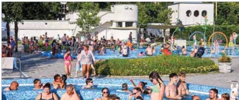
Akkor is érdemes kimenni a strandra csobbanni egyet, ha csak munkaidő után érünk rá: délután négytől minden belépő féláron váltható!