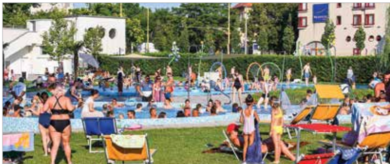
Hőségriasztás esetén este nyolcig tart nyitva a Városi Strand

Kiemelkedően forró időszak van mögöttünk, az elmúlt napokban országos hőmérsékleti csúcsok dőltek meg. Ilyen időben pedig aki csak teheti, a hűsítő habokban élvezi a nyarat. Székesfehérváron rengetegen tettek így az emberpróbáló kánikula idején!