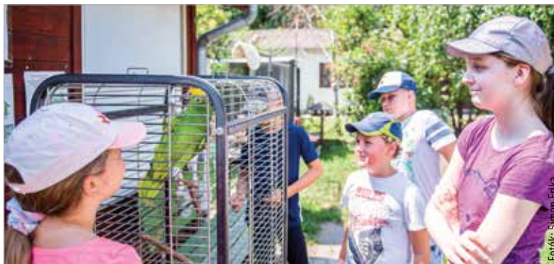
A gyerekek állatszeretetről és -gondozásról, felelős állattartásról is sokat tanulnak a Takarodó úton