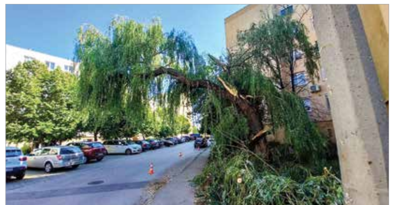
Nemrég a Sziget utca 35. előtt életveszélyes állapota miatt kellett kivágni egy fűzfát

ágak miatt esetlegesen megrongálódo vagy leszakadó vezetőkekre kell gondolni, hiszen a fa képes vezetni az elektromosságot!” – hangsúlyozta Homoki László.