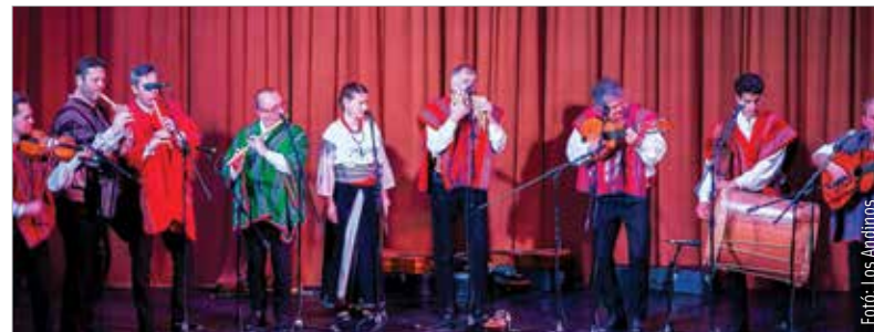
Az idén negyvenéves Los Andinos július huszonkettedikén a Zichy ligetben lép fel jubileumi műsorával