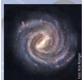
2023. július 20-26.

Hivatásod területén feszültebb, de egyben pezsgőbb is lesz a helyzet, mint általában. Nagy szükség lesz a tervezőképesedre. Ne hagyj, hogy mások türelmetlensége vagy túlzott optimizmusa tévútra vezessen! Saját intelligenciád és gyakorlati érzéked meghozza a kívánt eredményt.