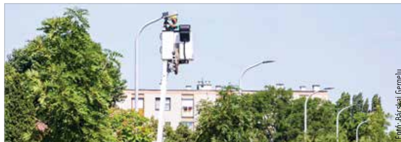
Év végéig mind a tizenegyezer fehérvári lámpatestet kicserélik LED-esre a közvilágítás-korszerűsítés keretében. A munkálatokat emelőkosaras autók segítségével több csapat végzi hétről hétre más területeken. Hogy adott héten mely utcákban kell számítani munkavégzésre, a szekesfehervar.hu oldalon minden hétfőn közzéteszik.