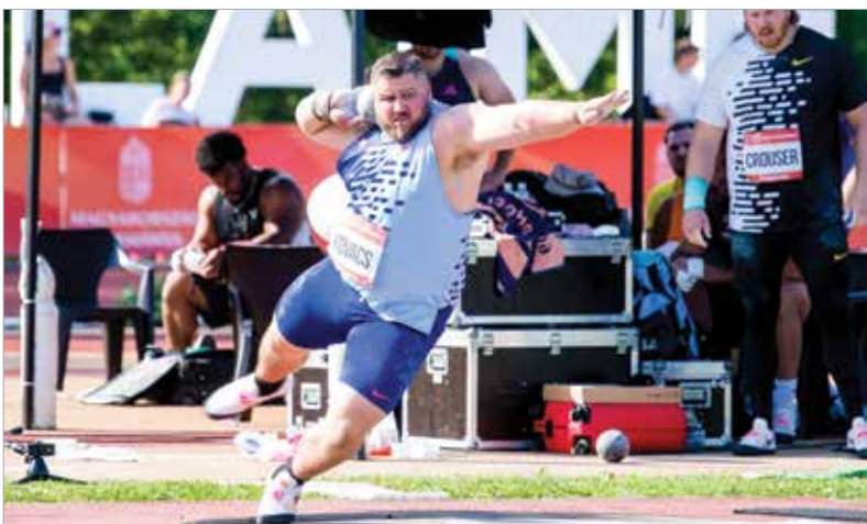
A férfi súlylökésben a Gyulai Memorial versenycsúcsát tartó, magyar származású Joe Kovacs idén a második helyen zárt Ryan Crouser mögött