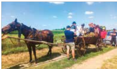
Egy másik forgatási helyszínen, Dinnyésen lovas szekérrel is filmezett a tábl

Különleges eseményre lehetnek figyelmesek a hétvégén a 62-es úton közlekedők, ugyanis filmforgatás zajlott a Börgöndpuszta melletti búzátáblában. A Haza! – Lantai Májor József szibériai hadifogolynaplója című film megalkotása Kovács Szilvia, a