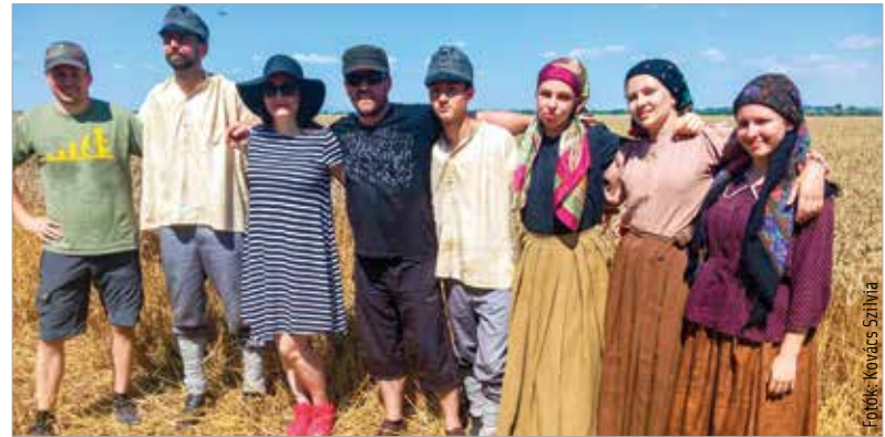
A film egyik jelenetét egy búzátáblában forgatták