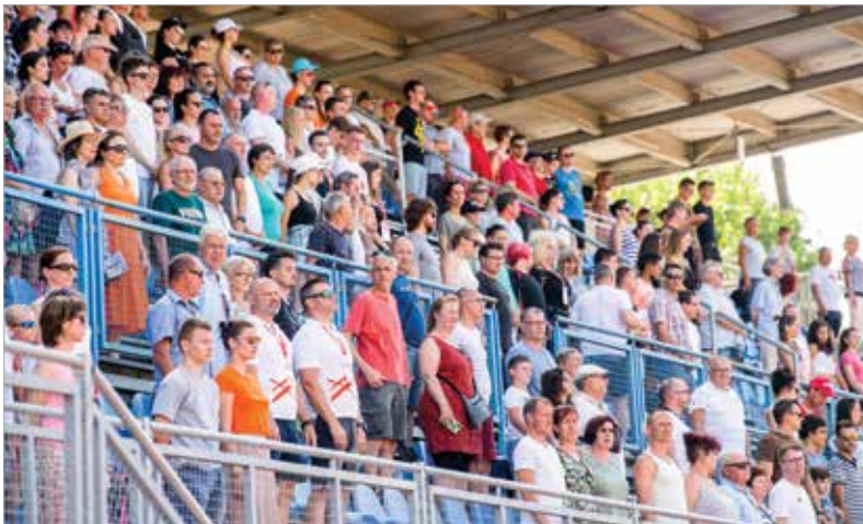
A rekkenő hőségben is sokan voltak kíváncsiak az atlétika sztárjaira

A rekkenő júliusi hőségben is szép számmal látogattak ki a szurkolók a Bregyó közti Regionális Atlétikai Központba kedden. A Székesfehérváron tizedik alkalommal megrendezett Gyulai István Memorial Atlétikai Magyar Nagydíj délután kettőkor a férfi kalapácsvetéssel kezdődött. A magyar és külföldi atléták fantasztikus teljesítményekkel kápráztatták el a nézőket: tizennégy különböző nemzet sportolója nyert érmet, a jamaikaiak három aranyat is szereztek!