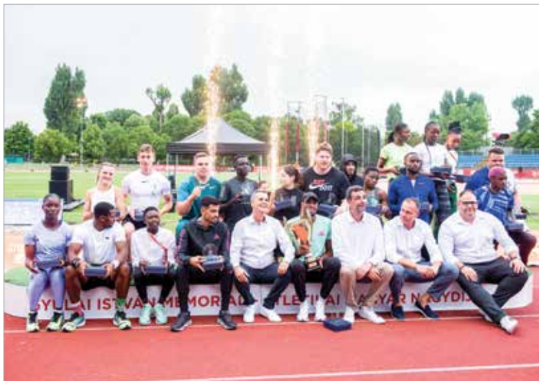
Ismét nagy siker volt a székesfehérvári verseny!