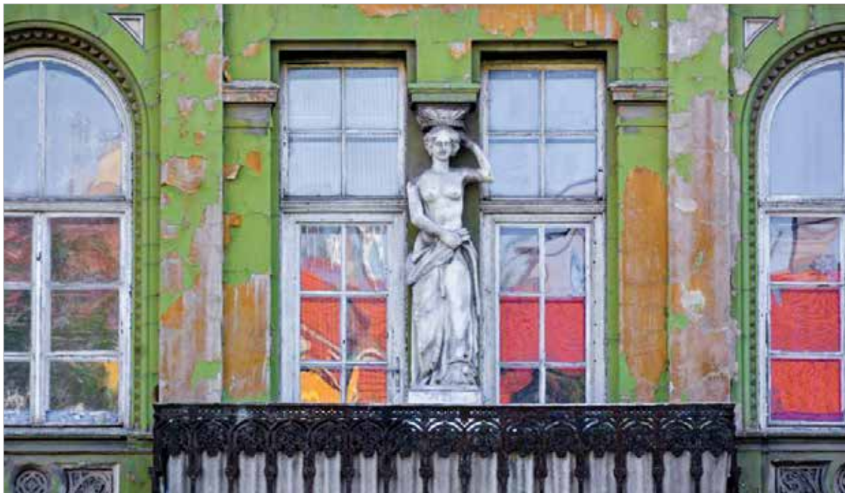
A kariatida erkély- vagy párkányhordozó nőalak az ókori görög építészetben

A fenti sorok gyakorlatilag arra is megadják a választ, mi is az a kariatida: oszlop helyett alkalmazott nőalak, erkély- vagy párkányhordozó az ókori görög építészetben. Leginkább a jón oszlopokat helyettesítette, legszebb antik példája az athéni Erekhtheion oszlopcsarnoka az Akropoliszon. A fehérvári nőalak keletkezése szinte biztosan a ház építésével egyezik meg, valamikor 1860 körül készülhetett. A művész személye sajnos ismeretlen, ennek ellenére elismeréssel adózunk neki, hiszen egy, a város utcaképéhez százhatvan esztendeje hozzátartozó alkotással gazdagította Székesfehérvár műtárgyainak sorát!