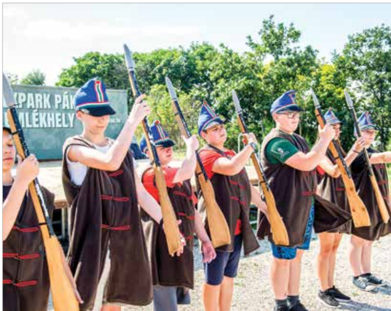
A Honvéd Hagyományőrző Egyesület idén a százhetvenöt éves Magyar Honvédség története köré építette fel hagyományos nyári táborát

A nyár a szabadság, az ünneplés időszeke a gyermekek számára. Székesfehérváron pedig rengeteg tábor kínál lehetőséget arra, hogy a szülők jó helyen tudják a kicsiket és a nagyokat is, a fiatalok pedig életre szóló élményeket, új ismereteket és barátokat szerezhetnek.