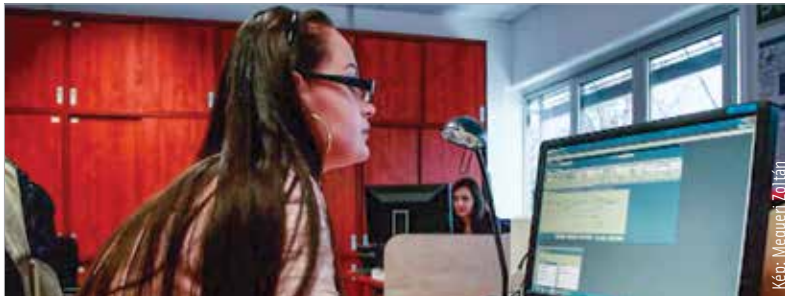
Diákmunkát vállalni már tizenhat éves kortól lehet