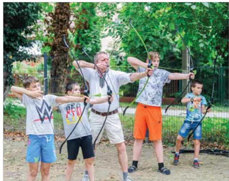
...és az íjászat érdekelte