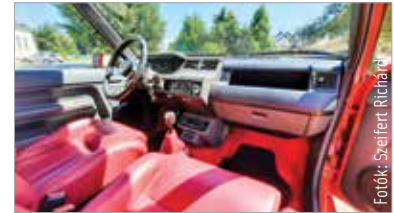
Se légszák, se légkondi, mégis vonzza a sofőrt a beltér

első pár darabot készítette így, ezek voltak a demóautók. Ami vásárlóhoz került, azt már automatával szerelték. Ezek után nem is tudok mást mondani, mint azt, hogy köszönjük a tulajdonosoknak, hogy megbíztak bennünk, és elhozták megmutatni féltett kincseiket! Ezzel ugyanis gazdagítják műsorunkat, egyes darabok pedig visszarepítik a nézőket is gyerekkorukba. Ne feledjék: július 8-tól kéthetente szombaton 18.25-kor KocsiZoom a Fehérvár Televízióban! Ha pedig lemaradnának az adásokról, a Fehérvár TV Youtube-csatornáján bármikor megnézhetik az előző évad összes műsorával együtt.