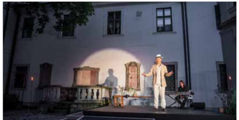
Új műfaj született, a régész színház. Schliemann kalandjain keresztül élhetik át a nézők Trója felfedezését.