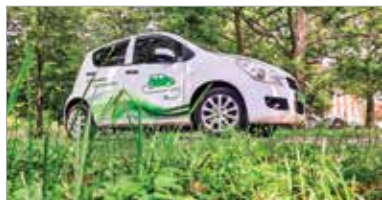
Ha más nem, a matricázás árulkodó lehet, hogy ez nem egy szokványos Suzuki Splash

Elég egy kicsit jobban odafigyelünk, és máris olyan csemegéket kínál számunkra az utca, hogy csak kapkodjuk a fejünket! Rengeteg történet, amik mind kameráért és értünk kiáltanak. Sokat töprengtem az első évad alatt, hogyan szerezzek be minél korábbi évjáratú autót. Szerencsére akadt segítóm, de valahogy a második felvonásra csupa olyan négykerekűt sikerült összehoznom, melyek elődeit szinte lehetetlen leva-