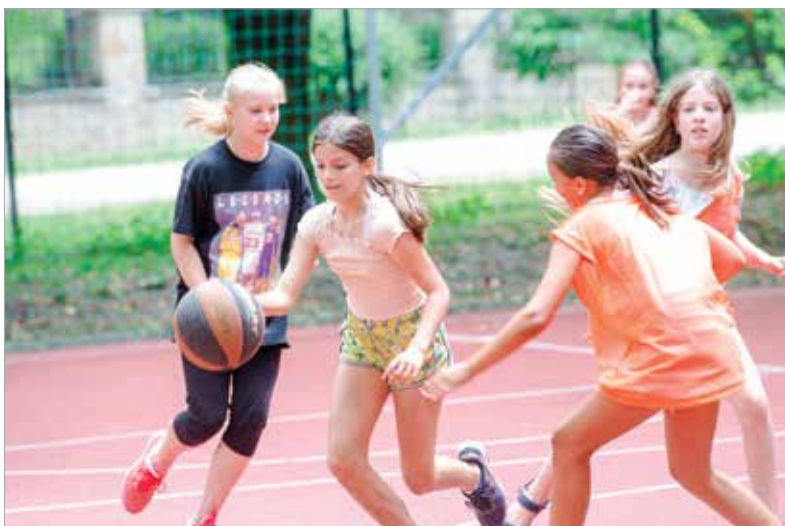
A lányok ezúttal a kosárlabdát választották