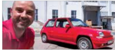
Tömény élmény: elég csak a GT Turbo mellett lenni!

dászni. Vagy legalábbis olyat találni, ami működik. A legújabb adásokra éppen ezért újraterveztem a használt autós blokkot. Szerencsére szinte az orrunk előtt hevernek a témák! Mert bizony Székesfehérváron is vannak olyan gépcsodák, melyek ma már külföldön is ritkaságnak számítanak. És ami talán a legmeglepőbb: tulajdonosaik ha nem is napi szinten, de viszonylag sűrűn megjárják őket. Belebotlottam például egy tűzpiros Renault 5 GT Turbóba. Egy 1987-es évjáratú francia hot hatch, a hős turbós korszakból. Ez az autó az igazi, régi vágású feltöltős erőforrások egyik gyönyörű példánya. Ha a sofőr nem tisztelte, akkor hamar kiderült, mi mindenre képes a fizika! És pont