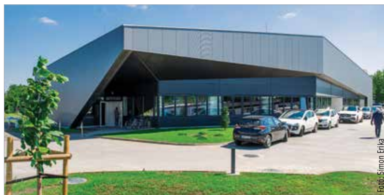
A modern, harmincnégy szobás Sóstó szállóban tárolók, betegszobák és közösségi terek is helyet kaptak

A zöldmezős beruházás jóvoltából a korábbi lovarda helyén évekig parlagon álló terület most újra hasznos funkciót kapott, és a szálló hat új munkahelyet is teremtett a városban. A létesítmény 1,3 milliárd forintból épült, amihez közel hatszázmillió forintot támogatást biztosított a kormányzat.