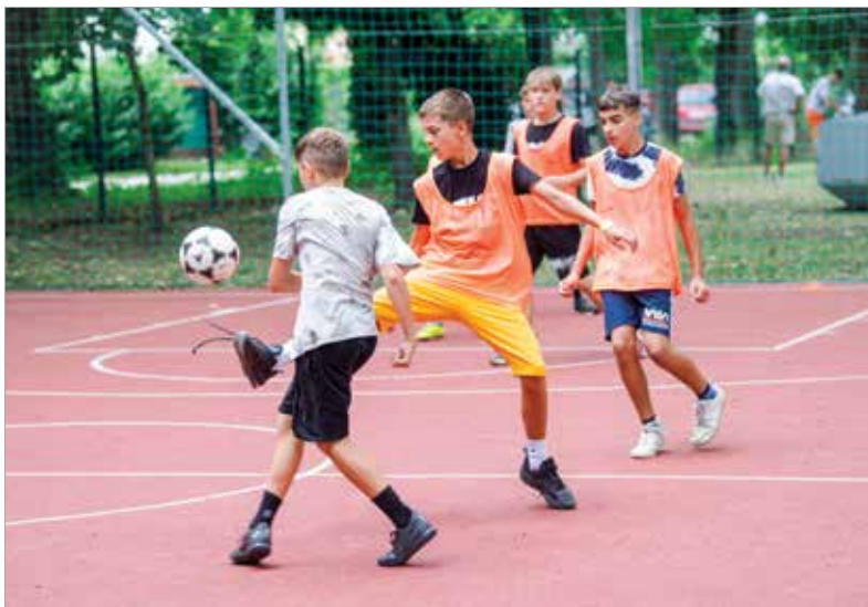
A fiúkat főleg a foci...