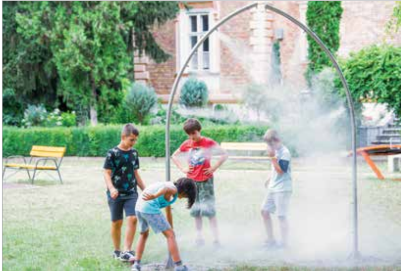
A nagy melegben jólesik a felfrissülés a párákapuk alatt

Az előző évek gyakorlatához hasonlóan idén is várja a fehérvári diákokat a Velencei Gyermekek és Ifjúsági Tábor. A Városgondnokság és az önkormányzat ezúttal július elején, két turnusban fogadja a táborozókat. Az első hét a sport jegyében telik, míg a másodikon a kultúráé lesz a főszerep.