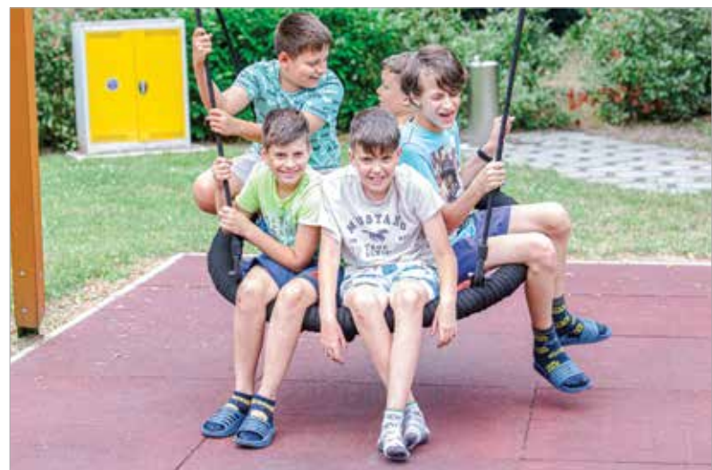
Sok jó ember kis helyen