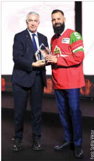
Szélig Viktor a Hírességek Csarnokában ötödik magyar tagja

Kercsó Árpád-nál kezdtem el a játékot, megismerkedtem az alapokkal, és ott fogtam először ütőt a kezembe. Előtte még csak nem is láttam hokiütőt. Mindannyian neki köszönhetjük, hogy eljutottunk egy olyan szintre, amire már felkapta a fejét Európa. Az volt a későbbi sikerünk kulcsa, az előrelépésünk alapja, hogy a Magyar Jégkorongszövetség is támogatta