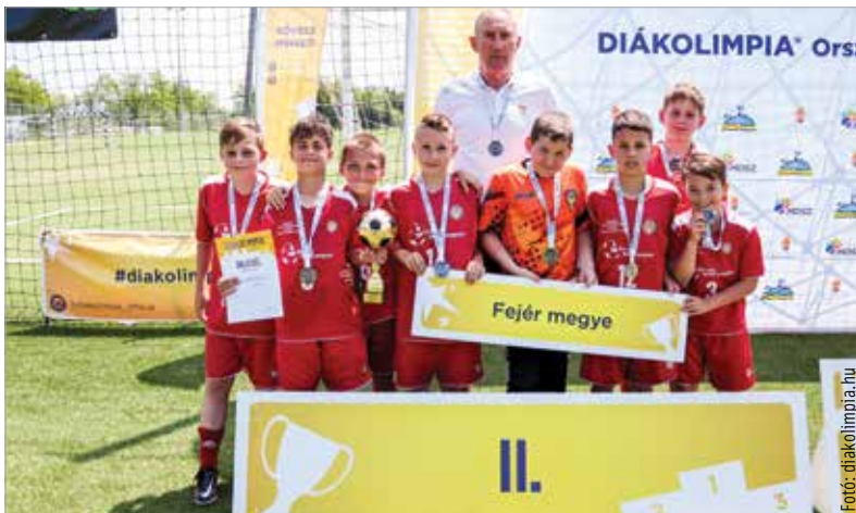
Diákolimpiai hagyományaihoz méltón szerepelt az idei döntőben a Vörösmarty