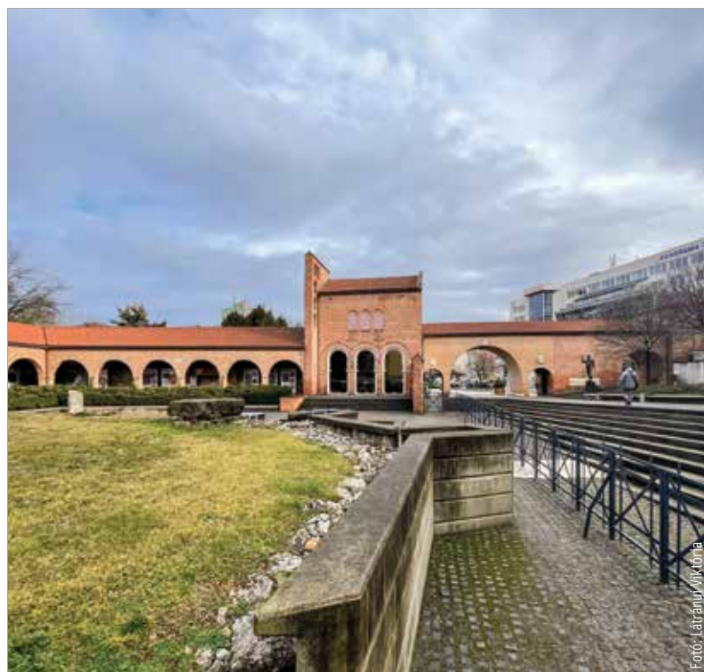
A cél közös: egy méltó emlékhely kialakítása

feltétele volt, hogy Székesfehérváron koronázzák meg a Szent Koronával, az esztergomi érsek által.” A miniszteri biztos felidézte, hogy 2014-ben úgy indult el az Árpád-ház kutatása, hogy bíborosi engedéllyel a Mátyás-templomban timent vehettek az ott elhelyezett tizenegy, királynak tartott csontvázból. Ezekből és III. Béla DNS-ének a segítségével ezután sikerült meghatározni az Árpádok férfitagjaira jellemző haploidot. Mostanra pedig már a Hunyadiak genomját is sikerült meghatározni, ami hamarosan várhatóan megtörténik a vegyes házi királyainkkal is. Kérdésünkre, miszerint lehet-e az a cél, hogy akit Fehérváron temettek el, az a koronázóvárosban kerüljön végső nyughelyére, Kásler Miklós kiemelte: alapvető emberi megközelítés, hogy valaki ott nyugodhassék az öröklétben és várhassa a feltámadást, ahol ő akarta. A Nemzeti Emlékhely éppen ezért nem lehet sehol másutt, csakis Székesfehérváron.