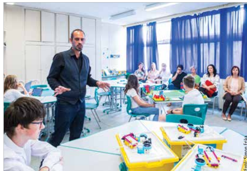
Egy különleges feladatot kellett megoldaniuk a gyerekeknek: meg kellett tervezniük egy város közlekedésének teljes automatizálását programozással, eszközök összeállításával és működtetésével

vári Tankerület összefogásával valósult meg ebben az iskolában is. A fejlesztés nemcsak az informatika területén tanít újat a gyerekeknek, hanem a csapatmunkára, a kreativitásra is rávezeti őket az itt használt módszertan. A bemutatón Cser-Palkovics András polgármester hangsúlyozta: a terem nem eszközökről, hanem új típusú módszerekről, valamint a tanárok és a diákok közötti újfajta együttműködésről szól.