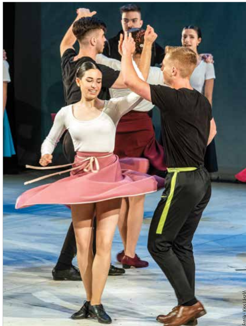
A gálaműsorban a jelenlegi tanulók mellett az elmúlt két évtizedben végzett táncosok is felléptek