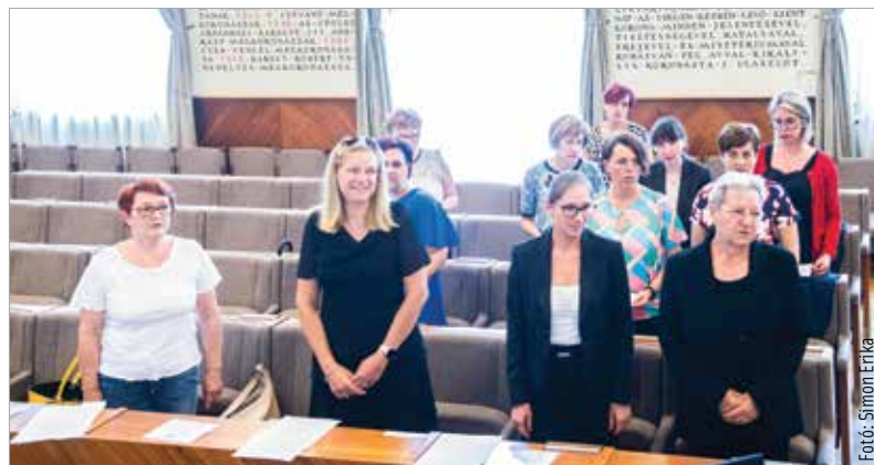
Az ülnökök közül ketten fiatalkorúak büntetőügyében, hatan munkaügyekben fognak eljárni, a járásbíróságon a fiatalkorúak büntetőügyében szintén hatan segítenek majd