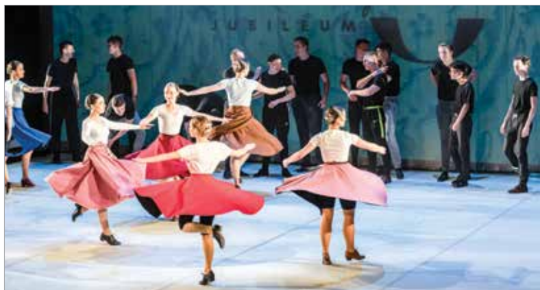
A gála méltó volt az elmúlt húsz évhez