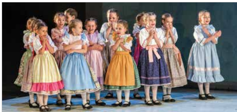
Városunkban máig erős megtartóerő, közös érték a néptánc

Huszadik születésnapját köszöntötte a Vörösmarty Színházban az Alba Regia Alapfokú Művészeti Iskola. A gálaműsorban az iskola jelenlegi tanulóival mellett az elmúlt két évtizedben végzett táncosok is lehetőséget kaptak, hogy megmutassák tudásukat a szépszájú közönségnek. Az intézmény megálmodója Botos József, a legendás táncpedagógus volt, aki azzal a szándékkal hívta életre a művészeti iskolát, hogy az Alba Regia Táncgyűttesnek legyen utánpótlása, és a néptáncot iskolarendszerben tanulhassák a tehetséges növendékek.