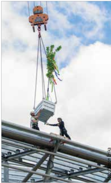
Bokrétaünnepség az Alba Arénában: elérte legmagasabb pontját a csarnok épülete

„Szükség volt a városban egy olyan modern csarnokra, ami nagy befogadóképességű, és különböző programokat meg tudunk tartani benne. Ez az Alba Aréna megépülésével megoldódik. Nagy jelentőséggel bír ez a létesítmény, hiszen csak akkor tudunk közösséget szervezni, ha vannak olyan helyek, ahol az emberek összejöhetnek, ahol jól érezhetik magukat. Rengeteg dologra alkalmas lesz az új aréna, többek között a jégkorongcsapatunk új otthona lesz” – fogalmazott Cser-Palkovics András. A polgármester kiemelte, hogy az épület a magyar jégkorong-válogatott egyik