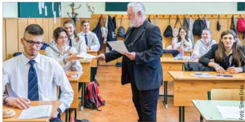
A magyarérettségi feladatlapjait kapják kézhez a ciszterci diákok

A feladatlapon az elmúlt időszak egyik központi témája, az árcsökkenés is előkerült, míg a második részben a diákok a Föld népességéhez köthető százalékszámítással foglalkoztak. Szerdán történelemből középszinten háromórás, emelt szinten négyórás számonkérés várt a fiatalokra. Középszinten az első részben a kereszténységre, a Szovjetunióra, az Európai Unióra, valamint Hunyadi Mátyásra és a Rákóczi-szabadságharcra vonatkozó kérdéseket kaptak a diákok. Az egyetemes esszétémák közül pedig Julius Caesar uralkodásáról vagy az auschwitzzi koncentrációs táborról írhattak az érettségizők. A magyar történelmi témák között pedig Széchenyi István gyakorlati tevékenységét vagy a magyar rendszerváltást választhatták.