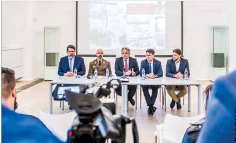
A kiállítás a tervek szerint december harmadikáig lesz látogatható Székesfehérváron, a Szent István Király Múzeum Rendházépületében