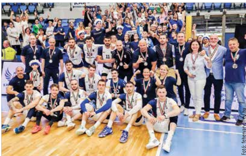
A döntőben kikapott, de így is ünnepelhet a fehérvári röplabdacsapat!