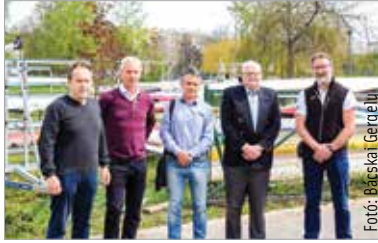
Elnökségi ülés a Kajakovárban

A szövetség az evezősök, kajakosok, kenusok, vitorlázók, SUP-osok és sárkányhajósok ernyőszervezete, elnöke pedig Soltész