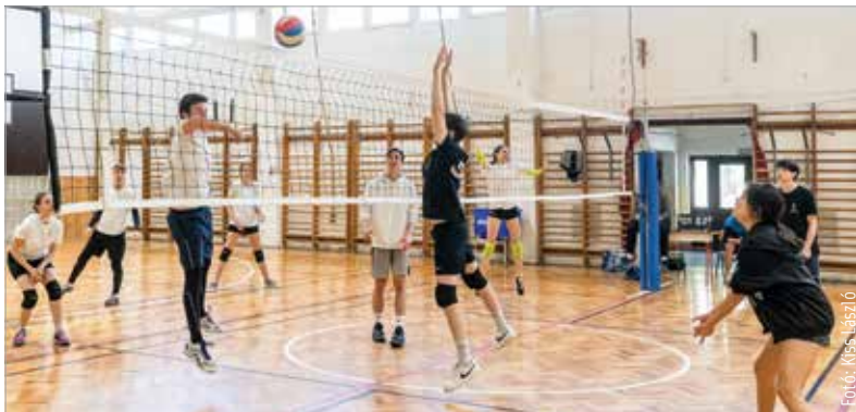
Egy napon keresztül megállás nélkül pattogott a labda a Jákó József Technikumban a Székesfehérvári Diáktanács által szervezett röplabdakupán. Az ötszapos torna résztvevői – bár jól érezték magukat – nem sokat tudtak pihenni a kihívás során. F. SZ.