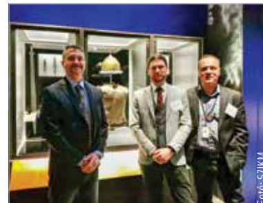
A kiállítás Chicago után a tervek szerint a Kanadai Történelmi Múzeumban lesz látható

Az Egyesült Államokban egyedülálló tárlaton látható többek között a világon legrégebbinek tartott aranytárgylelet, a várnai aranykincs Bulgáriából, amely több mint hatezer évvel ezelőtt keletkezett. Megtalálhatók a kiállított tárgyak között a kard- és pánccélkészítés bronzkori remekei, és látható a Szent István Király Múzeum különleges tárgya is, egy bronzkori páncél. A bronzpánccelt Pilismarót közelében találták a Duna vízében. Két bronzlemezből készült, a két részt pedig apró szegecskek fogták össze. Ez a legjobb állapotban fennmaradt bronzkori páncél a Duna-vidéken. Magyarországról hat múzeum