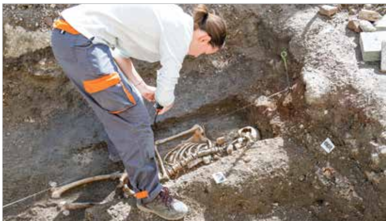
A középkori templom körüli temető további részleteit is sikerült feltárni

ban szereplő Alba Civitas bizonyítja az ispáni vár meglétét. Számos erődítésfalat és a védműhöz tartozó árokszakaszokat is találtak a kutatók során. Ezen belül helyezkedhetett el a négykaréjos alaprajzú templom, amit a kutatók többsége a Szent Péter-plébániatemplommal azonosít, és van arra vonatkozó adat, hogy Géza nagyfejedelem is itt temették el feleségével együtt.