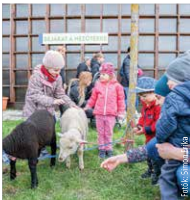
Nagy sikert arattak a bárányok

A húsvéti ünnepkör hagyományaihoz méltóan olyan játékokat is megismerhettek a gyerekek, amelyek gondolatosságukban kapcsolódtak a húsvét eszmerendszeréhez. A gyermekes szülők számára igazi kikapcsolódást nyújtott a kötetlen programkavalkád, amit mosolygós arcok erősítettek meg a napsütéses márciusban.