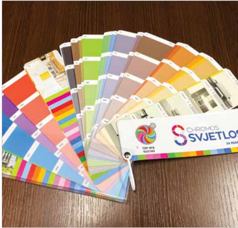
A falfestékek között a bíborvörös a legnépszerűbb

A vörösnek ez az árnyalata jól illik az otthonokra mostanában jellemző szürke összes árnyalatához, de a földszínekkel sem vész össze. Ezért aztán bátran használhatjuk kiegészítő árnyalatként! Megtehetjük díszpárnákkal, vázakkal, gyertyatartókkal, díszláttal vagy akár egy faliképpel, esetleg