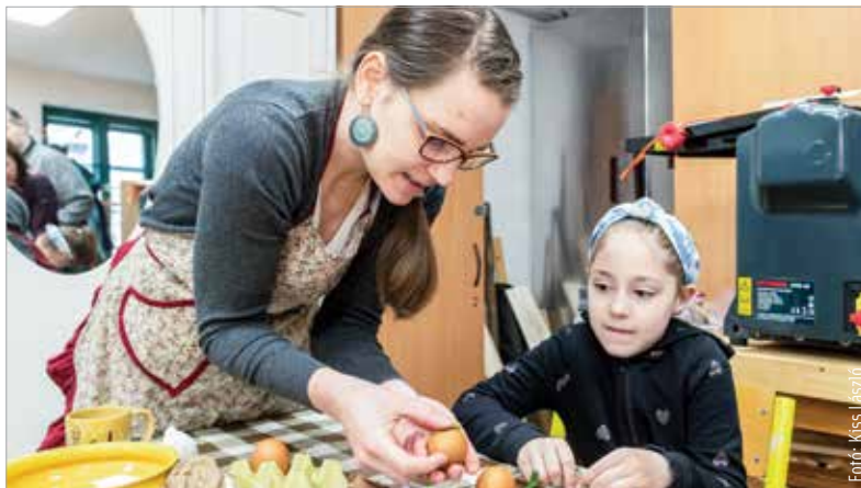
A legkülönbözőbb technikákkal készültek a hímes tojások