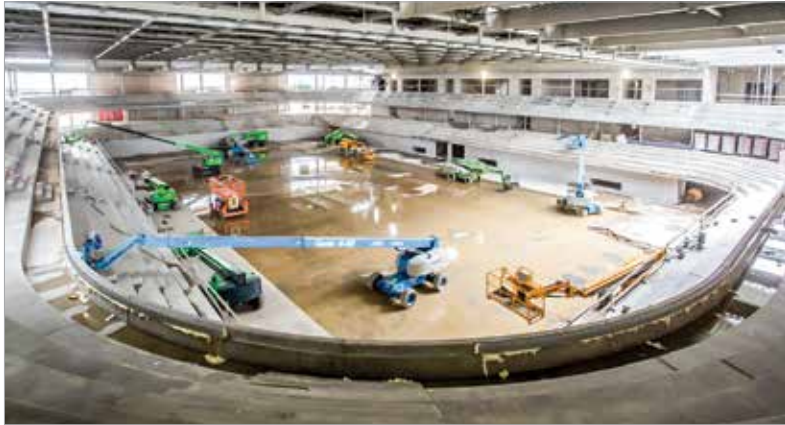
Már félkész állapotban is megmutatja igazi katlanjellegét az épülő Alba Aréna