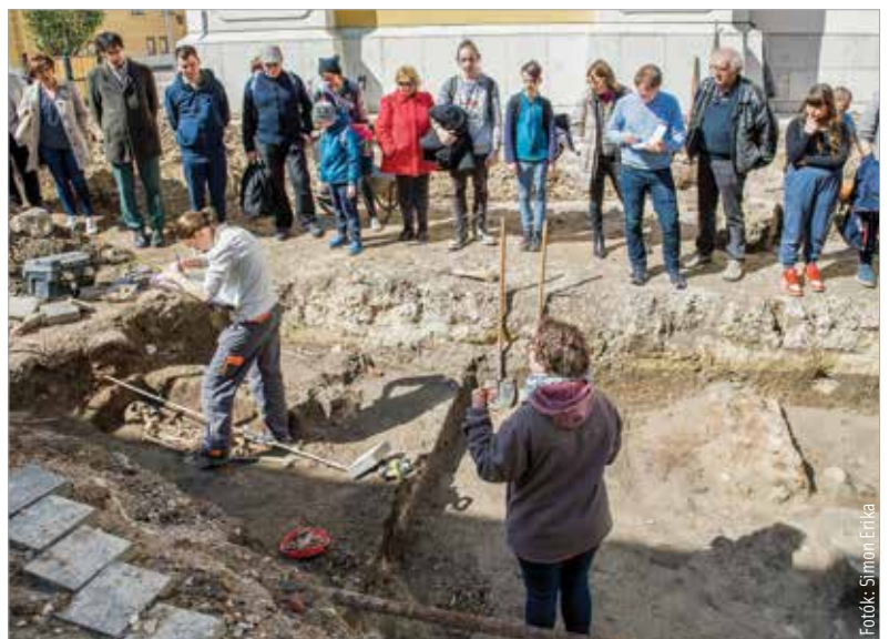
A Géza nagyfejedelem téri feltárási eredményeit ismerhették meg a fehérváriak

rüli temető további részleteit is sikerült feltárniuk a Szent István Király Múzeum szakembereinek. Főleg a török kor utáni sírok maradványait találták meg. Az előkerült leletanyag változatossága tanúskodik a történelmi belváros kiemelt szerepéről. Ezen a területen jött létre Fehérvár legkorábbi településrészlete. Ezt bizonyítják az előkerült Arpád-kori kerámialeletek is. A források-