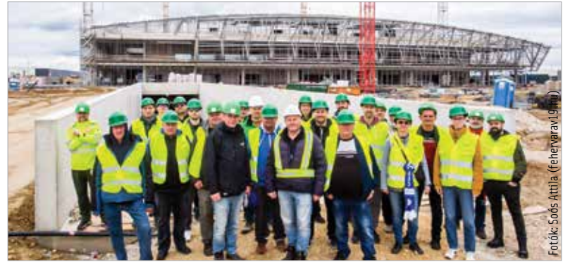
Nem építőmunkások, szurkolók! Nemsokára betöltheti a hangjuk a csarnokot.

hogy a csapat és a szurkolók is otthon érezzék magukat az Alba Arénában. Az új csarnok a tervek szerint decemberben készül el, a kivitelezés most nagyjából ötven százalékos