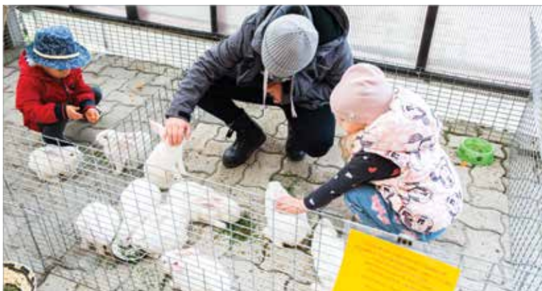
A nyuszikkal is sokan ismerkedtek