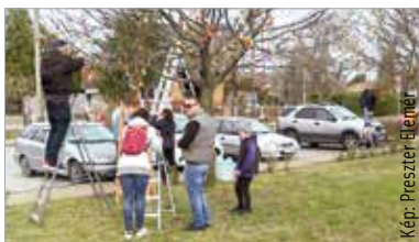
Sok család választotta a városrészszeépítő tojásfadíszítést