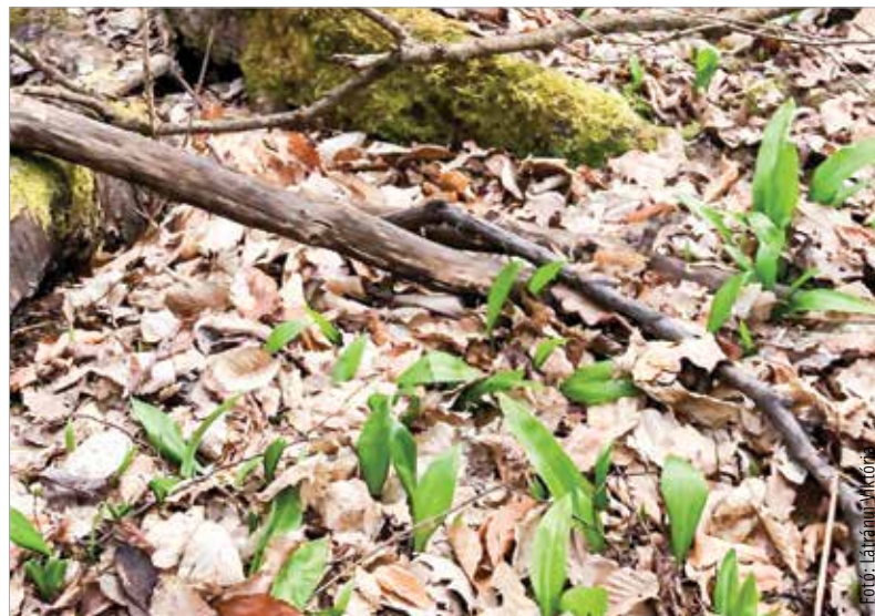
Medvehagyma a Bakony árnyas erdejében

illatuk, és fényes a felső felületük. Figyeljük meg a virágot is! A medvehagyma kis, fehér, csillag alakú virágai a szárcsúcson fejlődnek, és szintén fokhagymaillatúak. A gyöngyvirág virágai egymás felé nyílnak, harang alakúak, édes, bódító illatot árasztanak. Ha további bizonyosságokat is keresünk, akkor ássunk le a földre egy kicsit: a medvehagymának hagymája van, a gyöngyvirágnak szétfutó gyökérzete. Ha csak otthon eszmélünk rá arra, hogy nem a megfelelő növényt szedtük le, akkor dobjuk ki a zsákmányt, és alaposan mossunk kezet! Ha már ettünk belőle, akkor menjünk azonnal orvoshoz, mert a gyöngyvirág kis mennyiségben fogyasztva is olyan súlyos szívproblémát okozhat, amely halállal járhat!