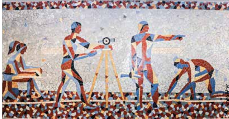
A Földmérők című, kilenc négyzetméteres mozaikot Koppány Attila tervezte és Horváth Imre készítette

1974-re datálódik az iskola aulájának díszje, a Földmérők című mozaik. A közel kilenc négyzetmé-