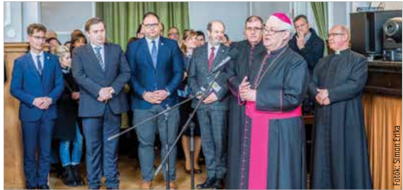
Székesfehérvár önkormányzata és a város közössége megbecsülését Cser-Palkovics András polgármester tolmácsolta a főpásztornak

a Magyar Katolikus Püspöki Konferencia, az egyházmegyei papság, a szerzetesrendek, a város, a vármegye és a különböző civilszervezetek megannyi képviselője. Udvardy György veszprémi érsek tekintett vissza Spányi Antal hittel végzett tevékenységére, majd Ugrits Tamás pasztorális helynök tolmácsolta Ferenc pápa áldását és köszöntőjét. A katolikus egyházfő méltatta Spányi Antalnak az Esztergom-Budapesti Főegyházmegyében, majd a Székesfehérvári Egyházmegyében mutatott tevékeny lelkipásztori buzgóságát, kitartását, a nehézségek között is