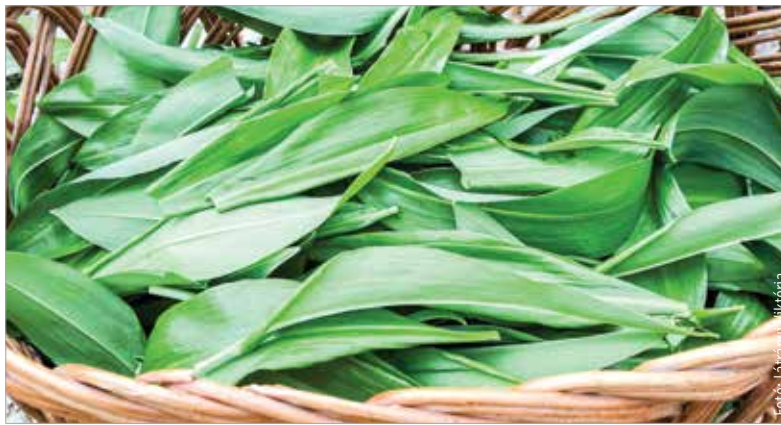
A medvehagyma leveléből naponta legfeljebb két kiló szedhető saját fogyasztásra!

Március közepétől minden évben beindul a medvehagyma szezonja. Az élénkzöld, fokhagymához hasonló ízű leveleket hazánkban elsősorban az erdők árnyékos részein, valamint források és patakok mentén lehet megtalálni, hozzávetőleg májusig. Az étvágyjavító, immunerősítő, székrekedést enyhítő növényt azonban egyáltalán nem mindegy, hogy hol szedjük! A Medvehagyma