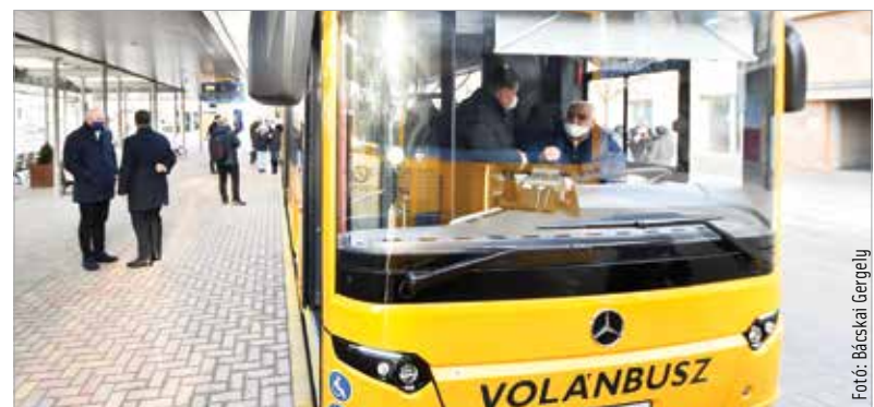
Mindig vegyük át a menetjegyet!

megegyező mértékű, tizenkétezer forintos pótdíjat fizetni. Az utólagos bemutatás költsége pedig kétezer-ötszáz forintra nő. A Volánbusz célja, hogy mindenki érvényes jeggyel vagy bérlettel utazzon. A múlt évben száznolcvanhat ezer járat ellenőrzése során mintegy tizenkétezer-ötszáz esetben összesen kilencvennyolcmillió forint pótdíjat szabtak ki az ellenőrök. A büntetésekre jellemzően azért kerül sor, mert az utas fizetés után nem veszi át a menetjegyet, nem tudja igazolni az igénybe vett kedvezményre való jogosultságát, lejárt a kedvezménye vagy érvénytelen igazolvánnyal veszi igénybe azt, esetleg kiemelten kedvezményes bérletét nem a megfelelő viszonylatban használja.