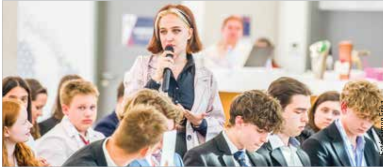
Komoly tartalmi munka zajlott Székesfehérváron

„Érdemi konzultáció, párbeszéd és vita alakult ki, komoly munka zajlott az elmúlt napokban Székesfehérváron. Nagy büszkeség számunkra, hogy házigazdaként negyedik alkalommal