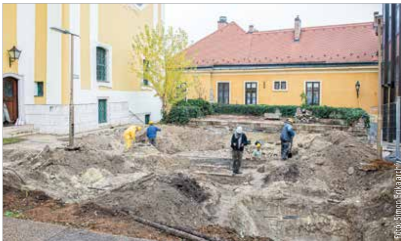
Az ásatai munkák kezdete novemberben

Mint az intézmény közösségi oldalán olvasható, az ásatai eredményeivel a nagyközönség testközelből is megismerkedhet: március 31-én, pénteken 13.30-tól és 14 órától nyílt napot tart a Szent István Király Múzeum az ásatai helyszínén. A programon való részvétel előzetes regisztrációhoz kötött, jelentkezni a bejelentkezés@szikm.hu e-mail-címen lehet március 30-án, csütörtökön 15 óráig.