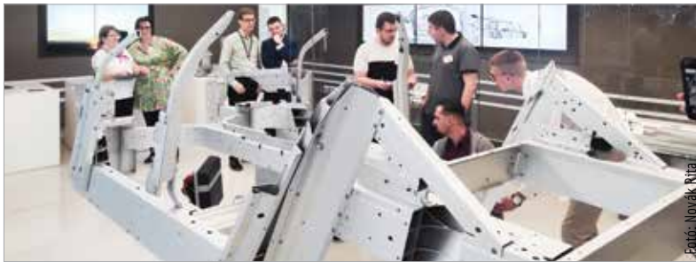
A James Bond filmekből is ismert Aston Martin alváza köré gyűltek az egyetemisták