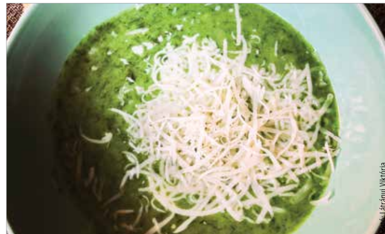
Gyorsan elkészíthető, finom és egészséges!

coljuk meg a burgonyát, és vágjuk apró darabokra. Egy nagyobb méretű lábosban hevítsünk fel egy kanál olajat, majd tegyük bele a medvehagymát, aztán a felaprított krumplit, és gyakran kevergetve pároljuk meg. Ezt követően öntsük fel vízzel, tegyük bele a fűszereket és morzsoljuk bele a leveskockát. Forraljuk körülbelül tizenöt-husz percig. Amikor a krumpli megpuhul, vegyük le az edényt a tűzhelyről, és a tartalmát pépesítsük botmixerrel. Vegyünk ki belőle néhány evőkanállal, keverjük össze a főzőtejszínnel, és folyamatos kevergetés mellett öntsük vissza a levesbe. Tegyük még egy kis időre a tűzhelyre a krémlevesünket, és főzzük együtt a tejszínnel forrásig. Tálalhatjuk reszelt füstölt sajttal, pirított kenyérszelettel vagy pirítottal is!