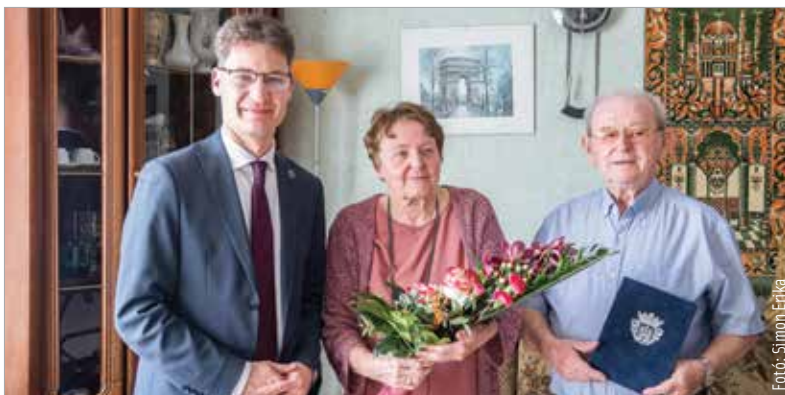
A gyémántlakodalom az el nem múló szeretet jelképe

A házaspár három gyermeknek adott életet. Őt unoka gyarapította a családot az évek során, mostanra pedig már dédunokát is ringathatnak. A gépészmérnök férj a Videoton szerszámüzemében kezdte pályafutását, és vezetőként onnan is ment nyugdíjba, míg felesége a vállalat könyvelőjeként dolgozott közel harminc éven át. S hogy mi a hosszú, boldog házasság titka? A szeretet, az egymás iránti tisztelet, az erős családi és baráti kapcsolatok és a közös célok, amelyeket csak együtt érdemes elérni – vallja a gyémántlakodalmat ünneplő házaspár.