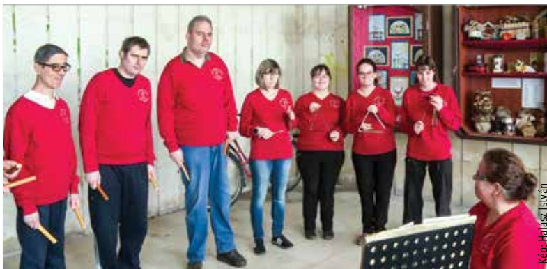
A Szent Kristóf Ház gondozottjainak alkotásaiból nyílt tárlat a Fő utcán. Az alkotások a Márvány udvar bejáratánál lévő kültéri vitrinekben tekinthetők meg.