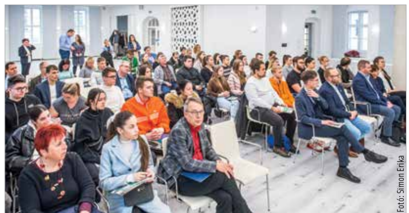
A hallgatók a tematikus héten megismerhették a civilszervezetek működését

Magyarországon közel hatvanezer civilszervezet működik, szerepük pedig egyre nagyobb. Erről Szalay-Bobrovniczky Vince civil- és társadalmi kapcsolatokért felelős helyettes államtitkár számolt be a hallgatóságnak: „A fiatalok számára bekapcsolódási lehetőséget szeretnénk kínálni a civilszervezeti életbe. Erről szólna az a szeminárium, amit tervezzük a Kodolányin, hogy a fiatalok számára minél vonzóbbá tegyük a civiléletet.”