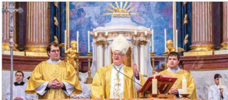
Az áldás negyedszázada mindannyiunké

megőrzött kiválóságát, a papok és a hívők iránt tanúsított gondoskodását, valamint a Magyar Katolikus Püspöki Konferenciáért végzett munkáját.