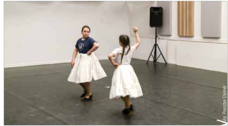
A legfiatalabbak is bemutatkozhattak a találkozón