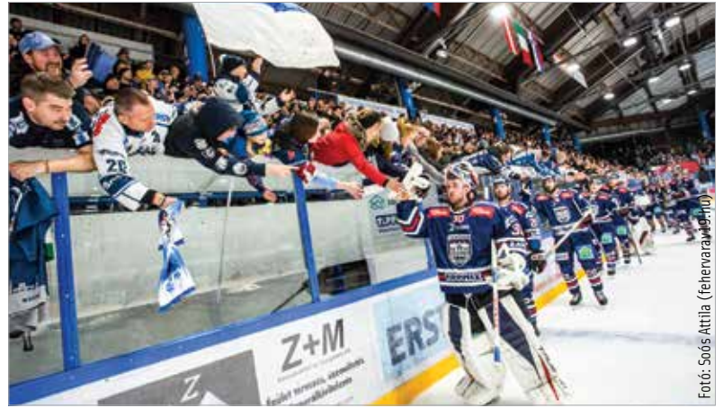
Ebben a szezonban is járt a köszönet a szurkolóknak a csapat tagjaitól!