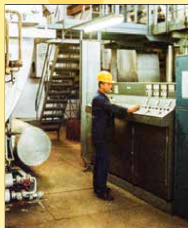
A kazán telepítése 1994-ben

Az 1970-es évektől ugrásszerűen emelkedő távfűtési igény ismét fókuszba állította a bővítés kérdését. A város központjához közeli fűtőerőmű elsősorban a lakótelepi fűtési igényeket tudta kielégíteni, a város peremén elhelyezkedő ipari szereplők hőellátása a távolság miatt nem tudott megvalósulni. 1980 táján már közel tízezer otthon fűtését és melegvíz-ellátását kellett biztosítani városszerűen. A lakásszám folyamatos növekedésével lépést tartó városi hőigények szükségessé tették a fűtőerőmű további fejlesztését. Új vízlágyító berendezés és a nyolcvanas évek első felében négy, egyenként 40 MW hőteljesítményű, pakuratüzelésű, PTVM-típusú forróvízkazán létesült a Király soron. Az 1990-es évek elejére megtörtént a hőtermelési rendszer számítógépes automatizálása. 1994-ben az egyik elbontásra került, leselejtezett forróvízkazán helyére két horvát gyártmányú, 20 MW teljesítményű forróvízkazánt telepítettek.