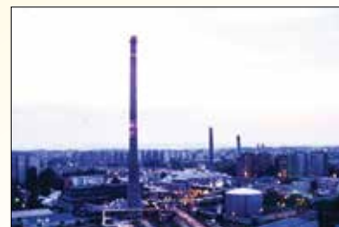
Az erőmű esti látképe

Megkezdődött a tervezés, a kivitelezés, aminek eredményeképpen megújult a szedreskerti kazánház 3x5 MW hőteljesítménnyel, a Bakony utcában három 20 MW-os kazán létesült, míg a tóvárosi fűtőerőműben egy gázmotor felújítása és egy meglévő kazán üzembe helyezése valósult meg. A korszerű berendezésekkel lényegesen magasabb hatásfokkal állítható elő a szükséges hőmennyiség, ami a gázfelhasználás és a szén-dioxid-kibocsátás csökkenésében mutatkozik meg. A fejlesztésekkel a székesfehérvári távhőellátás oly mértékben stabilizálódott, hogy a százhusz éves Király sori erőmű még működőképes hőtermelőire legfeljebb tartós, nagy hidegek vagy komolyabb üzemzavar esetén lehet szükség. A több hőtermelő-telephely tovább növeli az üzembiztonságot, lehetővé teszi a távhőrendszer jobb kihasználását, a veszteségek minimalizálását.