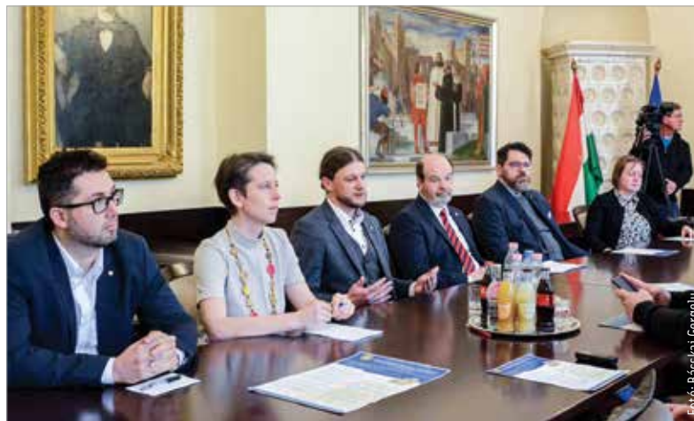
Kétéves programsorozattal és kiállítással ünnepli fennállásának százötvenedik évfordulóját a múzeum