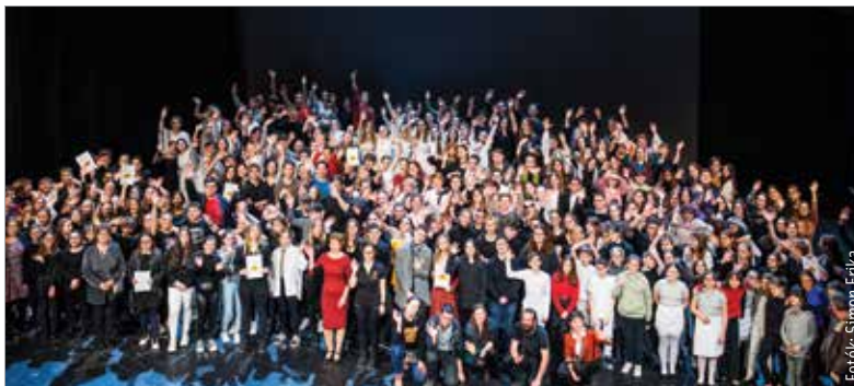
A bejelentés pillanata

Ötletes megoldásokat láthatott a közönség az egyes Arany-balladák feldolgozására hétfő este: az Aranyszínház című produkcióból kiderült, hányféleképpen jelenhet meg a halál, az elmúlás, a szerelem, az örület, a szabadság és a hűség a színpadon. Az Atlantisz program első előadását 2015-ben láthatta a fehérvári közönség a Vörösmarty Színházban. E művészeti nevelési program célja, hogy közelebb hozza a színházat a gyerekekhez. Az elmúlt években így játszhatta el több száz diák a Lúdas Matyit, Arany János Toldi című elbeszélő költeményét, valamint az Odüsszeiát is. Most Arany János balladáin volt a sor.