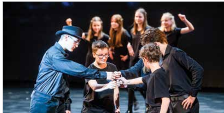
„Nem azé a madár, aki elszalajtja”

része szállít fegyvereket Ukrajnának. Magyarország azonban kitart álláspontja mellett, vagyis nem szállítunk, és nem is engedünk át fegyverszállítmányt hazánkon.