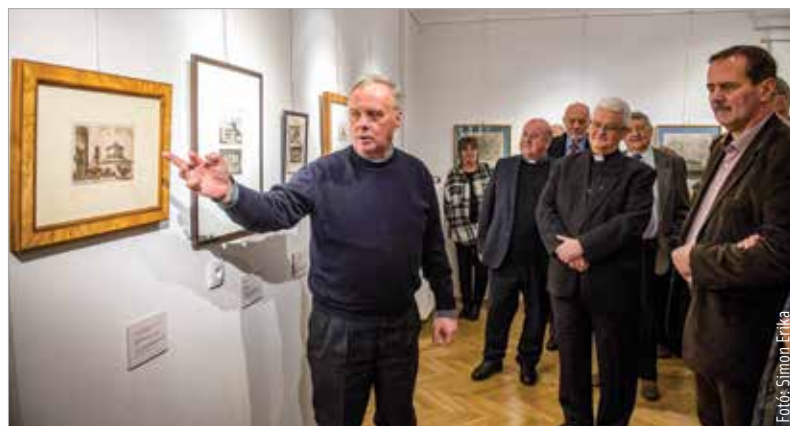
A tárlat május tizenharmadikáig tekinthető meg a Szent Korona Galériában