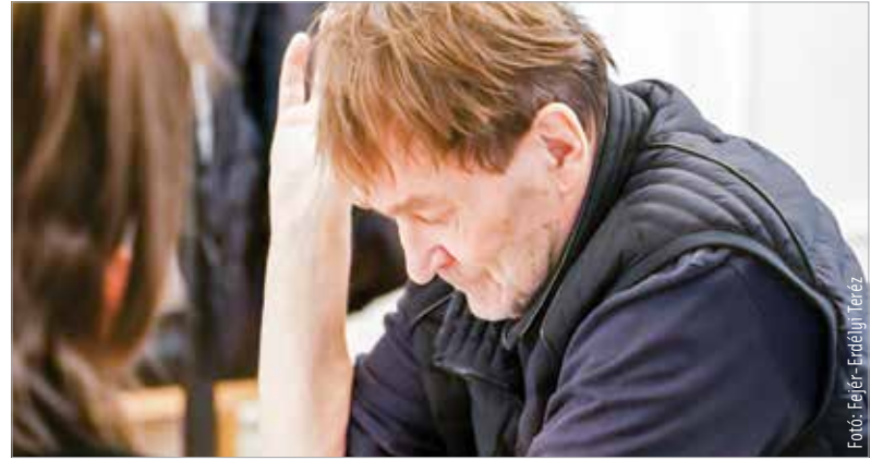
Ezzel a rendezéssel tér vissza Székesfehérvárra Cserhalmi György

játéka, és máris többről van szó, mint egy gyilkossági ügyről. A mára már klasszikussá vált mű lefegyverzően beszél félelmekről, előítéletekről, gyengeségekről. A Vörösmarty Színház is műsorára tűzte évekkel ezelőtt a darabot, most pedig egy rendkívüli felújításban lesz ismét látható. A színház épülete átmenetileg zárva van, de a Városháza Dísztermében színházi élményhez juthatnak a nézők! Már a díszletek is állnak, a próbák is megkezdődtek. A februári előadásokra villámgyorsan elkapkodták a jegyeket, de a színház honlapján van regisztrációs lehetőség a későbbiekre.