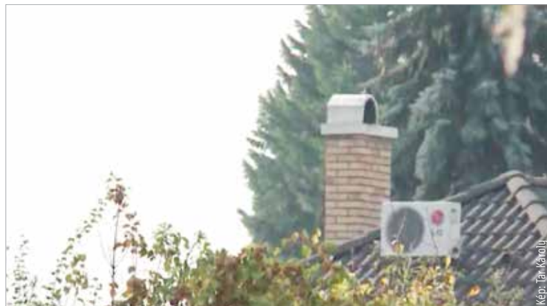
Családi házaknál egyeztetett időpontban ellenőrzik a kéményeket

Az egy lakásos lakóingatlanokban, vagyis a családi házakban nem kötelező a rendszeres kéményseprés, azonban gázfűtésnél két évente, szilárd tüzelésnél évente, megrendelés alapján, térítésmentesen történik a munka egy előre egyeztetett időpontban. A társasházakban sormunka alapján dolgoznak a szakemberek – itt kötelezően el kell végeztetni a kémények ellenőrzését, tisztítását. Ennek 2023-as ütemterve már elérhető a városi honlapon is. A vonatkozó törvény szerint kéménytűz, illetve szén-monoxid-szivárgás esetén a tulajdonosnak azonnal szüneteltetnie kell a tüzelőberendezés és az égéstermék-elvezető üzemeltetését.