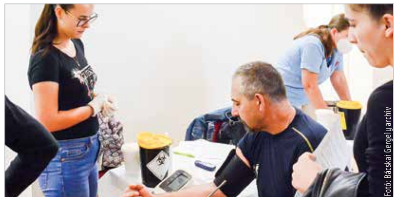
Vérnyomásmérésre és specifikus vizsgálatokra egyaránt lehetőség lesz a szűrőnapokon