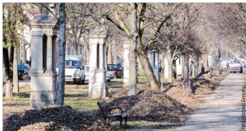
A kálváriát övező fák többsége jó állapotban van

meg. Az elsődleges azonban minden esetben a faápolási szempontok figyelembe vétele és minél több egyed megmentése. A kálváriatorony szerencsére az idősebb fák is jó állapotban vannak, azonban található itt tíz, hatvan-hetven év körüli nyugati ostorfa, közel egyméteres átmérővel. Közülük három nagyon rossz állapotban van és veszélyes. Ezeket nem lehet megmenteni, ki kell vágni, nehogy nagy bajt okozzanak. A Városgondnokság az idős egyedek pótlásáról is gondoskodni fog, olyan helyen, ahol azt a közművek megengedik.