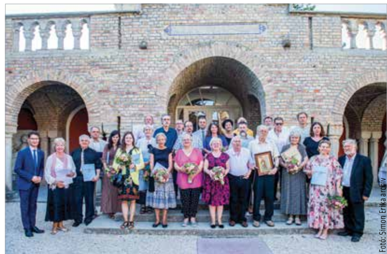
A Lánzos–Szekfű-ösztöndíj díjazottjai a tavalyi ünnepélyes átadón

teremtettek, illetve tartalmaznak. A pályázatokat április harmadikáig lehet benyújtani. Az ösztöndíjak odaítéléséről, összegéről az alapítvány kuratóriuma dönt. Kedvező elbírálás esetén az ösztöndíj átadását követően utalják át a megítélt összeg ötven százalékát, míg a másik felét a pályamunka elfogadását követően fizetik ki. A támogatás adómentes. A díjat hagyományosan az augusztus huszadikai ünnepségekhez kapcsolódó nyilvános kuratóriumi ülésen adják át. Ez eseményt az utóbbi években a Bory-várban rendezték.