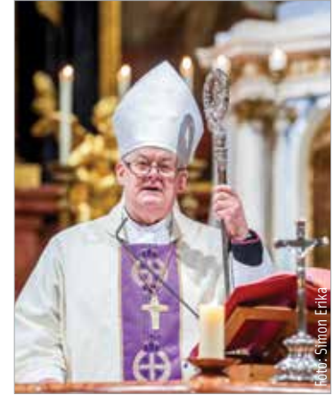
Spányi Antal celebrálta a szentmisét

A megemlékezésen a megyés püspök szívhez szóló gondolatokkal idézte meg a tragikus történeteket. Spányi Antal úgy fogalmazott: katonáink példaképek voltak, mert nemcsak hazájukért, hanem egymásért is harcoltak, és hősiességükkel egy olyan üzenetet fogalmaztak meg a jövőnek, melynek alapja a hazaszeretet és a tisztelet.