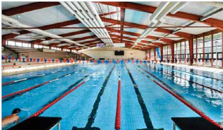
Nyitva marad az uszoda a fűtési szezon végéig, a költségek jelentős részét átvállalja a kormány

zott Vargha Tamás. Székesfehérvár polgármestere a tavalyi év végén jelezte, hogy jó esély van a megállapodásra. Az uszoda főépületének nyitva tartását akkor február tizedikéig meghosszabbította. Most azonban már biztos, hogy a fűtési szezon végéig nem kell a bezárás gondolatával foglalkozni: „A támogatás második, első negyedévre szóló része hamarosan megerkezik, hiszen hatékony és konstruktív tárgyalásokat tudunk folytatni Schmidt Ádám sportért felelős államtitkárral. Az uszodát így biztosan nyitva tudjuk tartani a további téli hónapokban is. A mostani 127 millió forint az uszoda rezsiköltségének jelentős részét fedezi. A maradékot az önkormányzat állja.” – fogalmazott Cser-Palkovics András.