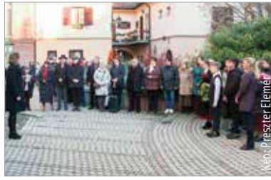
A magyarországi svábság máig egy olyan összetartó közösség, mely túlél minden nehézséget

Január tizenkilencedikét az Országgyűlés 2012-ben a magyarországi németek elhurcolásának és elűzetésének emléknapjává nyilvánította arra emlékezve, hogy 1946-ban ezen a napon hagyta el Magyarországot az elűldözött német lakosokat szállító első vonatszerelvény. A második világháború lezárását követően, a kollektív bűnösség elve alapján Magyarország területéről 1948-ig mintegy 220-250 ezer embert hurcoltak el Németországba. Székesfehérváron 2015 óta minden évben megemlékeznek a sorstragédiáról. Szerdán a Kossuth utcai emléktáblánál hajtottak fejet a megemlékezők az elhurcoltak előtt. „Nagyon sokan erről nem tanultunk az iskolában. Egészen az 1990-es évekig nem