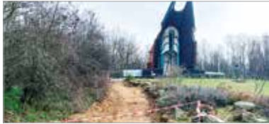
Jelenleg a kápolna környezetének felújítási munkálatai zajlanak

Az ország hétszáz különböző helyszínén hatezer védett sírt tart számon a Nemzeti Örökség Intézete. Ezek egy részét úgynevezett okosparcellakövekkel látják el: „A parcellakövek lényege, hogy a tetején lévő QR-kód beolvasásával bármelyik érdeklődő eljuthat egy olyan internetes felületre, ahol minden információt megtudhat arról, miért van az adott helyszín parcellakövel ellátva, kiknek