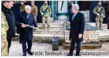
Harrach Péter, az Országgyűlés korábbi alelnöke és Vargha Tamás államtitkár avatta fel az okosparcellakövet

a személye kapcsolódik hozzá, milyen történelmi eseményhez kötődik az a sír. Az igazi, hosszú távú cél pedig az, hogy a nemzeti emlékezet részévé váljanak mindezek a helyszínek. Kötődjenek elsősorban a jövő generációjához, családok, szülők, nagyszülők hozzák el ide gyermekeiket” – ismertette az okosparcellakövel kapcsolatos tudnivalókat Móczár Gábor, az intézet főigazgatója.