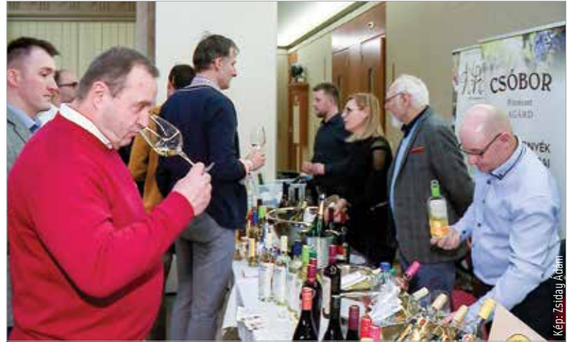
„Minden bor társ, de igazi lényét akkor tárja fel, ha közösségben isszák!” (Hamvas Béla)