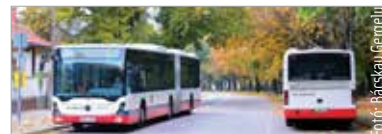
Egyelőre nem változik a járatsűrűség