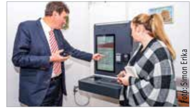
A mesterséges intelligencián alapuló berendezés bárki számára szabadon hozzáférhető és használható

A mesterséges intelligencia térhódításának folyamata tehát ezentúl