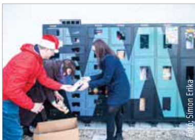
Az első csomagok az Alba Bástya Család- és Gyermekjóléti Központ udvarán található automatában landoltak szerda délelőtt

„Három automatát ajánlott fel az IVM Zrt. térítésmentesen, ebből egy az Irányi Dániel utcában található, kettő pedig a város jól megközelíthető helyein: az egyik az uszoda mellett, a másik az Ady Endre utcában. Amikor bekerülnek az adományok, mi értesítést kapunk róla, így amikor szükséges, a kollégáim kiürítik az automatákat, az adományokat elhozzák az Irányi Dániel utcába, csomagokba rendezik őket és eljuttatják azokat a rászorulóknak, akik vagy velünk vagy az