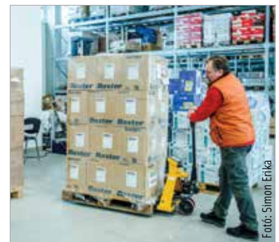
Az adventi adománygyűjtést a Civilközpont Országos Hálózata és a Miniszterelnökség szervezte. Fehérváron a megyei Civil Közösségi Szolgáltatóközpont koordinálta a gyűjtést, a Katolikus Karitás pedig a csomagok szállítását.

Az adományok szállítását a katolikus szeretetszolgálat koordinálja a következő hetekben. Két településre azonban már a második