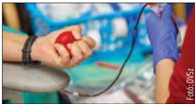
A területi vérellátó a Seregélyesi út 3. szám alatt található

Ismét várják a segíteni szándékozókat Székesfehérváron: az ünnepek előtt is nagy szükség van vérre, ezért a területi vérellátóban december 20-ig 9 és 15 óra között adhatunk vért. A véradáson 18 és 65 év közötti egészséges emberek vehetnek részt. Fontos, hogy személyi igazolványt, laccím- és tajkártyát mindenki vigyen magával! Közben zajlik az Országos Vérellátó Szolgálat 1-3-9 #véradochallenge nevű kampánya, melynek célja új véradok toborzása. Egy vérado megmenthet három életet, majd kihívja két barátját, így együtt már kilenc ember életét menthetik meg.