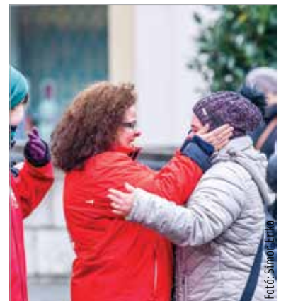
A szeretetet mindenki megérdemli!