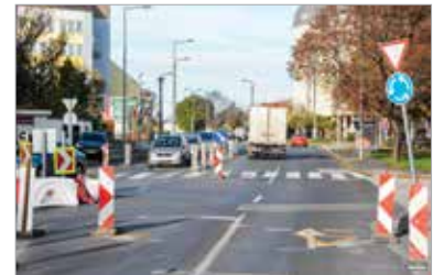
A Móri úton is kerékpársávok lesznek az út mindkét oldalán