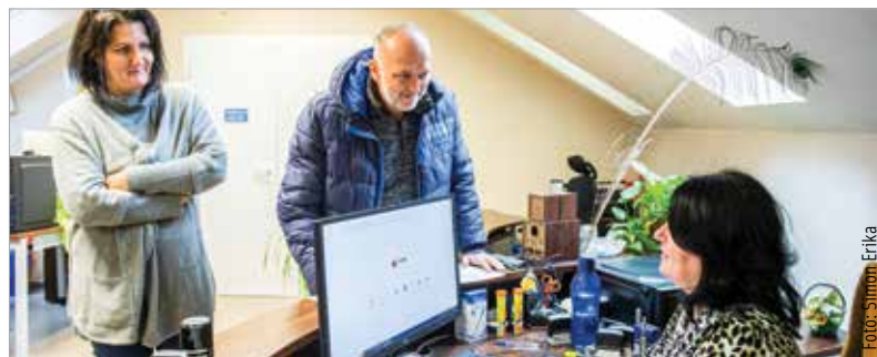
Nagy segítség az új gépek beszerzése

A Kríziskezelő Központ a Sörház tér 3. szám alatti központban folyamatosan várja az adományokat: a karácsonyi csomagostáshoz lenne szükség étel- és ruhanevelésre, elsősorban férfiak számára.