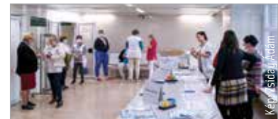
Volt diákok, akinek felkeltette érdeklődését az egészségügy

A nap folyamán a gyerekek a kórház több részlegén jártak: megismerkedhettek a radiológiai, a hemodinamikai és a patológiai