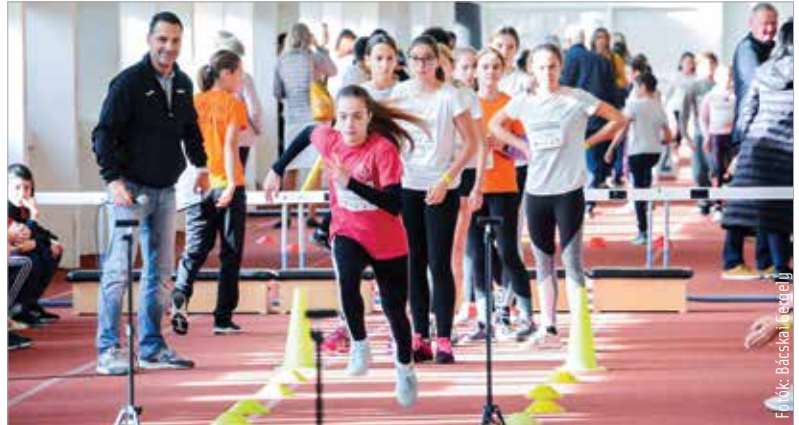
Futók futószalagon: egymást követték a gyerekek a Breggyóban

belül felmérjék Székesfehérvár 8 és 12 év közötti tanulóit. Mintegy 3000 diák 12 690 mérését követően két versenyszámban is kialakultak az évfolyamok városi toplistái. E ranglista legjobb tizenkét eredményét elért fiataljai a Regionális Atlétikai Központ fedett pályáján, egy gála keretében döntötték el, ki a leggyorsabb és ki a legruganyosabb Székesfehérváron. Az esemény sztárvendégei voltak Zsivoczky Attila világ- és Európa-bajnoki érmes, országos csúcstartó tízpróbázó, a Kölyökből Atléta Prog-