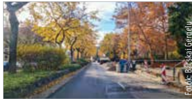
Elkezdődött a Rákóczi utca felújítása, új kerékpársáv is lesz

Épül a Rákóczi utcai új kerékpársáv is, ezzel együtt az útburkolat is megújul az Aron Nagy Lajos tér és a Gáz utca közötti szakaszon. A déli útpályán – ahol szélesebb az aszfalt – külön kerékpársáv épül a megmaradó párhuzamos parkolók mellett. A felfestés úgy készül majd, hogy biztonságos távolság maradjon a 1,25 méter széles kerékpársáv és a parkoló autók között is. A belváros felé vezető északi oldalon csak minimálisan lehet szélesíteni az utat, itt kerékpáros nyomok lesznek kijelölve. A szegélyeket is javítják, illetve ezen az oldalon is felújítják az útburkolatot. A Széna téri körforgalom átépítésének a tervei is készen vannak, de a teljes felújítás most nem fért bele a keretbe.