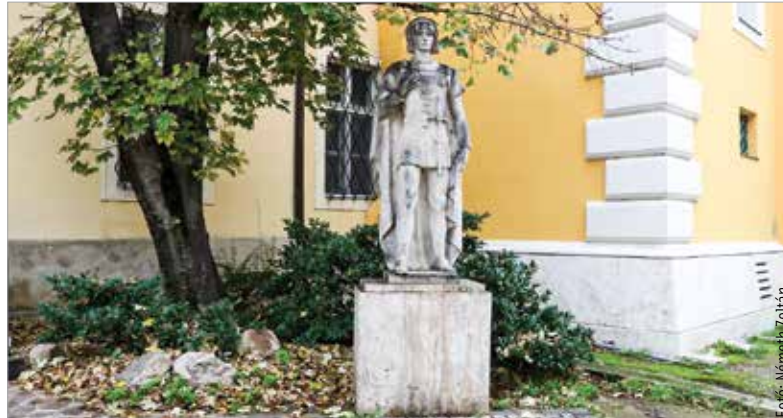
Kalandos életutat tudhat maga mögött Szent Imre székesfehérvári szobra

Szent Imre szobrát 1935-ben, egészen pontosan az év szeptemberének huszonhetedik napján állították fel Székesfehérváron. A hivatalos avatására azonban elég sokat, majd három esztendő kellett várni, 1938. május 19-ig. Az időzítés nem volt véletlen, ahogy a szobor műlapja is megjegyzi a Közterképen: 1938-ban sok műalkotást adtak át Székesfehérváron a Szent István halálának kilencszázadik évfordulója alkalmából rendezett ünnepi év rendezvényei során. Eredetileg a mai Géza fejedelem térre került Lux Elek szobrász-