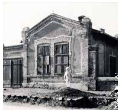
Az egykori Mázsaház 1936-ban

szert az Agg Úrinők Otthonát. Schmidl nemcsak az épületet, de belső berendezését is megtervezte. Az alapkövetéssel 1938. május 22-én, a Szent István-ünnepségek keretében