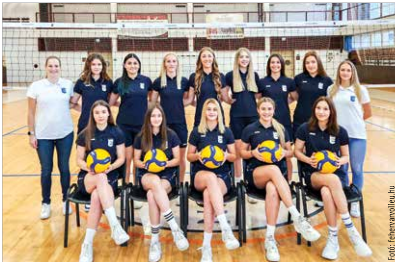
Kemény feladat vár a bajnoki rajton a fehérvári röplabdás lányokra