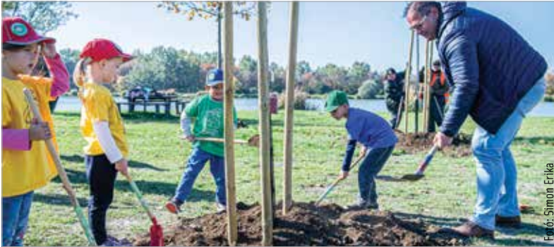
Az óvodások is kivették a részüket a munkából

Börgyár utcában. Mészáros Attila alpolgármester elmondta, hogy az önkormányzat saját és külső forrásból évente több ezer fát ültet. Ahogy fogalmazott, a nagyobb erdőtelepítések a város külső részeit érintik, de ugyanolyan fontos, hogy a lakóköznyezetekben is minél több fát ültessenek. Kiemelte, hogy a fák gondozását a Városgondnokság, valamint a Vadex Mezőföldi Zrt. szakemberei fogják ellátni, a tavasz folyamán pedig – a megfelelő vízellátás érdekében – kikerülnek az öntözőzások is. A programban érintett településeken óvodásoknak és iskolásoknak szóló edukációs programokat is szerveznek, támogatva a fiatalok további ismeretszerzését a fenntarthatóság és a környezettudatosság területén.