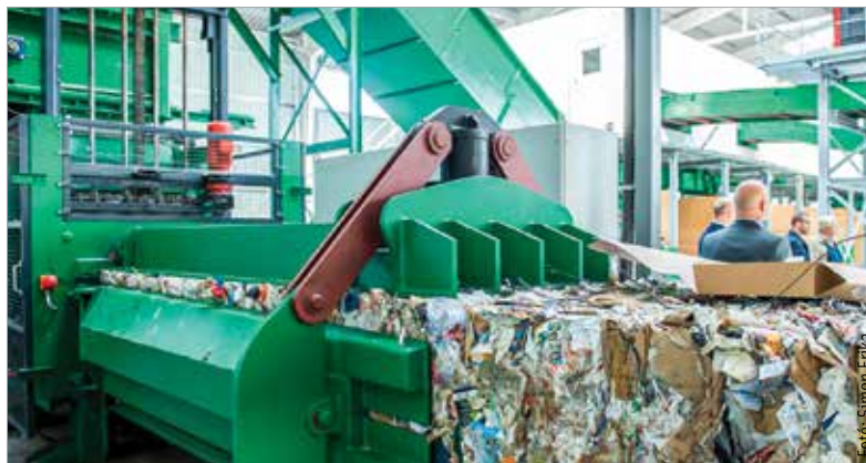
A cél, hogy minél több hulladék hasznosulhasson