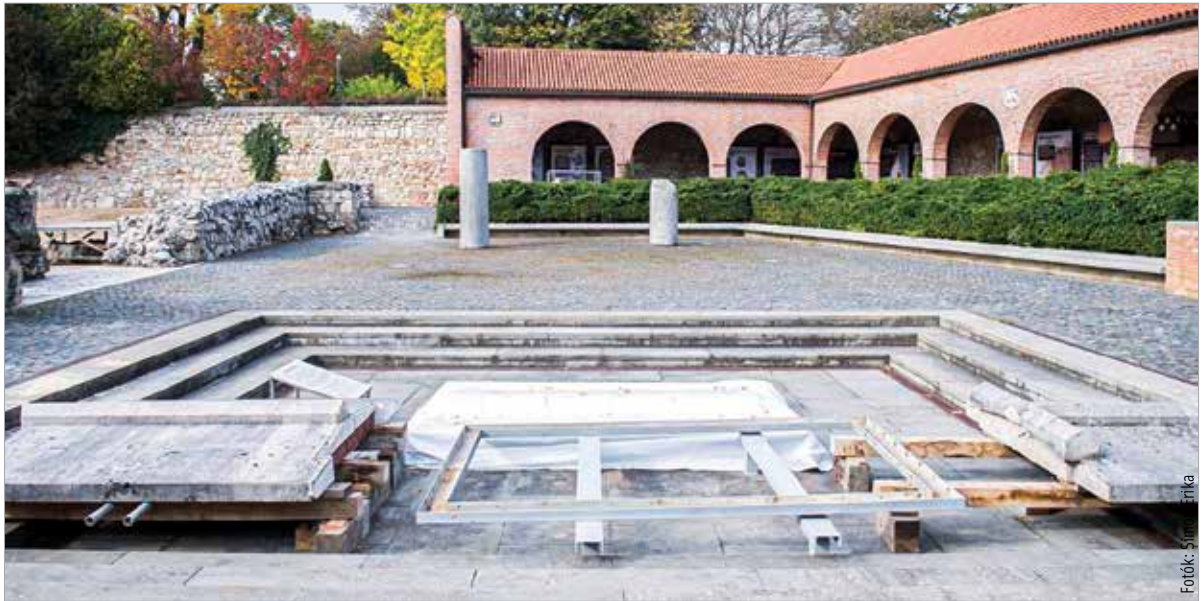
Korszerűsítik az osszárium fedlapját a Nemzeti Emlékhelyen

„Eddig az osszárium fedlapjának mozgatásához – annak súlya és szerkezete miatt – külső segítséget kellett bevonni. Ennek költsége jelentős terhet jelentett, így most olyan megoldást