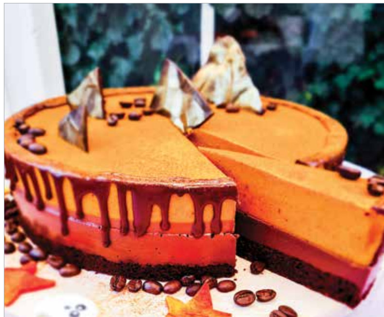
Vegán kávé-fahéjas-sütőtökös csokitorta

A krém hozzávalóit összeturmixoljuk, majd szétterítjük a pitén. Ha marad tészta, akkor lehet belőle díszítés a tetejére. Amikor minden kész vagyunk, a pitét betesszük a 170 fokra előmelegített sütőbe, majd alsó-felső sütéssel körülbelül harminc percig sütjük.