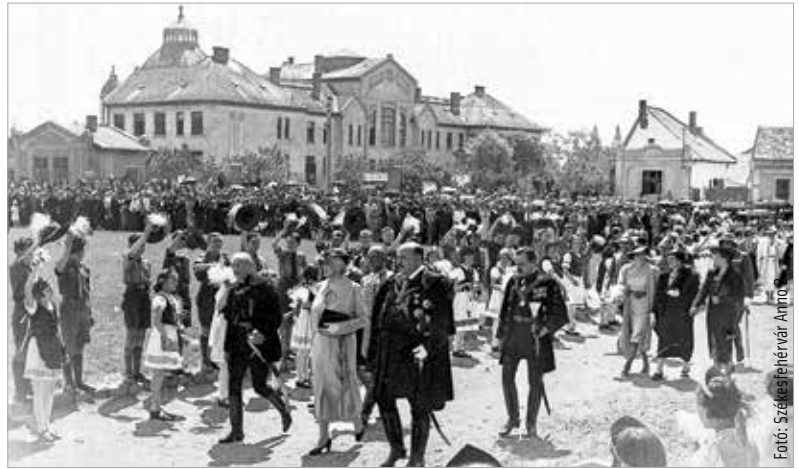
Horthy Miklósné és Hóman Bálint az Úrinők Otthona alapkövetelésén

vezését. 1876-ban kápolnát kezdtek el építeni, melynek helyén 1911-re épült fel a Jézus Szíve templom. A több más épülettel kiegészült együttes olyannyira elaggott, hogy 1912-ben a város vezetése a bontásról döntött. 1913-ban az új épületek tervezésével Bory Jenőt és Fábrián Gáspárt bízták meg. Az eredeti tervektől eltérően az árvaház a templom mögé, míg az aggintézet L-alakban mellé került. Az együtteshez később hozzáépült a lelkeszlak (1917) és a gyógyíthatatlan betegek Molnár Tibor által tervezett pavilonja (1941). A sarokház Széna téri folytatásaként a Vásártér egykori Mázsaházának helyén építették fel 1938-39-ben Schmidl Ferenc tervei