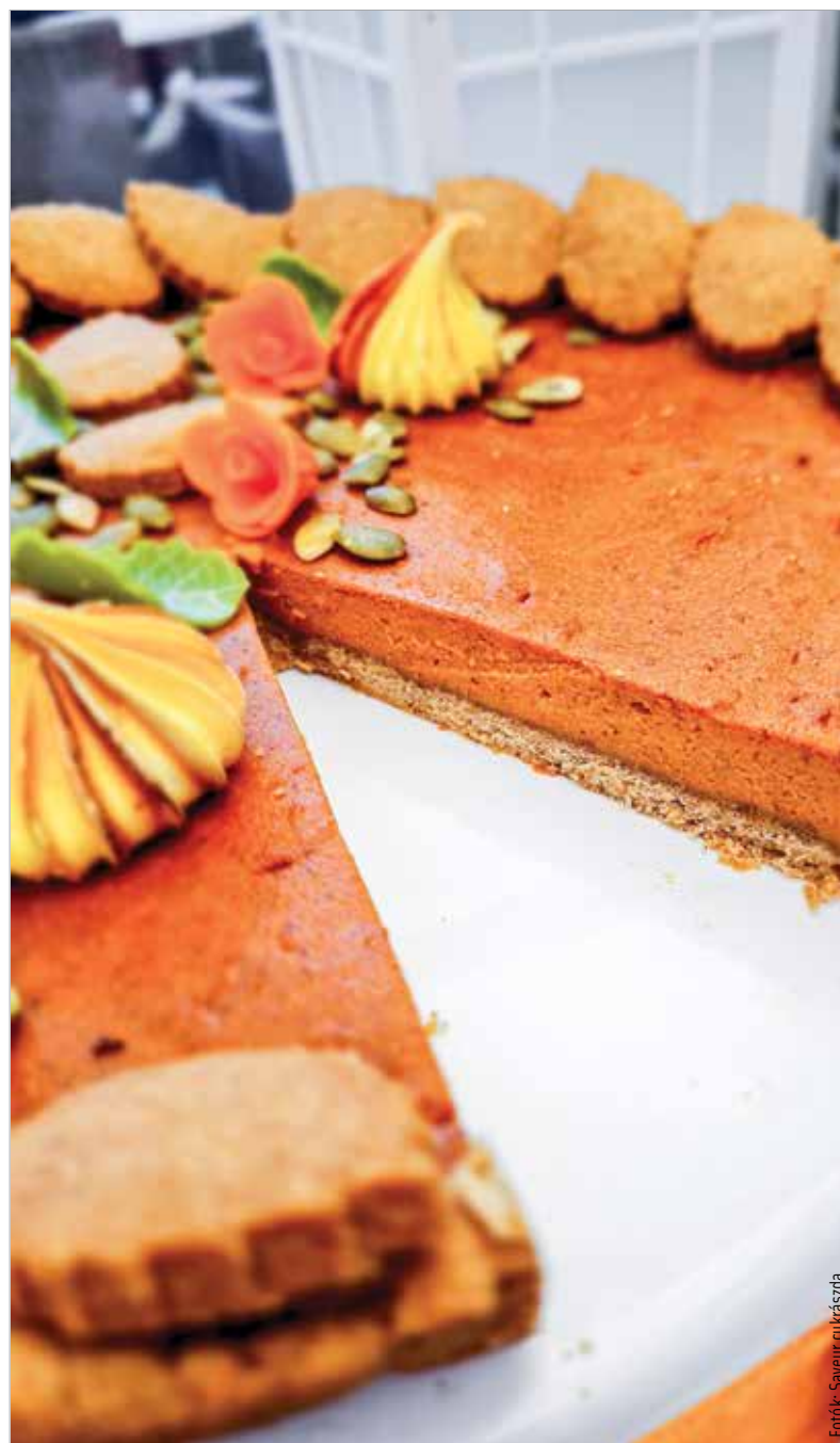
Cukormentes sütőtökös pite