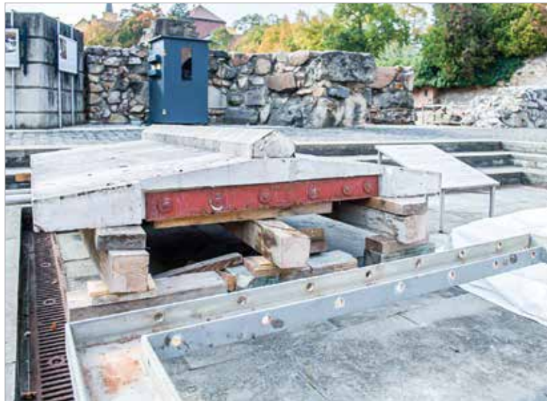
A fedlap szétszedésekor kiderült, hogy elkorhadtak a párnafák, ezeket is cserélik