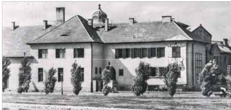
Régi levelezőlap a Magyar Filmroda fotójával

napjainkban a Frim Jakab Képesfejlesztő Otthon működését biztosítja. Egykor azonban a Székesfehérvári Agg Úrinők Otthona-ként funkcionált.