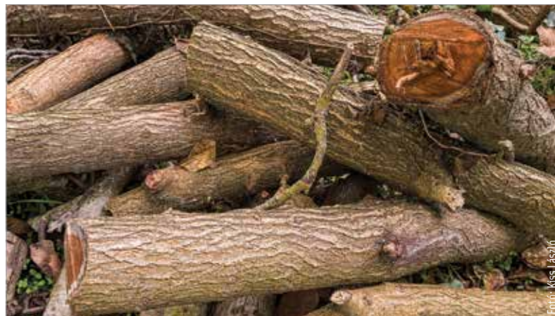
Naponta több mint ötszáz köbméternyi fát vágnak ki a VADEX munkatársai

A Tűzifa-programról részletesen a VADEX honlapján tájékozódhatnak az érdeklődők.