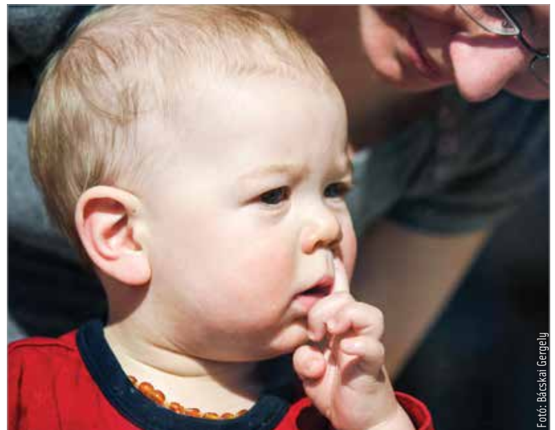
Senki nem szereti, ha folyik az orra