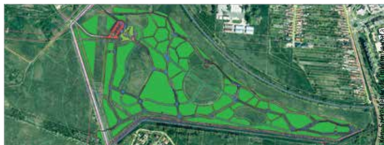
Földes és murvás sétányok lesznek majd az új erdőben

A kivitelezés ugyan befejeződik 2023 végére, de néhány év és megfelelő gondoskodás szükséges lesz még ahhoz, hogy igazán szép szabadidőparkká alakuljon a terület.