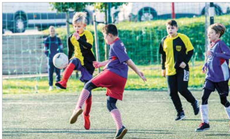
Mindenki komolyan vette a meccseket

egészségügyi szűrésen, általános állapotfelmérésen és életmód-tanácsadáson is részt vehettek bárki. A kupán a harmadik helyezést a Zentai Úti, a másodikat a Hétvezér Általános Iskola érte el, míg az első helyen a Széna téri Általános Iskola csapata végzett.