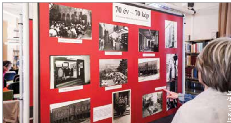
Hetven éve nyitották meg a megyei könyvtárakat

Hetven év, hetven kép címmel kiállítás is nyílt, melyen az elmúlt hét évtized emlékei ismerhetők meg. De a régi olvasók és kollégák találkozójaival is készültek. A hétfői ünnepi eseményen részt vett Lechner Zoltán alpolgármester is, aki a város egyik kulturális ékkövének nevezte az intézményt, mely a folyamatosan bővülő szolgáltatások mellett számos előadással is rendszeresen várja a közönséget. Nemcsak a programokkal, de értékes olvasnivalóval is szeretné megajándékozni az olvasókat a könyvtár: a születésnap tiszteletére hetven könyvet rejtettek el város szerte. A szerencsés megtalálók megtarthatják a köteteket.