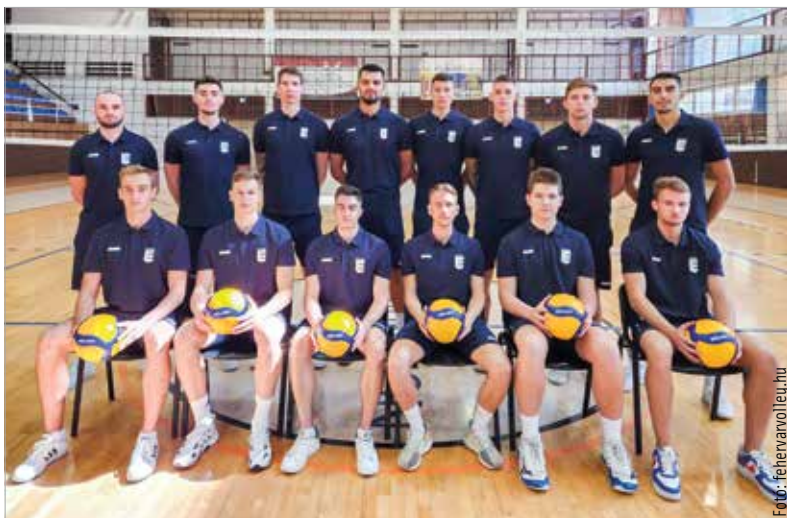
A legmagasabb osztályban is letette névjegyét a fehérvári férfi röplabdacsapat

zést a csapat játékában, aminek eredményeképpen a harmadik játszma fordulatot hozott: Redjo Koçi vezérletével szépített, majd egyenlített is a fehérvári csapat, a rövidített ötödik játszmában pedig 11-11 után az albán válogatott játékos négy ponttal lezárta a meccset. Így 3:2-es sikerrel rajtolt a MÁV Előre-Foxconn, a történelmi meccs győzelemmel zárult. Hazai pályán szombaton mutatkoznak be Kholmanék, a magyar férfi röplabda emblematikus klubja, a Kaposvár ellen. A meccset a VOK-ban rendezik.