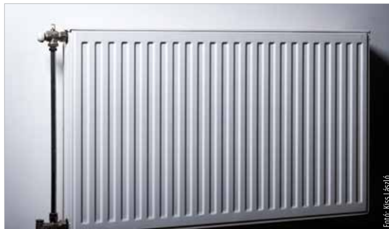
A SZÉPHŐ-vel történő egyeztetés után véglegesíti az önkormányzat a városi takarékosági intézkedéseket

említett, melynek jelenlegi, hozzávetőlegesen hétezer forintos havi távhőszámlája körülbelül százötven forintra ugrana, ha a piaci árat kellene fizetni. Hozzátette: a rendelet és annak mellékletei rendkívül specifikusak, így feltétlenül szükség van a SZÉPHŐ-vel való részletes egyeztetésre: „Ezen