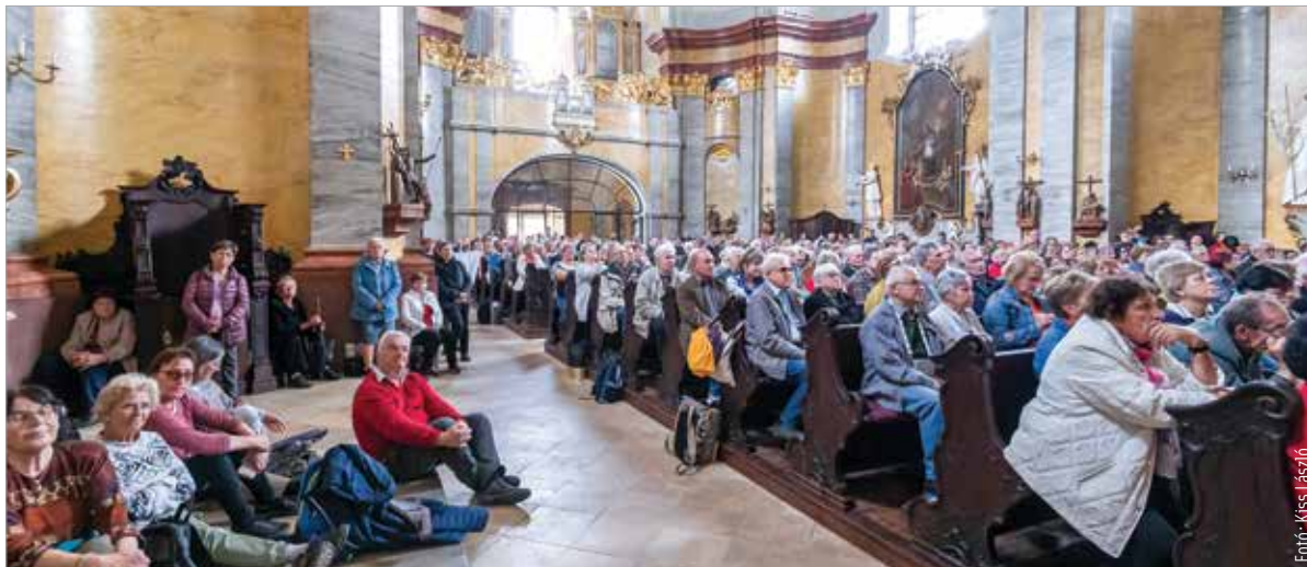
A résztvevők megnézték államalapító királyunk, Szent István szarkofágját, a felújított Szent István-székesegyházat, és az Aranybüllához is elzarándokoltak

„A zarándoklat egyrészt egy találkozás számunkra. Másrészt pedig imádkozunk a nemzetért. A zarándoklatot mindig a nemzetnek ajánljuk. Most sajnálatos aktualitása van annak is, hogy a békeségért imádkozunk, nemcsak belpolitikai szinten, hanem külpolitikailag is, hiszen a nemzetért való imánk egy nagy egységbe ágyazódik bele - abba, hogy béke legyen körülöttünk is! Így tehát a békéért ajánljuk fel ezt a zarándoklatot.” A KÉSZ harmincöt csoportjának több mint ötszáz tagja jött el az egész napos programra. Magyar-