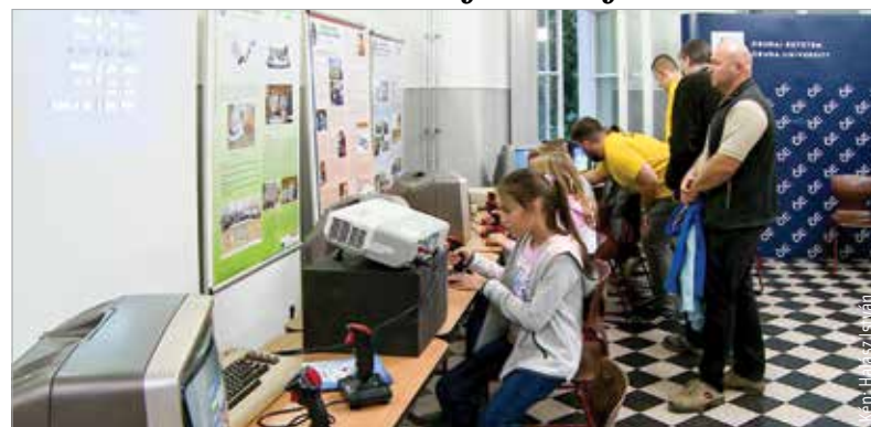
Szórakoztató, inspiráló előadások, kísérletek, laborbejárások és játékos programok is várták a látogatókat az Obudai Egyetem Alba Regia Műszaki Karán, mely idén is csatlakozott a Kutatók éjszakájának mintegy kétezer országos programjához