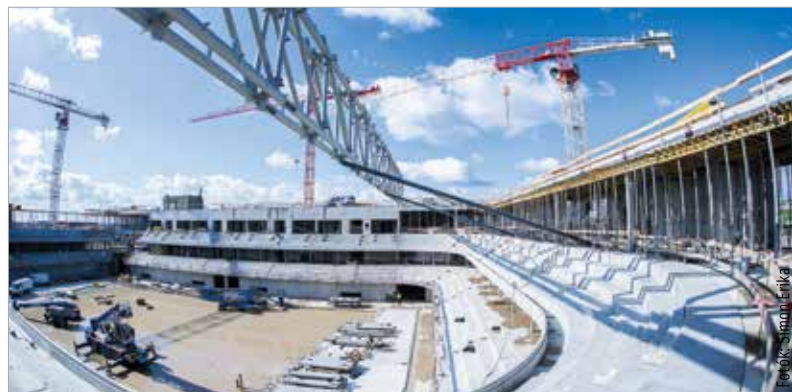
Ütemterv szerint halad az Alba Aréna építése

Az Alba Aréna épülete már látványosan magasodik a Budai út mellett. Tavaly novemberben adták át a munkaterületet, és az azóta eltelt tizenegy hónapban a csarnoképület vasbeton szerkeze-