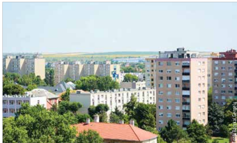
A lakossági távhődíjak a jelenlegi fűtési szezonban nem változnak

A polgármester példaként egy negyvenöt négyzetméteres lakást