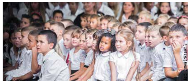
A megjelent rendelet szerint őszi szünet nem adható ki, a téli hosszabb lesz

Hogy a spórolást lehetővé tegyék, hosszabb lesz az idei téli szünet: december huszoneketedikétől január nyolcadikáig tart majd. Ebben az időszakban kormányzati igazgatási szünet is lesz. Gulyás Gergely arról is tájékoztatta, hogy Balla György miniszteri biztos feladta lesz, hogy koordinálja a tárgyalásokat az önkormányzatokkal a kiadáscsökkentésről, főleg az energetikai területen. Minden önkormányzattal külön fognak tárgyalni.