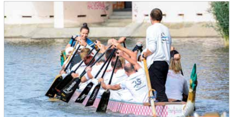
Fontos az összhang!