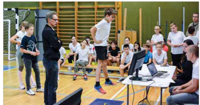
Különböző ügyességi feladatok várták a diákokat