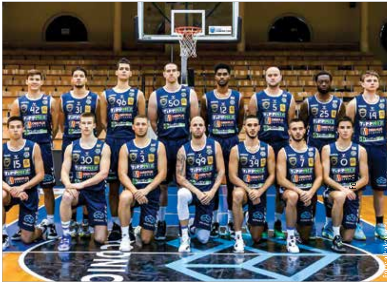
A tavalyi bronzérem után az új idényben is a legjobbak közé igyekeznek az Alba

A nyári holszezon talán legfontosabb fejleménye az egyre nehezebb gazdasági helyzetben különösen örömteli szponzori szerződés volt, ami után immár Arconic-Alba Fehérvár néven fut neki az idénynek a kosárcsapat. Az persze még megjósolhatatlan, hogy az energiaár-robbanás milyen hatással lesz a sportéletre. Várható, hogy a sportlétesítmények fenntartóinak olyan kényszerintézkedéseket kell hozniuk, mint az elmúlt években a járvány miatt. Az Alba nem a legnagyobb költségvetésű klub a magyar mezőnyben, de a városi létesítményeket esetlegesen érintő korlátozások most jobban aggaszthatják a sportkedvelőket, mint a keret versenyképessége. Mert utóbbival, talán kijelenthetjük, nem lesz gond.