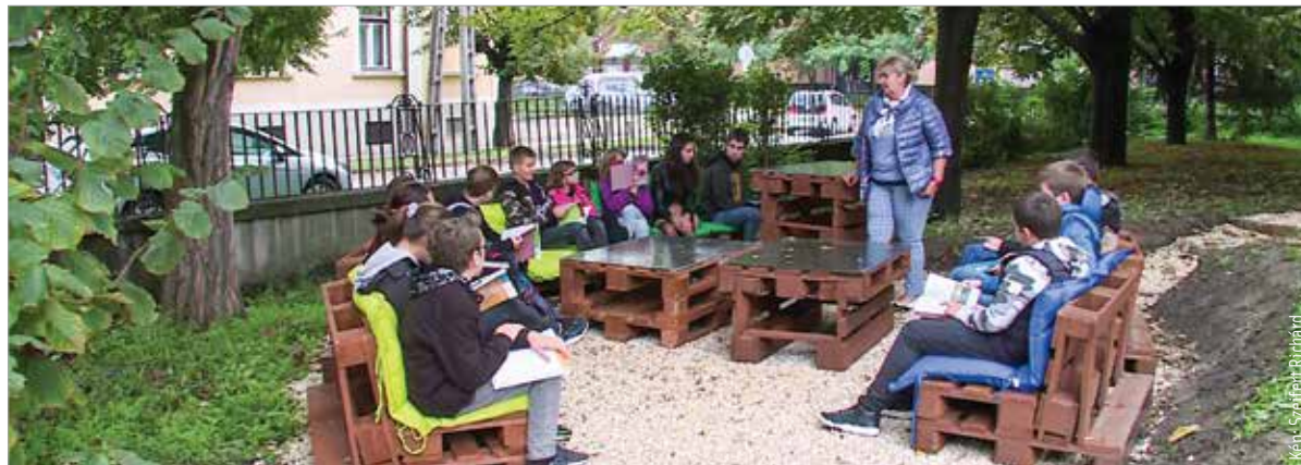
A diákok élvezik a szabadtéri osztálytermet

„Építünk egy osztálytermet, méghozzá egy szabadtéri osztálytermet ennek az iskolának a kertjébe, jött az ötlet! Miután ez egybeesett a Hydro társadalmi felelősségvállalási kezdeményezéseivel, valamint azokkal az alapítványokkal, amiket a Hydro világszerte, így Székesfehérváron is támogat, a cég azonnal mellénk állt,