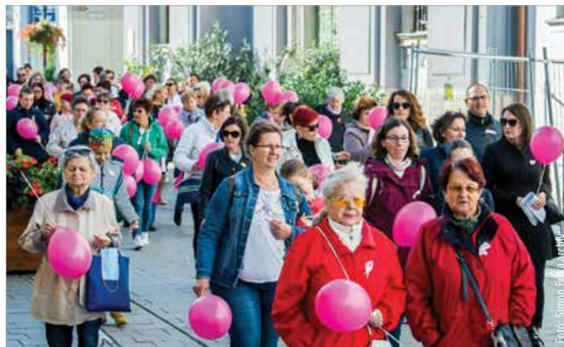
A mellrák leginkább a negyven év feletti nőket veszélyezteti

Tavaly a szervezett emlővizsgálatra behívott hölgyek harminckilenc százaléka ment el a szűrésre Székesfehérváron, egész Fejér megyét tekintve pedig mindössze harmincnegyzs százalékos volt a részvételi arány.