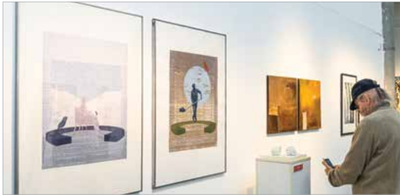
Az Országzászló téri múzeumi épületben kiállított műveket szakmai zsűri válogatta ki