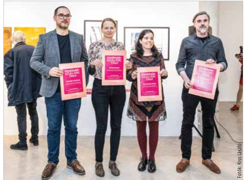
A Fehérvár Szalon díjazottjai