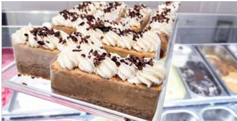
A vegánoknak igazi csemege a gesztenyés szelet!