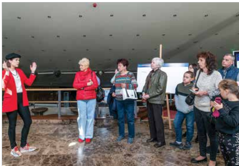
A pincétől a padlásig végigjárhatták az érdeklődők a színházat

hogy a székesfehérvári színház a közösség színháza, és a társulat is szívesen hozza össze a környékben élőket, nemcsak az előadások alkalmával: „Minden évben, mielőtt a Koronázási szertartásjátékot elkezdjük, felhangzott Latinovits Zoltán előadásában Ady Endre Intés az őrzőkhöz című verse. Abban van egy sor, ami úgy szól, hogy „Az élet él és élni akar”. Ez tulajdonképpen a mai napnak is lehet a mottója: járvány ide, energiaárak oda, az emberek élnek és szeretnék jól érezni magukat!” – hangsúlyozta Szikora János.