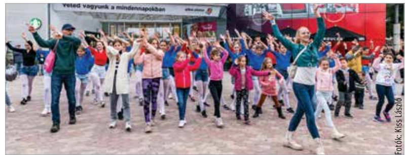
A közös tánc öröme

Székesfehérvár tánciskolái is csatlakoztak a IV. Nagy Táncválasztó elnevezésű programhoz.