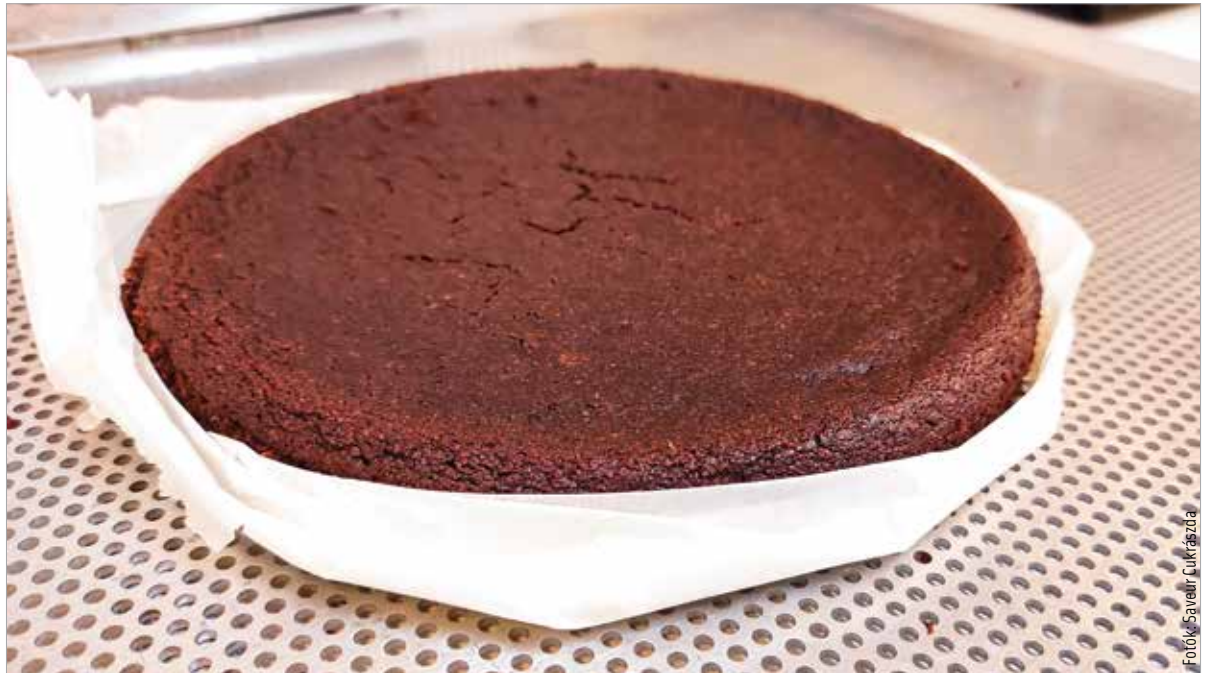
Meg kell várni, amíg a süteményalap megszilárdul!

Végül belekeverjük a szobahőmérsékletű margarint és a mascarpont, aztán az egészet turmixoljuk. Amikor a massa kész, ráöntjük a formában tartott alapra, és a hűtőbe tesszük. Ha a sütemény megszilárdult, akkor tegyük a tetejére a fügelekvárt és a narancsot!