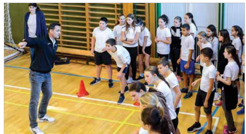
Elkészülni, vigyázz, kész, rajt!