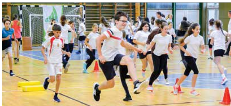
Gyorsabban, magasabbra, erősebben!