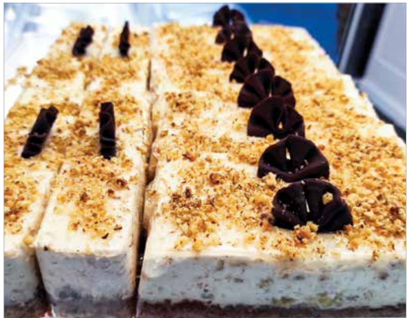
További őszi finomság az almás-diós sütemény

Fehérjetartalma elenyésző, szénhidrát viszont bőven van benne, akárcsak rost, így bátran beépíthető az egészséges étrendbe! 100 gramm friss füge 232 milligramm káliumot tartalmaz, ami a napi szükséglet körülbelül 5 százaléka, és segít abban, hogy izmaink és szívünk megfelelően működjön. Ugyanekkor mennyiségben 4,7 mikrogramm K-vitamin is található, ami a napi szükségletünk 5 százalékát fedezi, és segít, hogy vérünk minősége megfelelő legyen. A gyümölcsben ezenkívül vas, kalcium, magnézium, folsav és A-vitamin is található.