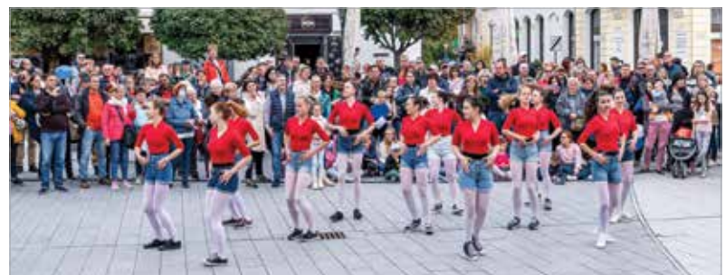
Rengeteg érdeklődőt vonzott a táncos flashmob

célja a táncműfajok megismertetésén túl a tánc és a mozgás széles körben történő népszerűsítése volt, hogy minél többen a táncban találhassák meg az egészséges életmódhoz, a tudatos mozgáshoz és a közösségi élményhez vezető utat.