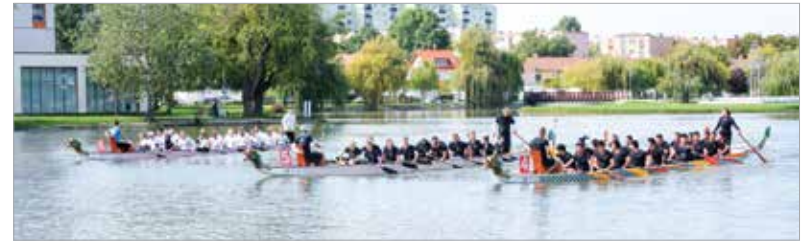
A rajt előtti pillanatok

és az Egyetemi Regatta versenyével kezdődött a program, melynek során ötszáz iskolás állt rajt. Szombaton a felnőtt, vegyes csapatok mérhették össze tudásukat. A verseny 200 és 2000 méteren zajlott az Open, a Vegyes, a Maraton, valamint a Házisárkányok Kupájáért.