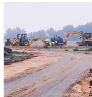
Tereprendéssel kezdődtek a munkák

Arra kérik az Alsóvárosi-réten szabadidejüket eltöltőket, hogy a következő időszakban a kerékpárúttól nyugatra eső területet vegyék