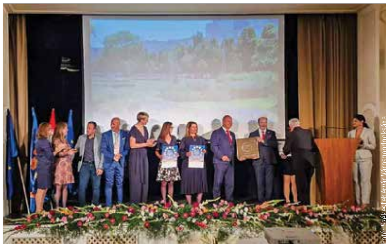
Múlt héten szombaton, Balatonfüreden tartották az Entente Florale idei díjátadóját