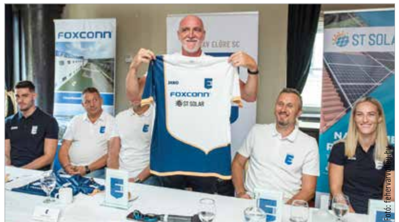
A klubelnök büszkén mutatja az új mezt, amit az Extraligában viselhetnek a fehérvári röplabások