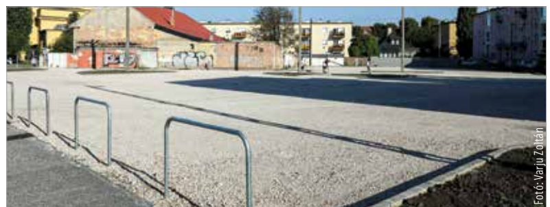
Kedden birtokba vehették az autósok a Vasvári gimnáziummal szemközti területen épült ideiglenes parkolót