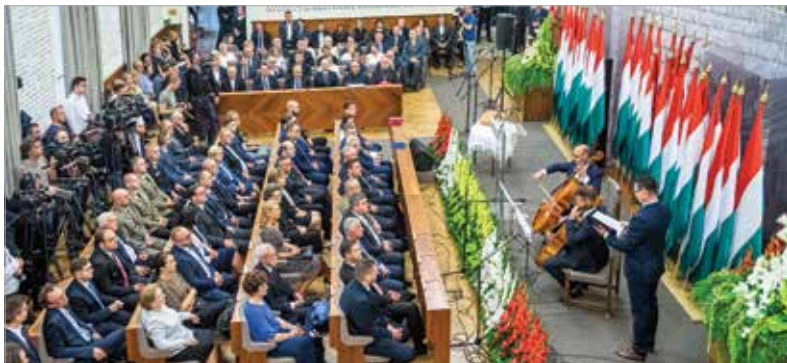
A Városháza Díszterme adott otthont a Szent István-napi ünnepnek

Novák Katalin hozzátette: ma nem az a kérdés, hogy hová tartozunk, hanem az, hogy ezer év múlva létezik-e még a magyarok természetes otthona, a keresztény Európa. Most, amikor a kontinens a nagyhatalmak küzdőterévé válhat, az uniós országainak össze kell fogniuk és közös döntéseket kell hozniuk: „A magyaroknak is fel kell ismerniük az azonos értékeket és