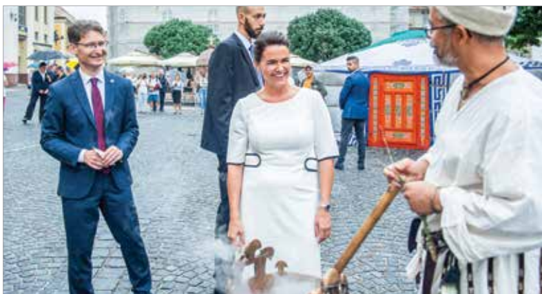
A köztársasági elnök a Királyi Napok részeként tartott népművészeti vásáron is járt

Az államfő hangsúlyozta: a világ és ezen belül Európa rendjének megőrzéséhez bátor és határozott vezetőkre van szükség, akik képesek a jog és igazságosság fenntartására, akik türelmesek és józanok tudnak maradni.