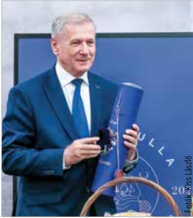
Benkő Tibor Székesfehérvár díszpolgára

Székesfehérvár díszpolgára címmel tüntették ki Benkő Tibor nyugállományú vezérezt, Magyarország korábbi honvédelmi miniszterét. Hosszú katonai pályafutása utolsó előtti állomáshelye volt városunk. Az Összhaderőnemi Parancsnokság parancsnokaként, majd később honvédelmi miniszterként is segítette Székesfehérvár honvédségben betöltött szerepének jelentős fejlesztését. A felálló Magyar Honvédség Parancsnoksága, valamint a NATO- és a multilaterális katonai egységek városunkba telepítésével hozzájárult ahhoz, hogy Székesfehérvár katonavárosból katonai fővárossá váljon.