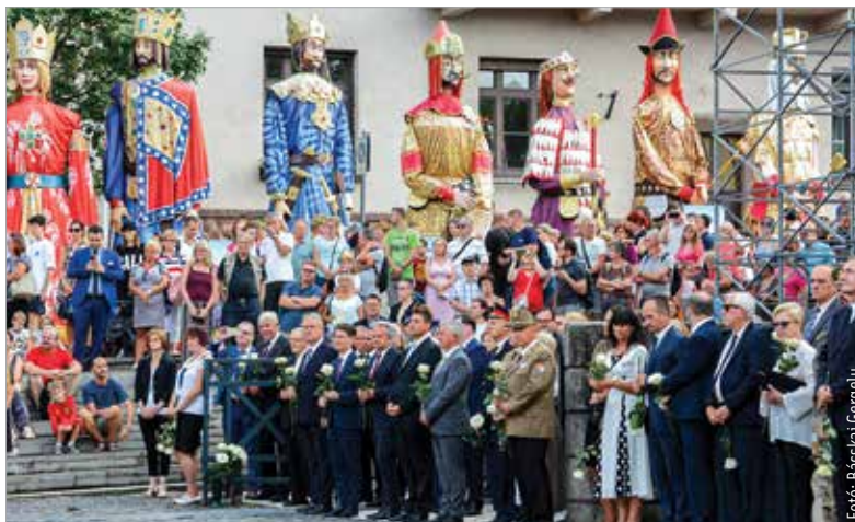
A város és a megye képviselői együtt emlékeztek meg Szent István örökségéről

tartunk magunk mellett. Hogy tudjuk a másiktól, hogy hozzánk, hogy közénk tartozik, hogy a közös nyelv, a közös kultúra, a közös gondolat ereje együvé kovácsolja a nemzetet. Nekünk a múltban a jövő a fontos! Ezért védjük és állunk ki értékeink, szabadságunk és jogaink mellett!” – mondta az elnök, majd békét, bőséget, hitben, szeretetben megélt szép jövőt kívánt a nemzetnek és Fejér megyének.