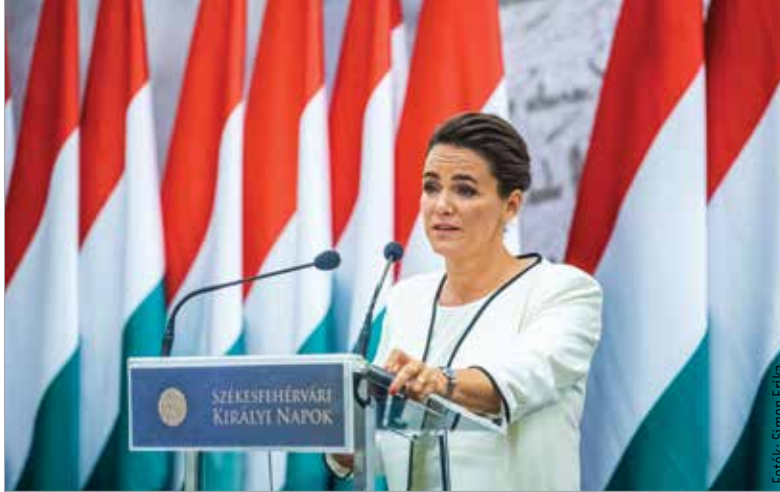
Novák Katalin Székesfehérváron mondott ünnepi beszédet augusztus huszadikán