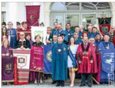
Harminc kárpát-medencei borrend képviseltette magát a székesfehérvári találkozón