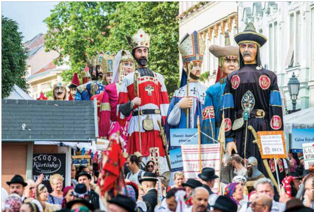
A királyi óriásbábok és az ország minden részéről érkező hagyományőrök vonultak szombat délután a Nemzeti Emlékhelyre