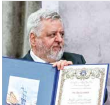
Lánczi András Tiszteletbeli polgár

Szintén tiszteletbeli polgár címet kapott dr. Lánczi András Széchenyi-díjas filozófus, politológus, egyetemi tanár, a Budapesti Corvinus Egyetem korábbi rektora. Tudományos kutatóként, oktatóként, egyetemi vezetőként a hazai felsőoktatás meghatározó alakja. 2015-ben az önkormányzat együttműködési megállapodást kötött az egyetemmel a fehérvári képzési központ létrehozásáról: a székesfehérvári campus 2016 szeptemberétől fogadja a hallgatókat. Lánczi András egyetemi vezetőként a város és az intézmény közötti konstruktív együttműködés támogatása révén hozzájárult a székesfehérvári felsőoktatás fejlődéséhez.