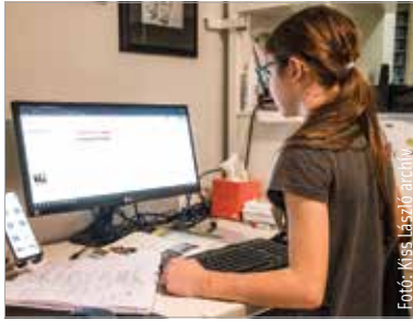
Két évvel ezelőtt így nézett ki egy tanóra. Idén nem készülnek online oktatásra a fehérvári intézmények.

„A kormány célja az, hogy az iskolák zavartalanul, a hagyományos tanrendben, jelenléti oktatásban működjenek. Így készülünk az új tanévré. Bízunk benne, hogy minden fennakadás nélkül haladhat a jelenléti oktatás. A jogszabály értelmében tantermen kívüli digitális munkarendet a köznevelésért felelős miniszter rendelhet el.