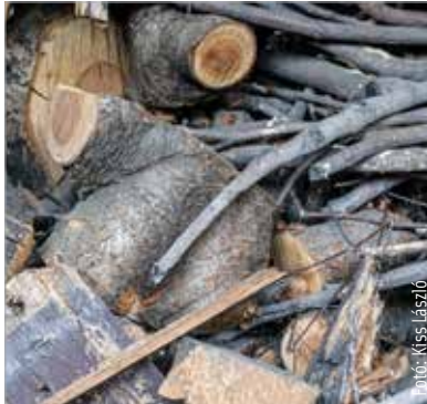
Tűzifa vásárlásához is lehet igényelni önkormányzati rezsitámogatást

A támogatás mértéke kapcsán a polgármester elmondta: mérvadó volt az, hogy az önkormányzat a most elképzelhetőnek tartott legmagasabb számú jogosult esetében is ki tudja gazdálkodni