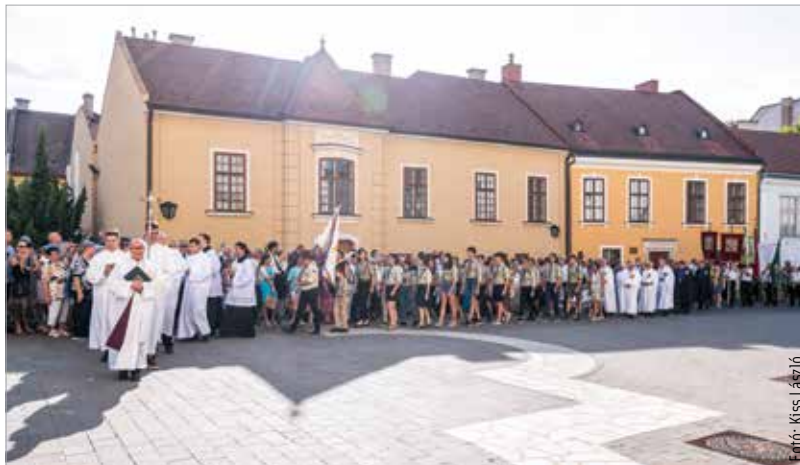
A magyar szent család, Szent István, Boldog Gizella és Szent Imre ereklyéi körmenetben érkeztek meg vasárnap délután a Püspöki Palotából a megújult székesegyházba