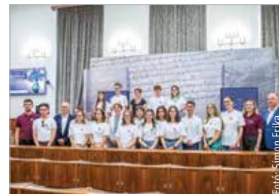
Határon túli színjátszókat köszöntött a polgármester a Városházán

Cser-Palkovics András kedden fogadta a Városházán azokat a felvidéki fiatalokat, akik a Kárpát-medencei Színjátszó táborba érkeztek, és szerepet kaptak a Koronázási szertartásjátékban, melynek idején, tizedik epizódja a III. András – Az utolsó aranyágacska címet viseli. A polgármester köszöntőjében úgy fogalmazott: a fiatalok jelenléte kapcsolódik az előttünk álló egyedülálló előadás szellemiségéhez, ami a nemzet történelméről szól a nemzet történelmi fővárosában. Hornung Ágnes, a Kulturális és Innovációs Minisztérium államtitkára kiemelte: Magyarországnak ugyanolyan fontos az, hogy most itt lehetnek, mint a határon túl élő fiataloknak, hiszen „...egy nemzet vagyunk, számunkra nem léteznek határok!” A Rákóczi Szövetség, Székesfehérvár és a Vörösmarty Színház között néhány évvel ezelőtt született meg az együttműködés, melynek célja, hogy a határon túli magyar diákok is részesei legyenek szellemi és kulturális örökségünknek.