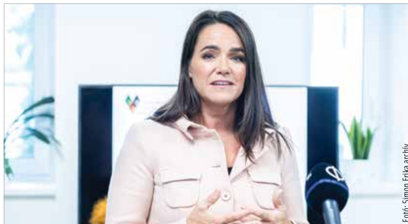
Novák Katalin, Magyarország Köztársasági elnöke augusztus huszadikán délelőtt tíz órakor mond ünnepi beszédet a Szent István téren, ezt követően pedig Cser-Palkovics András polgármester köszönti a jelenlévőket. Az eseményre a város önkormányzata minden érdeklődőt szeretettel vár!

fehérváron kell az utódoknak emlékezni. Ezért különösen megtisztelő számunkra, hogy Novák Katalin, Magyarország köztársasági elnöke az állami ünnepségek keretében hivatalos beszédét itt mondja el, Székesfehérváron!” – hangsúlyozta Cser-Palkovics András. Novák Katalinnak ez lesz az első látogatása városunkba köztársasági elnökként. Magyar államfő hosszú évek óta nem járt hivatalos látogatáson Székesfehérváron Szent István ünnepe kapcsán – tette hozzá a polgármester.