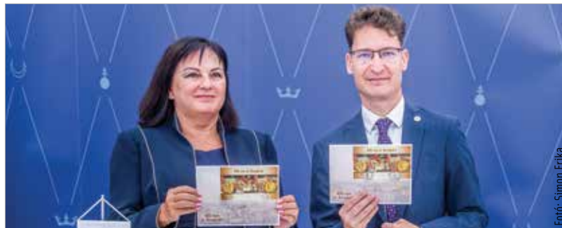
Művészi bélyeg jelent meg az Aranybulláról