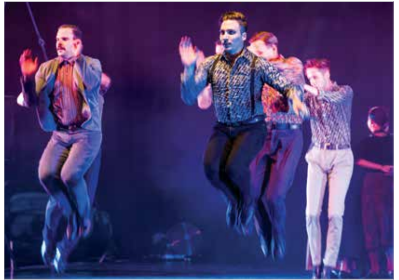
A Duna Művészegyüttes koreográfiája a történetmesélésen alapult

Szombat este ünnepélyes megnyitóval kezdődött el a Királyi Napok Folkfesztivál. A nyitányon alapfokú művészeti iskolák növendékei és tánclegendák műsorát láthatták a népi kultúra barátai, a következő három napon pedig a Fitos Dezső Társulat, A Duna Művészegyüttes, az Állami Népi Együttes, a Jászsági Népi Együttes, valamint Ferenczi György és Pál István „Szalonna” együttese léptek színpadra.