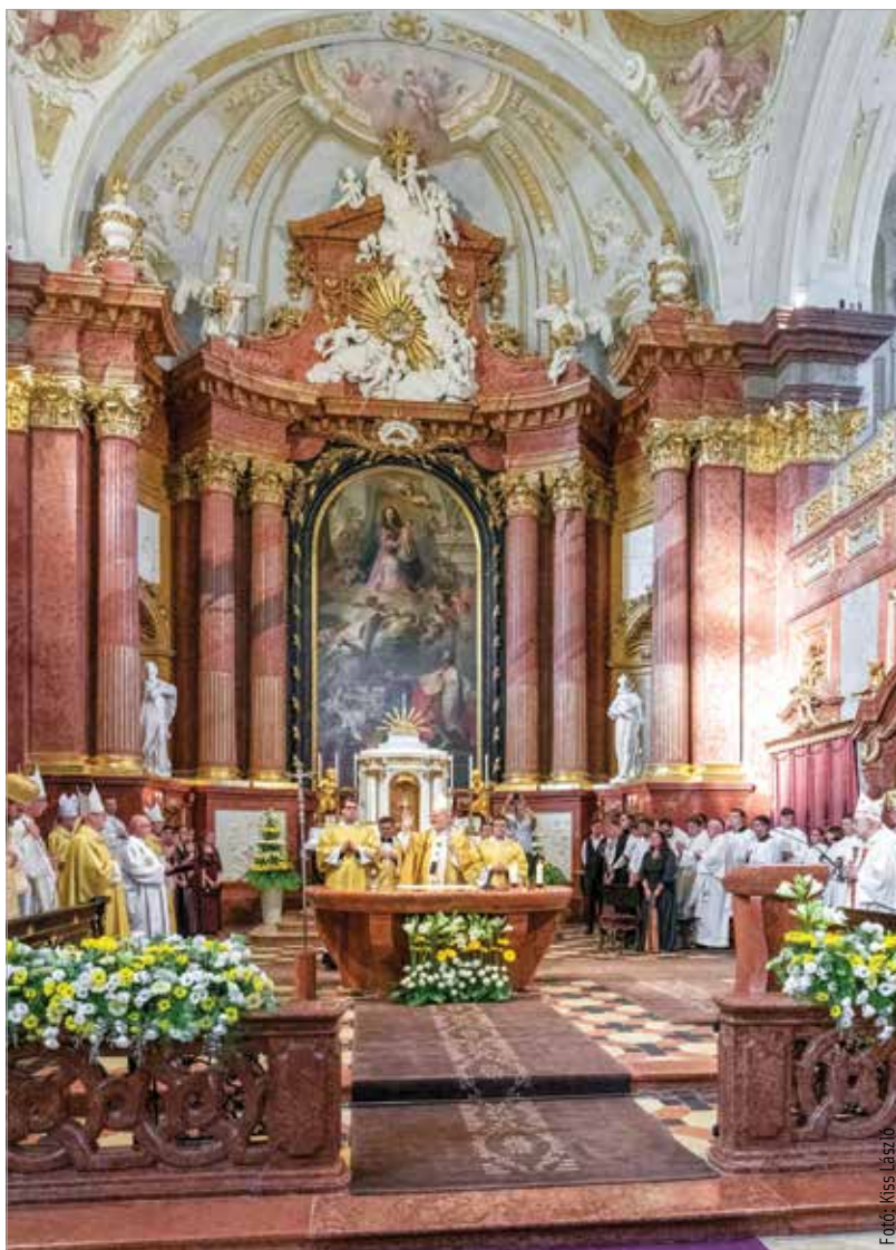
Erdő Péter bíboros, esztergom-budapesti érsek a Magyar Katolikus Püspöki Konferencia tagjaival közösen celebrált szentmisét a felújított templomban

Befejeződött a Szent István-székesegyház rekonstrukciója: Székesfehérvár fogadalmi ünnepén Erdő Péter bíboros-primás, esztergom-budapesti érsek áldotta meg a felújított templomot, és újtotta meg Szent István Szűz Máriának tett felajánlását.