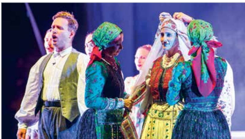
Az élet nagy, sorsfordító pillanatai énekszóban elmondva