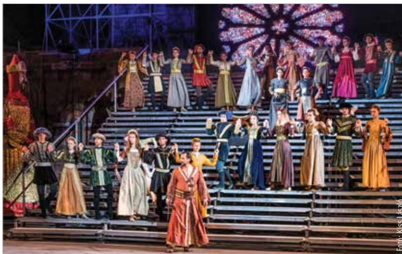
Grandiózus hangzás- és látványvilággal zárja a Koronázási szertartásjátékok sorát a III. András – Az utolsó aranyágacska című előadás

Javában zajlik a V. Kárpát-medencei Színjátszó tábor Székesfehérváron, melynek keretében határon túli magyar diákok mélyülhetnek el a színjátszás rejtelmeiben. A hét folyamán a fiatalok lehetőséget kapnak arra, hogy a Székesfehérvári Királyi Napok keretében megrendezendő Koronázási szertartásjátékban is szerepeljenek.