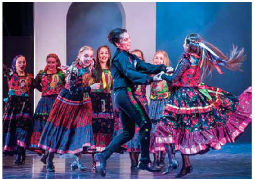
A Fitos Dezső Társulat tagjai nem spóroltak az energiával: csupa tűz és lendület jellemezte fellépésüket