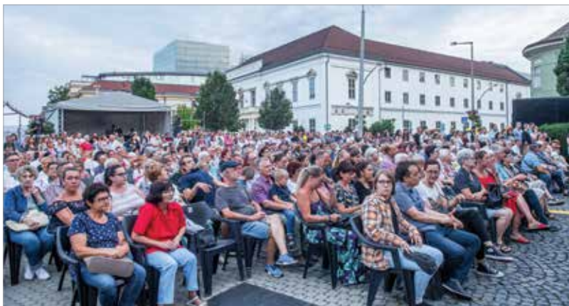
Minden este telt ház előtt mutakozhattak be az együttesek