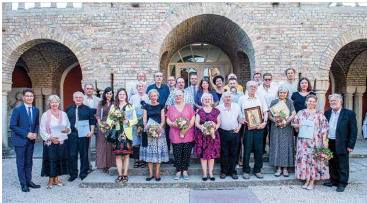
A díjazottak a Bory-várban

A díjazottak teljes névsorát megtalálják a www.szekesfehervar.hu oldalon!