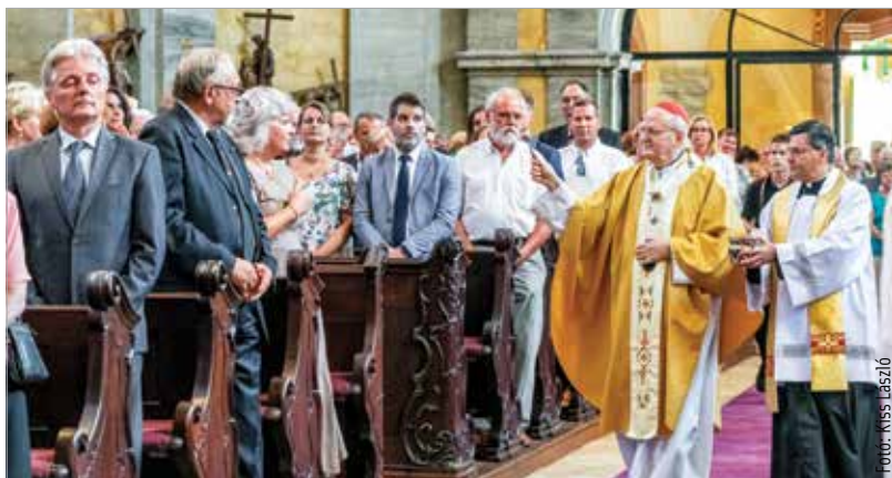
Erdő Péter megáldotta a bazilikát, és megújította hazánk felajánlását Szűz Máriának, ahogy azt Szent István király tette 1038-ban a halála előtti napon, amikor trónörökös nélkül maradt az ország