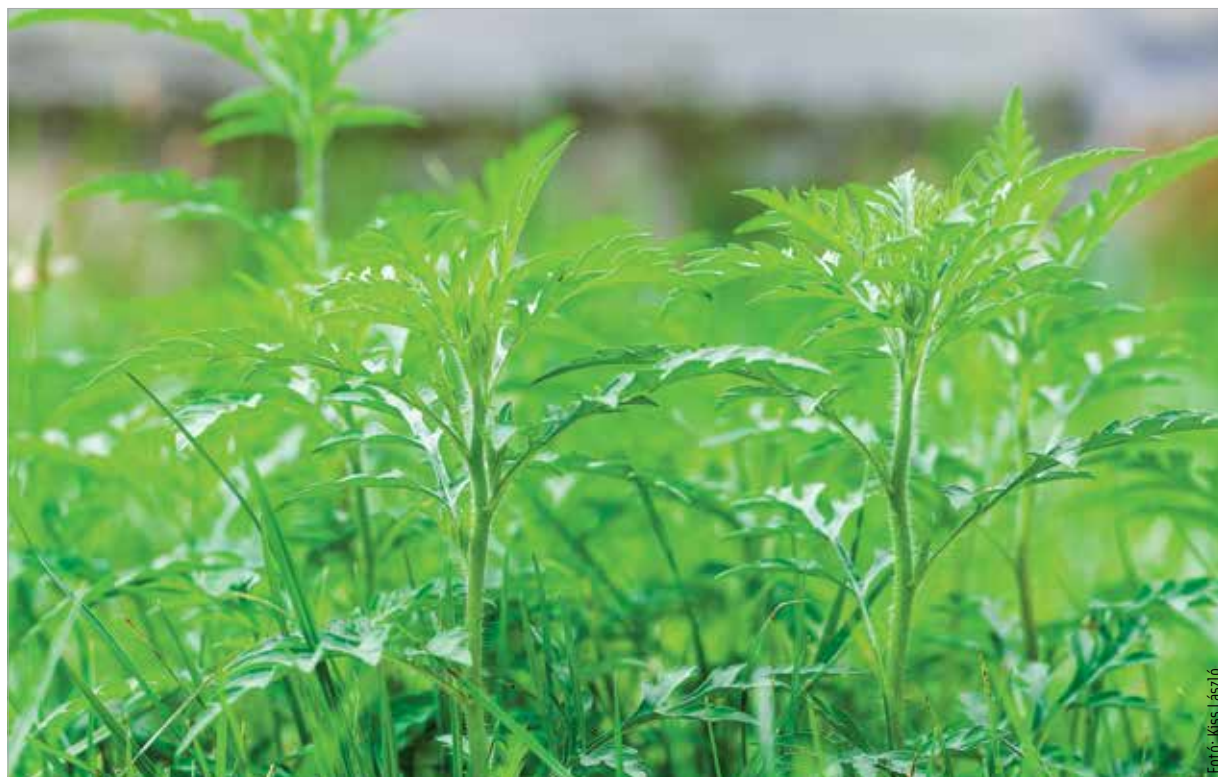
A statisztikai adatok szerint a legtöbben a parlagfű virágpórára érzékenyek

Fontos odafigyelni arra is, hogy a pollenallergia más érzékenységgel is társulhat, és így keresztallergia alakulhat ki. Ez azt jelenti, hogy valamilyen friss zöldség vagy gyümölcs elfogyasztása túlérzékenységi reakciót vált ki olyan embereknél, akik valamilyen növényi pollenre allergiások. A