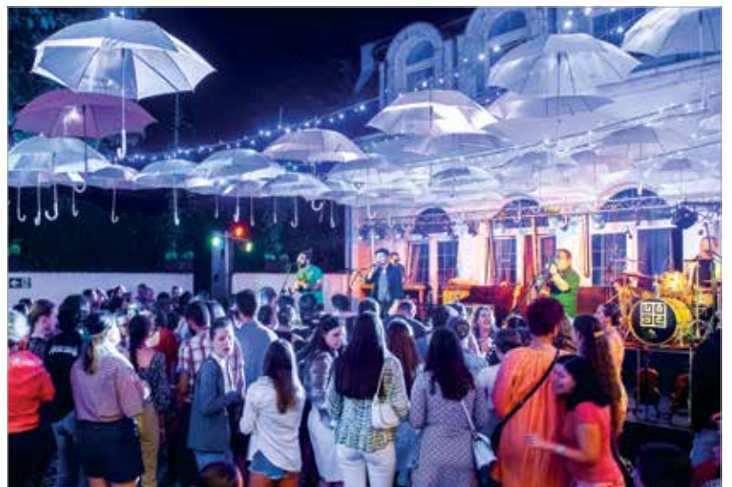
Az előadásokat tánczási mulatság és koncertek követték