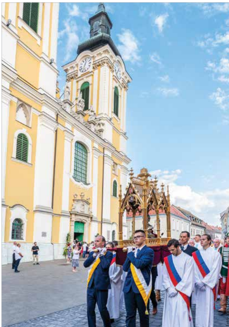
A székesegyházat 2018 áprilisában zárták be. A külső felújítás után a templom hajójában 2018 augusztusa és októbere között régészeti ásatások kezdődtek, 2019 januárjában pedig megindulhattak a belső felújítási munkálatok. A felújítás során kétezer négyzetméter falképet tisztítottak meg, konzerváltak, állítottak helyre. A főoltárképpel együtt hatvanhat négyzetméter vászonképet, az altemplomban százharminchat sírtáblát restauráltak.