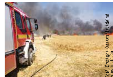
A szakemberek a Seregélyesnél keletkezett tűz oltásán dolgoznak