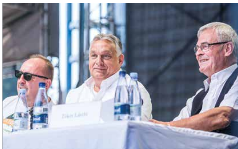
Tíz pont a jövőért

az új Mercedes-gyár építését, az egy egymilliárd eurós beruházás. Tranzitország vagyunk és tranzitgazdaság is akarunk maradni, ahol azt a megjegyzést kell tennem, hogy ha a világ blokkosodik, és megint kettévágják keletre és nyugatra, akkor mi nem ta-