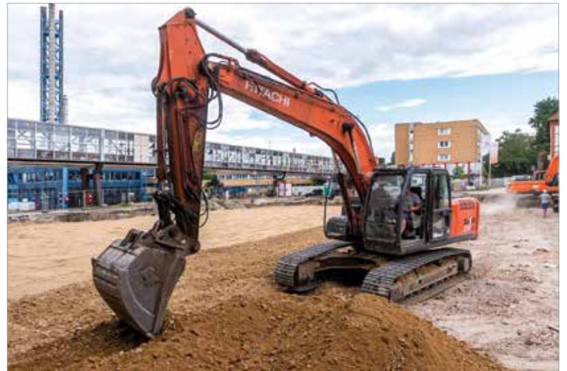
A munka zajlik, a 2023-ra megépülő új tömböt függőhíd köti majd össze a sürgősségi ellátó egységgel és a diagnosztikai tömbbel is

méter lesz. „Az épületbontási munkálatok befejeződtek, a létesítendő L épület földmunkái elkészültek, megkezdődött a cölöp-alapozás, és a tereprendezési munkálatok is rendben haladnak.”