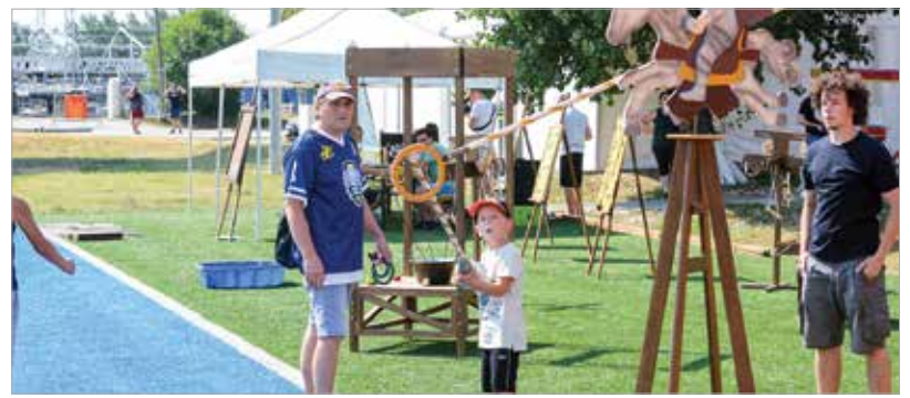
Logikai, ügyességi feladatokon is próbára tehetők tudásukat az érdeklődők, de egészségügyi szűréseken is részt lehetett venni. A legkisebbek pedig ugrólóvásban tölthették idejüket. V. Z.