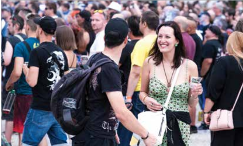
A huszonöt éves születésnapot tartával, tűzijátékkal és egy szabadtéri, nagyszínpados Necc Partyval ünnepli a fesztivál szombaton

felé is, de természetesen a hazai kedvencek sem maradnak el. A Fehérvár Enthroners nemzetközi szereplése miatt idén nem használható kempingként a First Field, így a sátorozók a Bregyó közben szállhatnak meg. A kemping és a rendezvény helyszíne között ingyenes buszjáratok szállítják a fesztiválozókat.