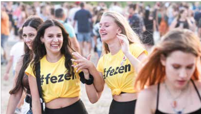
Óriási bulik, partihangulat, jó társaság – közel ötvenezer vendéget várnak a négy nap alatt