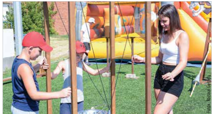
A perzselő napsütés és a hőség ellenére is szép számmal érkeztek érdeklődők a First Fielden rendezett Enthroners családi napra. A csapat ezzel a sportpiknikkel ünnepelte a szezon tizenhetedik mérkőzését. Közösségi és sportprogramokkal, óriás játékokkal, lovagi tornával, amerikaifutball-alapú erőpróbakkal várták a családokat.