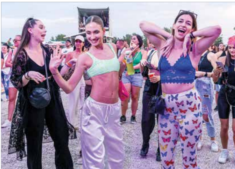
Két év kihagyás után ismét fergetes hangulattal várja Fehérvár a fesztiválozókat