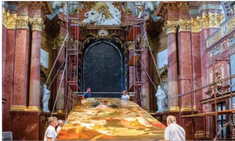
Restaurálás után visszakerült a főoltárkép a bazilika falára

Több mint három évig tartó restaurálás után visszahelyezték a Szent István király koronafelajánlását ábrázoló főoltárképet eredeti helyére, a Székesfehérvári Egyházmegye főtemplomának szentélyében. A teljeskörű restaurátori kutatásokkal 2016-ban kezdődött a nagyszabású projekt. A munkálatok zavartalan elvégzése érde-