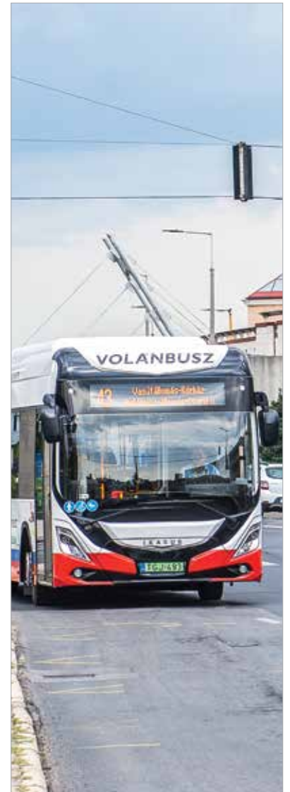
A flotta folyamatosan bővül, a múlt héten is álltak forgalomba új elektromos buszok

másról 6:35-kor induló 26G járat 26C jelzéssel 6:30-kor indul, az iskolai előadási napokon 7:15-kor induló járat pedig munkanapokon közlekedik a Depónia Kft-ig. A Videotontól 14:15-kor és 22:15-kor induló 26G járatok 26C-ként a Depónia Kft-től indulnak úgy, hogy a Videotontól a megszokott időpontban indulnak tovább. A Depóniát kiszolgáló járatok javítják a Csalán élők közlekedési lehetőségeit. A 26C járatok mindkét irányban érintik a megállóhelyet. Az autóbusz-álo-másról új 26C járatok indulnak munkanapokon és szabadnapokon 5:30-kor, munkanapokon 6:30-kor, 7:15-kor, 9:00-kor és 13:00-kor. A belváros felé új járatok indulnak munkanapokon 12:07-kor, 14:10-kor, 16:07-kor, 17:07-kor, 18:07-kor és 22:10-kor, a hét utolsó munkanapján 13:07-kor, munkanapokon és szabadnapokon 14:52-kor.