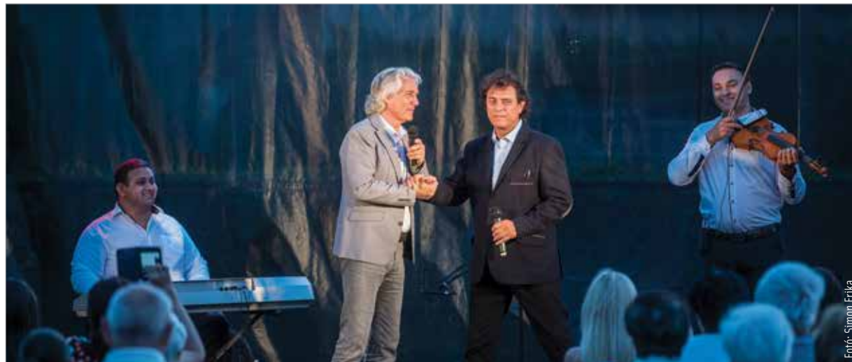
A négy barát ismét elvarázsolta a közönséget

Gergely Róbert Fehérváron is bizonyította, hogy miért is tartják a mai magyar énekes generáció egyik legeredetibb előadójának. A kellemes nyárestén kiderült, műfajtól függetlenül, csodás pillanatokkal képes megajándékozni hallgatóságát.