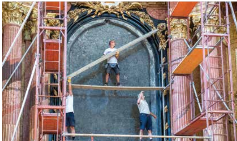
Gondos előkészület előzte meg a kép visszahelyezését

egy értékes, 13. századi limoges-i bronz korpusz. 2018 őszén Barokk mennysorozat címmel kiállítást rendeztek a székesegyházról a Csók