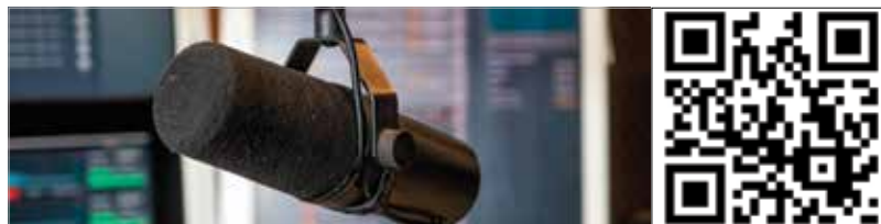
További részletek, érdekességek a rádiós beszélgetésben, amiből az is kiderül, mi történik a hat hónapos kiképzés végén. A beszélgetés a QR-kód leolvasásával indítható, vagy meghallgatható a Vörösmarty Rádió Youtube-csatornáján.

A szeptember 5-én induló kiképzés két ciklusból áll, kettő plusz négy hónapos. Az első két hónap általános alapképzés. A második – négy hónapos – szakaszban a résztvevők választhatnak, akár harckocsizó, ejtőernyős vagy bűvágyakorlatot is lehet szerezni. A résztvevők juttatása az első két hónapban megegyezik a mindenkori minimálbér összegével. Akik különleges műveleti besorolású alakulatot választanak, azok bruttó 260 ezer forintot kapnak. Emellett jogosultak lesznek többféle ellátásra, költségtérítésre.