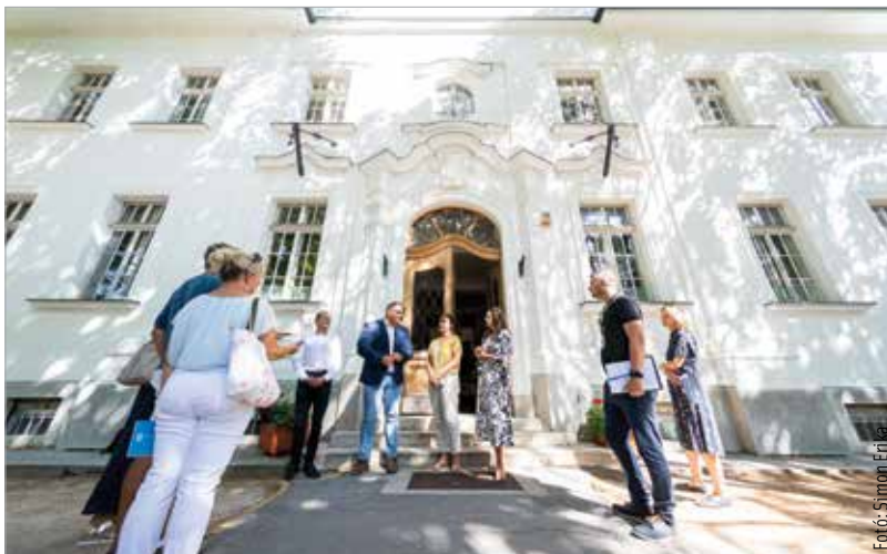
A tervek szerint a konyha és az étkező augusztus végéig elkészül, az épület többi részén a munkálatok jövő tavasszal fejeződnek be. A második ütem költsége bruttó 304 millió forint.