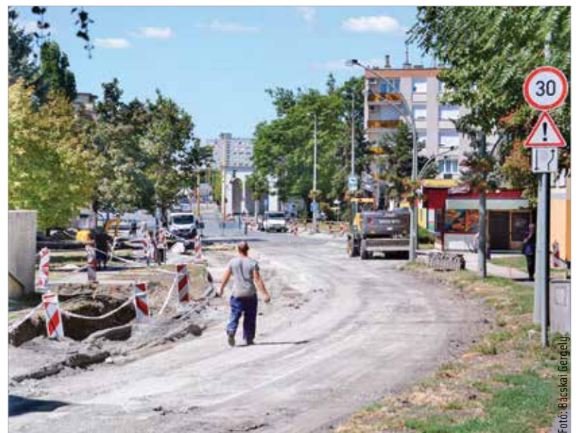
Öt helyszínen épül jelenleg járda és bicikliút Fehérváron

továbbá az Eszperantó tér és a Zichy liget között az útburkolat is megújul. Többen rémhíreket terjesztettek, hogy a volt Domus áruházal szembeni négyemeletesek mellett található fákat kivágják. Ilyen nem történik, ezeknek a fáknak a törzsét a munkálatok alatt védelemmel látta el a kivitelező, és a nyomvonal is a fákhöz igazodik. A beruházás a Koch László utca és Mátyás király körút kereszteződésében érint két fat.