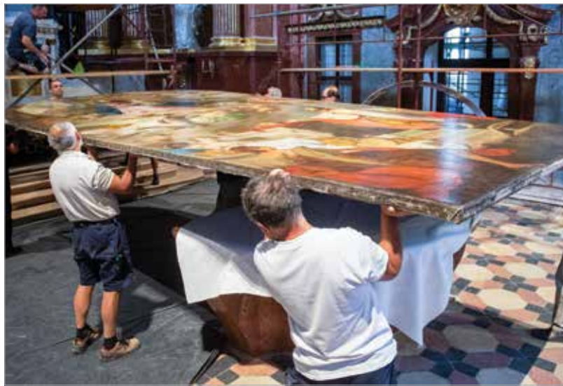
Minimum tíz ember erejére és precizitására volt szükség

kében 2018 tavaszán bezárták a székesegyházat, majd a templomhajóban régészeti feltárást végeztek. Az ásások során előkerült