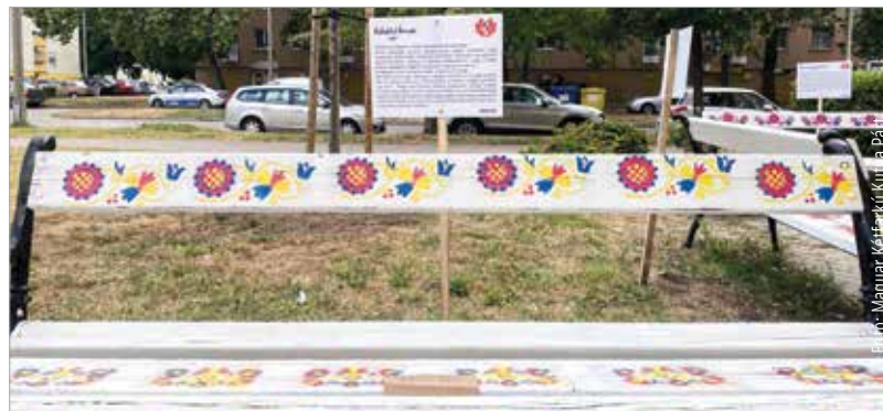
Négy padot újtott fel a Magyar Kétfarkú Kutya Párt a Sarló utca 1-es szám alatti teknős szobornál. Sárbogárdi, rábaközi, kunsági, illetve hódmezővásárhelyi mintákat festettek rájuk, majd ki is táblázták az adott tájegység rövid ismertetőjét.