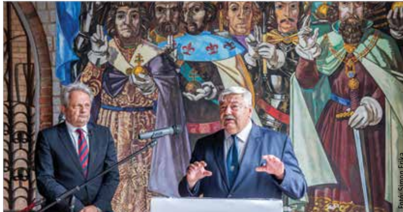
A Szent István 2025 programsorozat ősszel kulturális eseményekkel, konferenciákkal folytatódik Székesfehérváron.