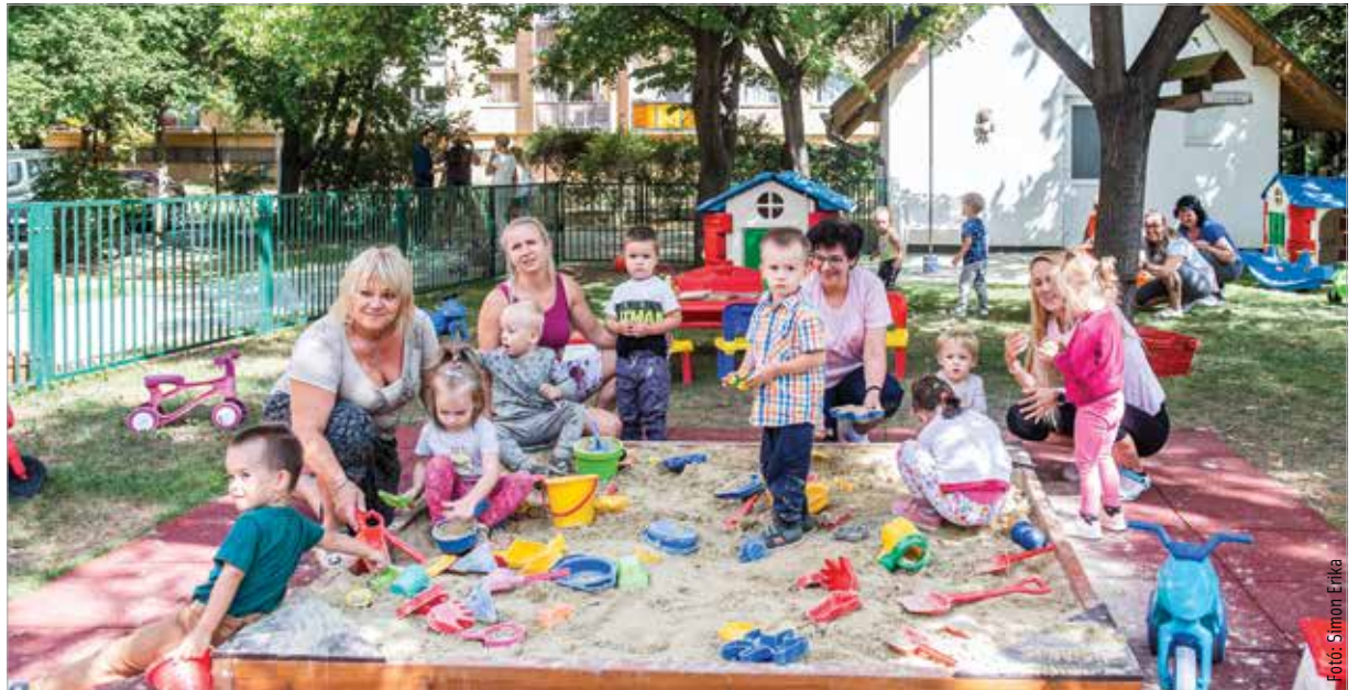
A bölcsődés gyerekek boldogan játszanak új otthonuk, a Mancz János Minibölcsőde udvarán