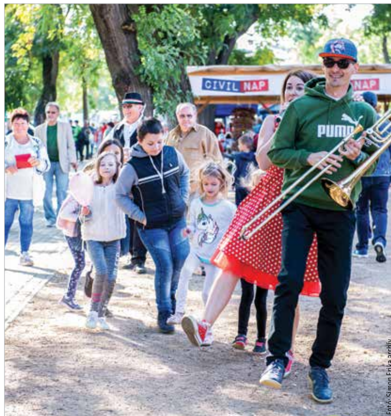
A Székesfehérvári Civilnap minden évben remek bemutatkozási lehetőséget kínál a szervezeteknek, ugyanakkor színes családi programot is nyújt az érdeklődőknek

A Civilnapon háromszor három méter alapterületű sátrakban egységként két szervezet standjának az elhelyezését tervezik, legfeljebb két sörpaddal, valamint áramvételi lehetőséggel. Mindezt a szervezők biztosítják valamennyi szervezetnek. A résztvevők számára az önkormányzat kisösszegű anyagi hozzájárulást is biztosít a kitelepülés költségeihez.