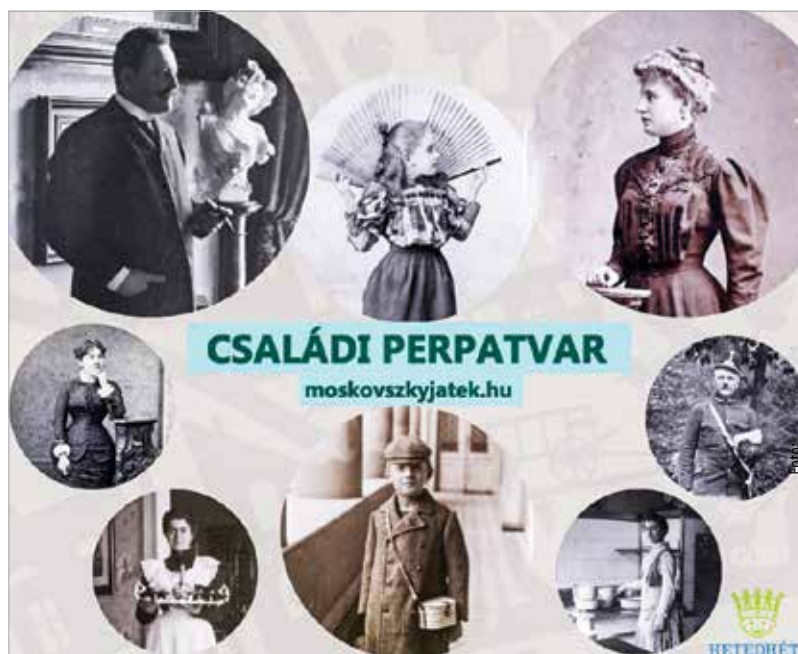
Minden érdeklődőt szeretettel várunk keddtől vasárnapig délelőtt tíz és este hat között az Oskola utcában!

Egy tizenkilencedik századi kaland részesévé válhatnak mindazok, akik kipróbálják a Hetedhét Játékmúzeum most elkészült interaktív játékát. A kettő-nyolc fős csapatok – családok, baráti társaságok – a porcelángyáros család történetét követhetik nyomon, melyben mindenki maga választja ki, melyik szereplő bőrébe bújik. Így a kaland résztvevői megtapasztalhatják, milyen kihívások vártak akkoriban a fiatalokra, akik álmaikat szerették volna követni, és akár énekesnőnek vagy vitéznek állni. Mi vált akkoriban egy nyugdíjazott katonára, vagy ép-