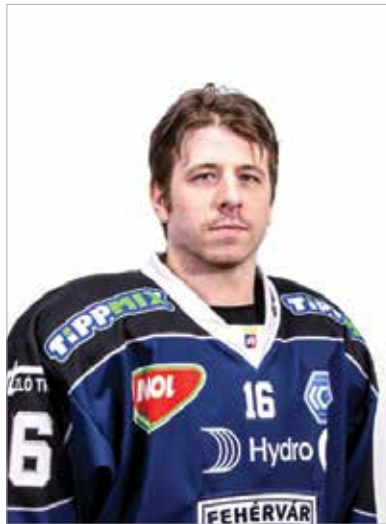
A kapitány eredményes szezont zárt

vagyok, gyorsan meg is tudtunk egyezni, így mindenki számára jó döntés született.