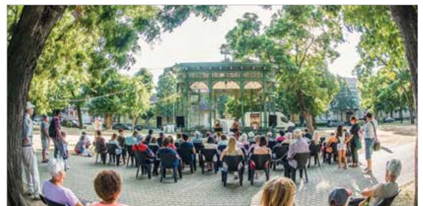
A programot a Red White csellóduó koncertje zárta a Zichy ligetben