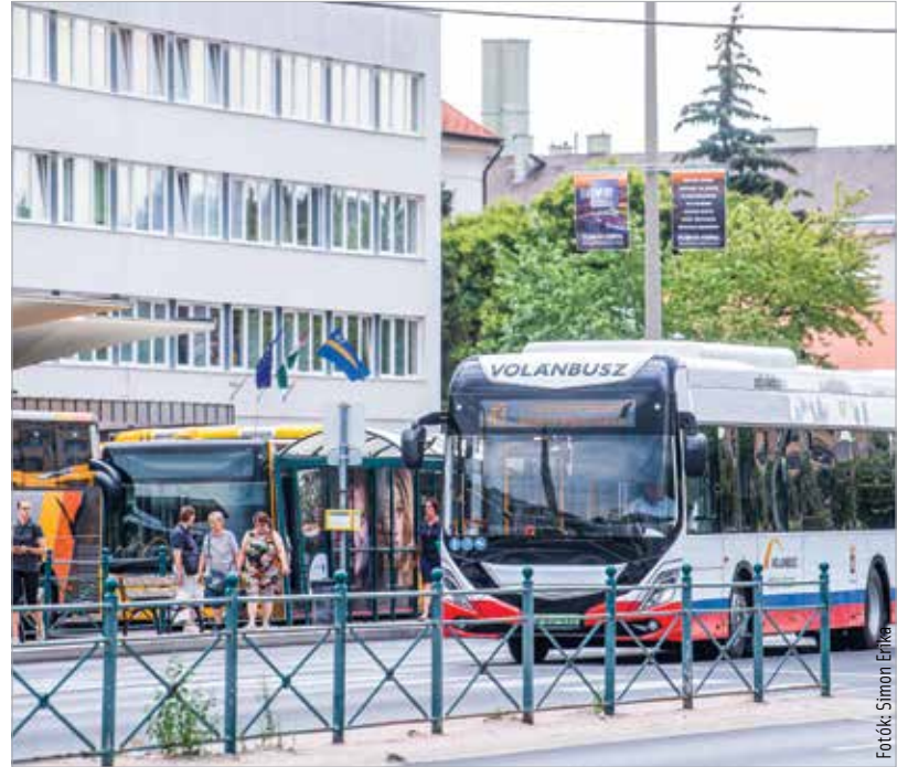
Szeptember végéig mind a tizenkét új elektromos busz forgalomba áll Székesfehérváron

A buszok Székesfehérváron, az Ikarus területén készülnek, és egyre több saját, fehérvári fejlesztés kerül bele a kínai alapba. A szoftver fejlesztése csak egy a helyi innovációk közül, de például a teljes ajtóvezérlést is Fehérváron fejlesztették a mérnökök, és növelték a jármű hatótávolságát is. A fejlesztések célja, hogy minél többet tudjanak egy töltéssel megtenni a buszok. Nemrégiben egy teszten háromszáznyolcvan kilométert tudott megtenni a jármű egyetlen töltéssel.