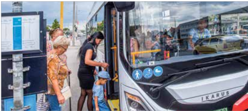
A korszerű, környezetbarát technológia a szolgáltatás színvonalát is emeli

A Volánbusz székesfehérvári telephelyén szerdán mutatták be az első két elektromos autóbust és a tizenkét járműre tervezett flottához kialakított töltőket.