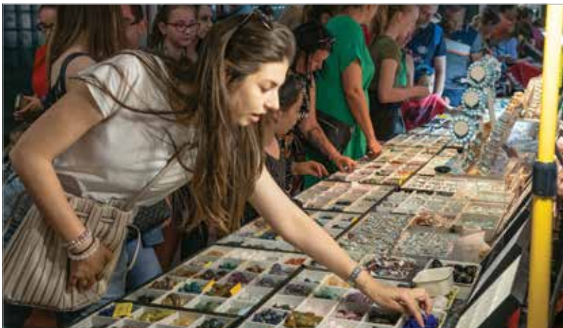
Több mint hatvan kiállító mutatta meg értékes kőveit, a belőlük készült tárgyakat, ékszereket pedig meg is vásárolhatták a látogatók