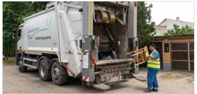
Hétfőn az Almássy-telepen parkolt a Depónia hulladékszállító autója, ide hozhatták a környéken lakók a lomtalanításra szánt hulladékot

„Mindenki tudja, hogy Székesfehérváron, a tömbházas övezetekben a lomtalanítás alkalmával milyen kaotikus és rendezetlen állapotok szoktak