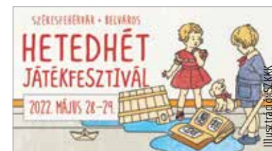
A Hetedhét Játékfesztivál programjai nemcsak színvonalasak, de ingyenesek is!