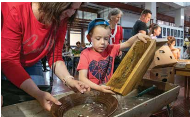
Az aranyért meg kell dolgozni! Ezt a legfiatalabbak is megtapasztalhatták a börzén.