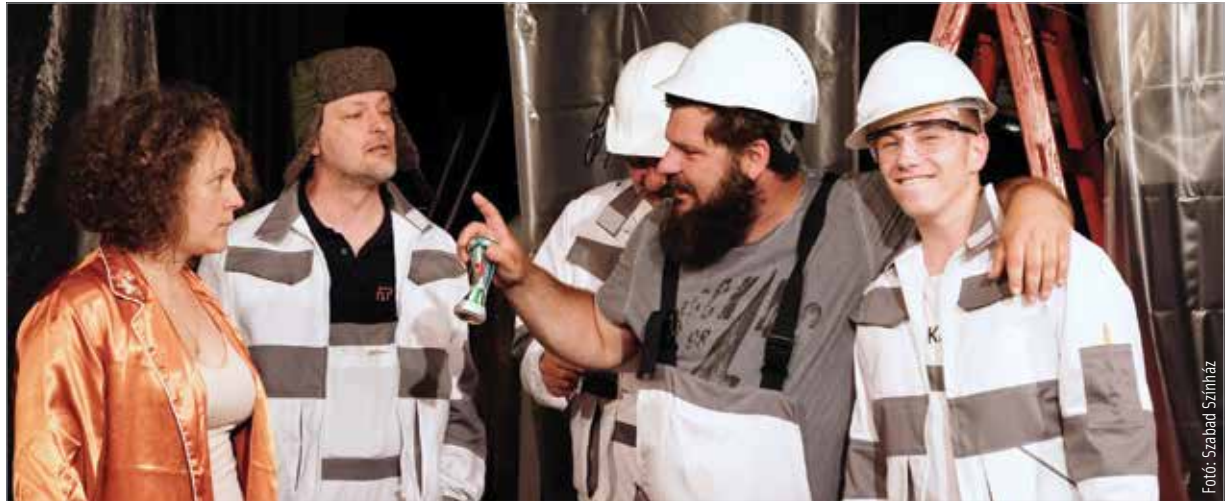
A mesteremberek legközelebb június elsején, szerdán este hétkor lépnek színre az Igézőben

A szomorú az, hogy egy percig sem érezzük az előadást fikciónak. Gyakorlatilag nyakig benne vagyunk a történetben, szinte már az első jelenettől kezdve. Szórakozásunkat a ráismerés is garantálja: az Igéző nézőterén abban a másfél órában csupa saját moziját néző embert láttam. Akik ha tán nem is felhőtlenül, de jókat kacagtak azon a rémálmon,