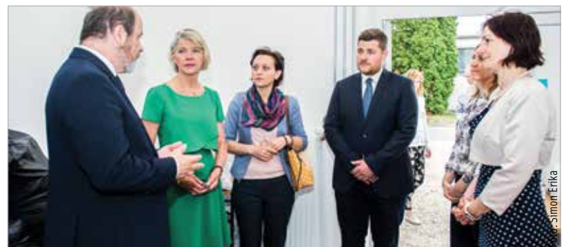
A nagykövet asszony az Alba Bástya Család- és Gyermekejélti Központba is ellátogatott

megszületett, hiszen fehérváriak is részt vesznek majd azon a tanulmányúton, melynek témája a holland kerékpáros infrastruktúra lesz. Így nem elképzelhetetlen, hogy holland mintára történjen majd a városban a jövőbeli fejlesztések. Ahogy Cser-Palkovics András fogalmazott: „Ebben a tekintetben Hollandia előttünk jár, de látszik az is, hogy Fehérváron is nő a kerékpárral közlekedők száma. Fel is hívták a figyelmünket, hogy az egyes szinteket elérve előjönnek problémák, amiket az ő tapasztalataikat figyelembe véve mi még elkerülhetünk, úgyhogy ez egy nagyon izgalmas együttműködési lehetőség!” A nagykövet asszony az Alba Bástya Család- és Gyermekejélti Központban is látogatást tett. Mint mondta, nagyon megható volt azt látni, mennyi segítőszándék van jelen Székesfehérváron, és milyen professzionálisan kezelik a kialakult helyzeteket.