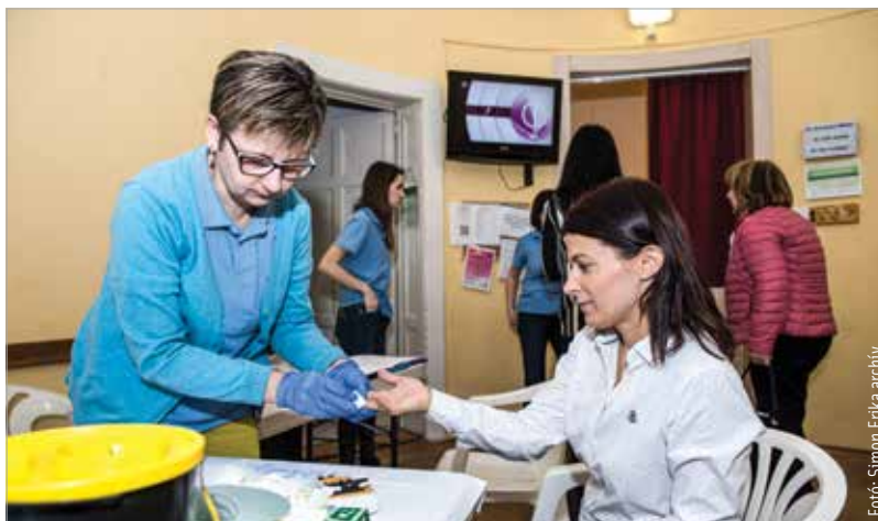
A fehérvári szűrőnapok mindig sokakat vonzanak

A szűrőnapoknak volt egy bejáratott rendszere, amit a járvány szétzilált: „A rendszer most újraindul, és ismét lesz lehetőség arra, hogy a nem járványos, nem fertőző,