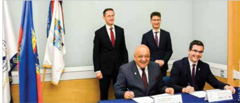
Székesfehérvár polgármestere a fehérvári felsőoktatás mérföldkövének nevezte a megállapodást

„Az elmúlt években a mi ajánlatunkkal sajnos nem tudtunk kiaknázni ekkora potenciált. Ezt a campust eredetileg hatszáz diákra terveztük, ezért egy nagyon önzetlen kérdést tehetünk fel magunknak: háromszáz diákkal valóban mi vagyunk ennek a campusnak a jó gazdája?” – a Budapesti Corvinus Egyetem elnöke, Anthony Radev ezekkel a szavakkal indokolta a szándéknyilatkozat aláírását az Óbudai Egyetemmel. Közösen nézik most át az oktatási tevékenységet, a képzéseket, és kidolgozzák a két egyetem és a város számára a legelőnyösebb együttműködési modellt. Ami biztos, hogy erős elméleti alapokon nyugvó, gyakorlat-orientált képzés lesz a campuson – az