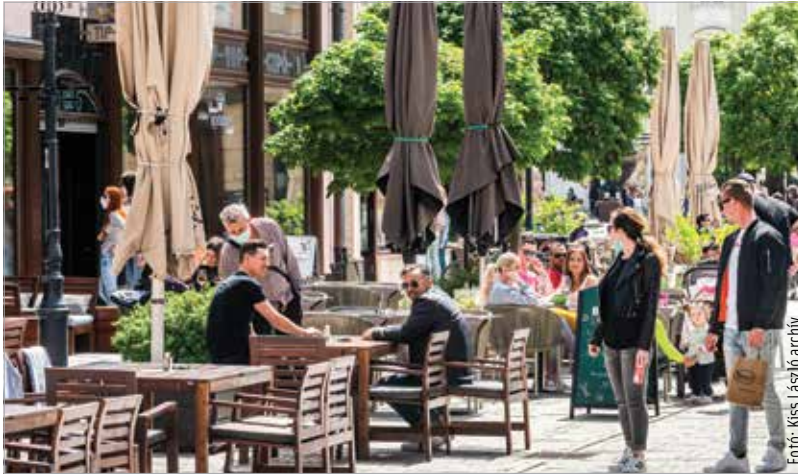
A teraszdíj elengedésének célja, hogy az önkormányzat segítse a vendéglátósokat anyagi helyzetük stabilizálásában

„Tekintettel arra, hogy az elmúlt két év járvány okozta gazdasági nehézségeinek többek között a vendéglátós szektor volt leginkább kitéve, szeretnénk segíteni e terület vállalkozóinak és munkavállalóinak teljes, tartós talpra állását.” – fogalmazott Cser-Palkovics András a közösségi oldalán megjelent bejegyzésében. A polgármester kifejtette, hogy 2022-ben is elengedi az önkormányzat a teraszdíjakat, abban a reményben, hogy a vendéglátósok számára ez segítség lesz az anyagi helyzetük stabilizálásában. – „Vendéglátóhelyek nélkül nincs turizmus, nincs élet a városban, tehát ez nemcsak gazdaságvédelmi, hanem stratégiai intézkedés is. Székesfehérvárnak és a fehérváriaknak szüksége van a vendéglátósokra!”