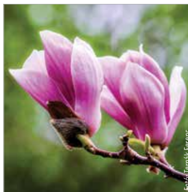
A magnólia a liliumfafélékhez tartozik. Tévesen tulipánfának is hívják, de az egy teljesen más növény, csak hasonlítanak egymáshoz.

Kontinensünkre a XVII. század második felében érkezett a liliumfa az angol misszionáriusok jóvoltából. John Banister 1688-ban küldte el a Magnolia virginiana töveit Virginiából Londonba. Ezt követte 1720-ban a Magnolia grandiflora, majd az ázsiai fajok. A Magnolia denudata volt az első mérsékelt övi ázsiai faj, ezt 1789-ben hozta be Joseph Banks. Ezt követte a piros változat (Magnolia liliiflora) 1790-ben. E kettő hibridje lett a nagyvirágú magnólia, amit 1820-ban kezdtek terjeszteni Franciaországban. A nemzetközi kereskedelemben 1852 után került be a növény – amerikai közvetítéssel. Magyarországra Eszterházy Miklós hozta be a XVIII. század végén. A herceg kismartoni parkját szerette volna színesíteni vele. Később a Kámoni Arborétumban is több példányt elültetett Saághy István.