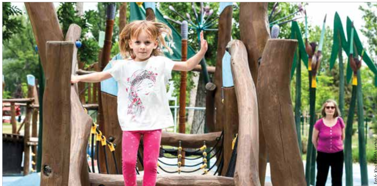
Már csak egy hónap, és kitör a vakáció!

Már csak egy hónap van az iskolai nyári szünet kezdetéig, ilyenkor hatalmas a tumultus a jelentkezéseknél. Azonfelül, hogy a legjobb ár-érték arányú turnusok nagyon gyorsan betelnek, az előbb említett árnövekedés folytatódhat, azaz nem garantálható, hogy egy vakációs program ma