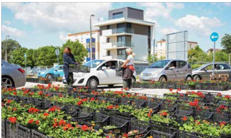
Idén minden eddiginél több, közel tízezer pályázat érkezett a Városgondnoksághoz

ták a csomagtartóba a virágokat. Sokan minden alkalommal élnek a lehetőséggel. Idén is rekordszámú, közel tízezer pályázat érkezett a Virágos Székesfehérvár programra, melynek keretében közel háromszázezer növényt, köztük muskátlit, napvirágot, büdöskét, begóniát, pistikét, továbbá hétszáz komposztládát is kiosztottak. Az önkormányzat több mint tíz éve rendezi meg az országosan is egyedülálló akciót, a cél pedig nem más, mint szebbé, gondozottabbá, színesebbé tenni Székesfehérvárt!