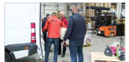
A Baptista Szeretetszolgálat a pákozdi logisztikai központban és a székesfehérvári, Tüzér utcai gyermekotthonban várja az adományokat hétköznap nyolctól négyig

Révész Szilvia hozzátette: sokan Kárpátalját már biztonságosnak találják, és ott várják a háború végét. Mint mondta, egyes információk szerint nyolcszáz ezer-egymillió belső menekült tartózkodik