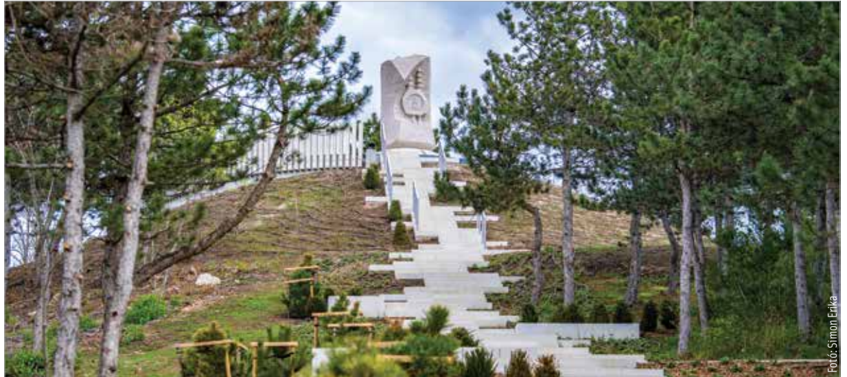
A fejlesztéseknek és a parkosításnak köszönhetően az Aranybulla-emlékmű ismét a kirándulók egyik kedvelt célpontja lehet!

A terület parkosítása során százötvenkét fát és több mint ötezer cserjét, valamint más növényt telepítettek, ami még impozansabbá teszi a környezete-