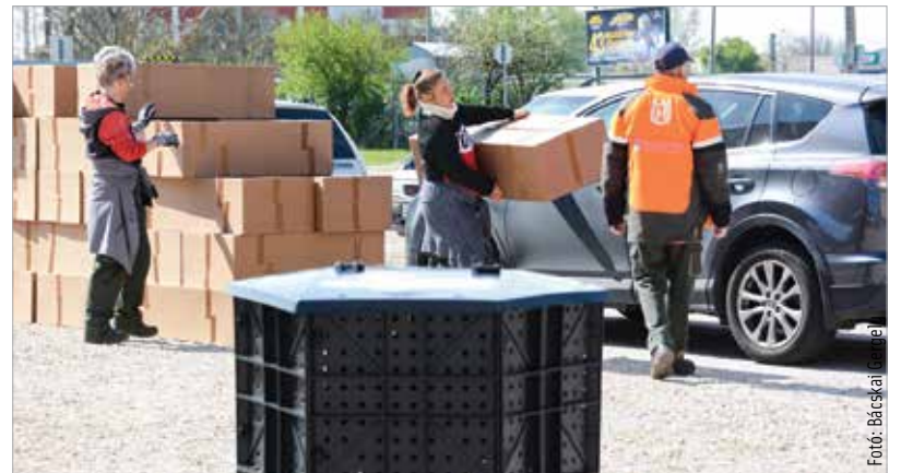
A komposztládákra tavaly ősszel, a Virágos Székesfehérvár program keretén belül lehetett pályázni. Idén is kora ősszel jelenik majd meg a pályázat.

A növénycsomagokat május 3. és 19. között osztják ki. Ehhez szakaszosan küldi ki a Városgondnokság az időpontfoglaló leveleket!