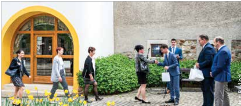
Immár sokéves hagyomány, hogy a ballagási hét keretében az Órajátéknál köszönti az önkormányzat a ballagó diákok osztályfőnökeit. A járvány okozta kétéves kihagyás után szerdán végre ismét összegyűlhetnek a pedagógusok és a diákok képviselői a Kossuth-udvarban.