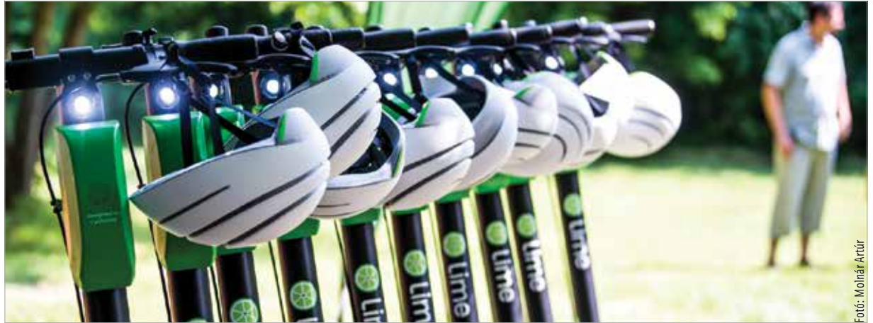
A bérelhető elektromos rollerek népszerűek Fehérváron, ezért tervezi a város vezetése a hasonló rendszerben bérelhető elektromos kerékpárok bevezetését is

A szövetség célja az is, hogy 2022-ben az elektromosautó-vezetés a járművezetői oktatás részévé váljon, országosan mindenütt elérhető legyenek az elektromosjármű-