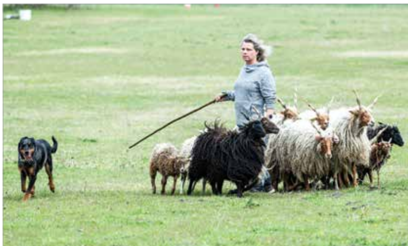
Nyolc országból ötvenegy kutya érkezett a terepversenyre