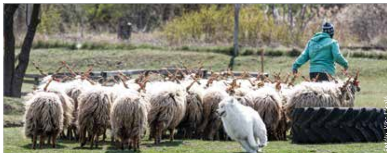
A látogatók a magyar fajták mellett találkozhattak tradicionális francia, belga és ausztrál terelőkutyaákkal

„A birkák ki vannak engedve, a kutyaáknak pedig különböző feladatokat kell teljesíteni: milyen irányba,