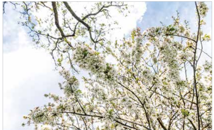
A virágok már készen állnak!

hiszen komoly feltételeknek kell megfelelniük a versenyen induló településeknek. Gyönyörű városokkal kell versenyeznie Székesfehérvárnak, ahol szintén magas szinten művelik a zöldterületek gondozását, de a Városgondnokság kertészcsapata maximálisan felkészült – a kiválasztott helyszínnek is bizonyítják ezt: „Június huszonegyedikén kerül sor az Entente Florale Europe verseny bejárására. Jelenleg zajlik a