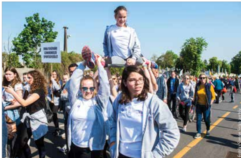
Három éve az eseményt nyitó felvonuláson több mint ötven sportegyesület vett részt, és közel kétezer sportoló vonult fel a Petőfi-szobortól a stadionig

Este pedig Király Viktor koncertjét, valamint Dj Kátai produkcióját láthatják-hallhatják majd az érdeklődők.