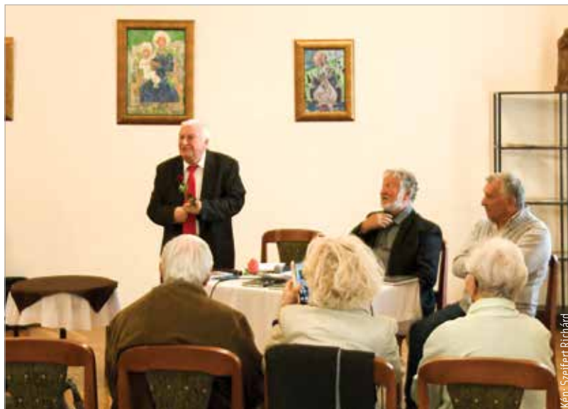
Balajthy Ferenc kivételes empátiával közelít az emberi sorsokhoz

szerető fehérváriakkal együtt. Balajthy Ferenc, a mindig mosolygós költő úgy fogalmazott: számára a sors adta tehetség mellett a mindennapok is ihletet nyújtanak. Verseiben ezért is találhatjuk meg a mindenség eredőjét, örömet, bánatot, vagyis mindazt, ami az embert emberré teszi. Balajthy Ferenc a kötetet gondolatébresztő sorokkal zárja. Kányádi Sándort idézve, illetve őt kiegészítve úgy fogalmaz: „A verset írni, mondani és szeretni kell!”