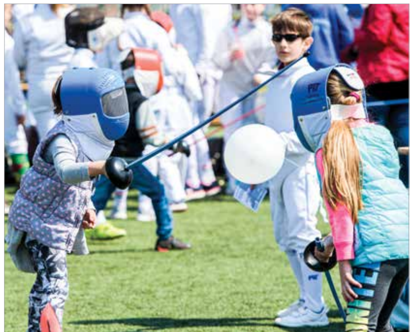
A sportegyesületeknek lehetőségük lesz egész napra kitelepülni és bemutatókat tartani a stadion körül, valamint a rendezvény színpadán, hogy a látogatók minél több sportággal ismerkedhessenek meg, a legnépszerűbbektől a legextrémebbekig

„Lesznek közös edzések olyan ismert sportolókkal, mint Katus At-