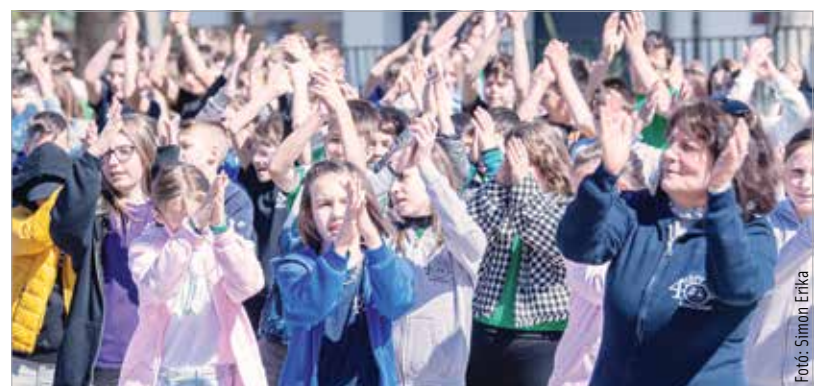
Az utóknak szóló üzenetekkel, zenés, mesés műsorral és közös énekkel, születésnapi tortával ünnepelték negyvenéves iskolájukat a Hétvezér diákjai, pedagógusai

Az ünnepélyes alkalom csúcspontját az idő kapszula elhelyezése jelentette, amit a tervek szerint legkorábban 2052-ben, azaz harminc év múlva bonthatnak majd fel a következő generációk tagjai.