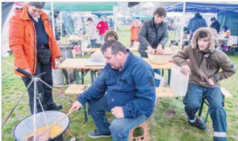
Az esős idő sem vette el a főzőcsapatok kedvét

pontyból, eredeti szegedi paprikából és bajai tésztából készült levesből idén is nagyon sokan falatozhattak.