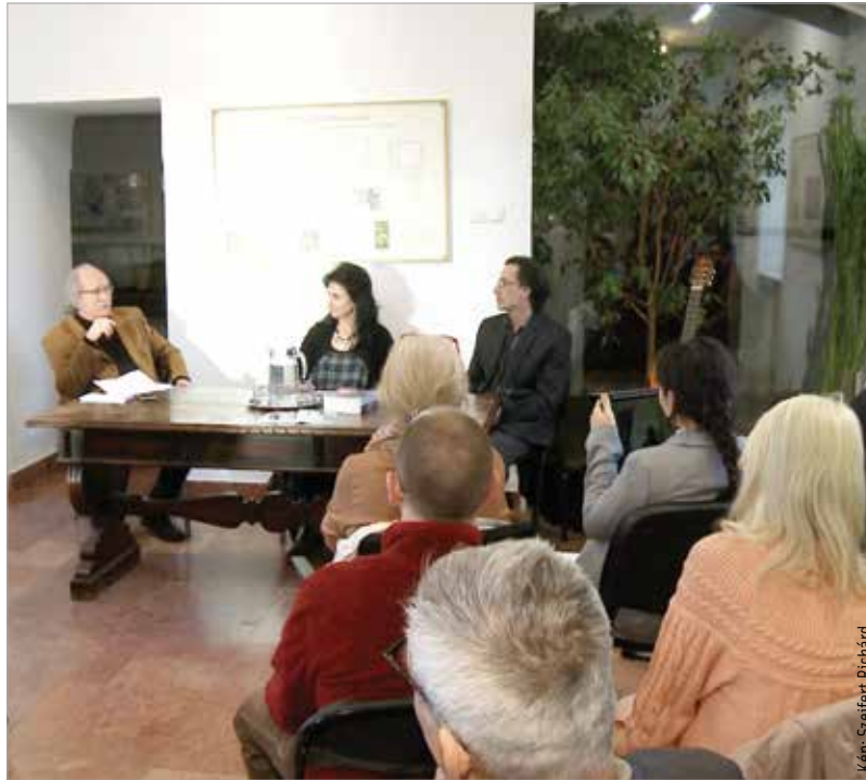
Telt ház fogadta az újraindult irodalmi estét a Királykúton