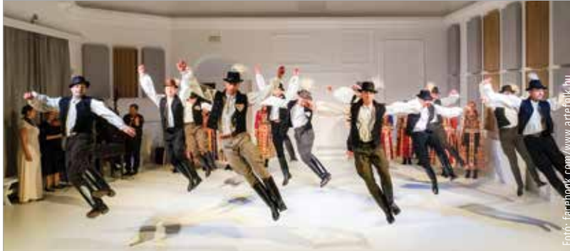
Húsvétvasárnap is várják a Táncházba a ropni vágyókat!