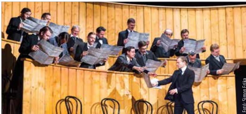
Április huszadikán Székesfehérváron, huszonhatodikán pedig a budapesti József Attila Színházban láthatjuk a Trianont. Mindkét előadás este hétkor kezdődik.

kontra. Hiszen nézőként valóban egy tárgyaláson vagyunk: van védő, ügyész, tanúk. És persze jelen vannak a nagy háború utáni világpolitika képviselői, akik a széljártástól függően hol erre, hol arra teszik le a voksukat. Az előadás nem ítél, nem ítélezik, nem dönt, nem akar befolyásolni, érzelmeket felkorpácsolni. Tényeket mutat be, párbeszédre sarkall egy olyan megosztó kérdésben, ami – ha tetszik, ha nem – a magyar történelem része marad.