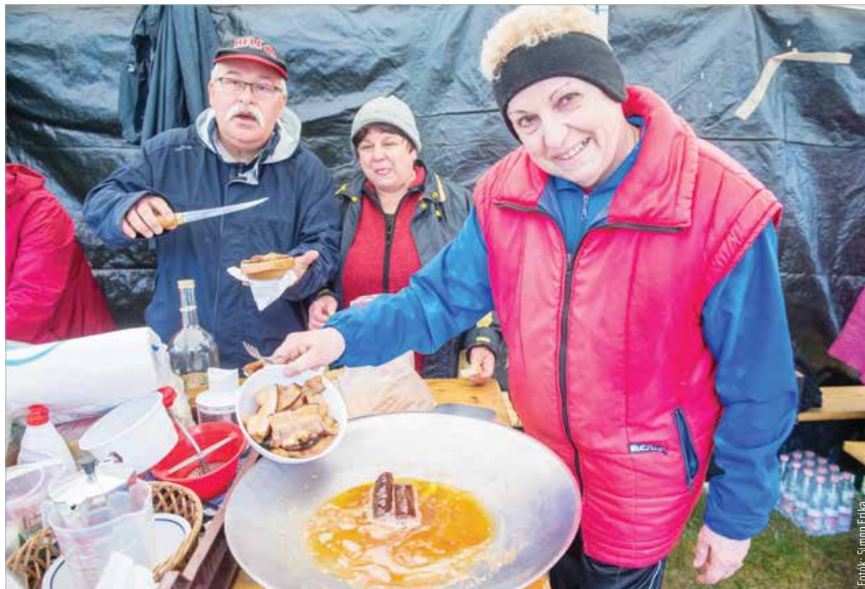
Hagyomány, tehetség, minőségi alapanyag és szeretet: ha ezek megvannak, biztos, hogy rendkívüli finomságok kerülnek ki a mesterek keze alól!