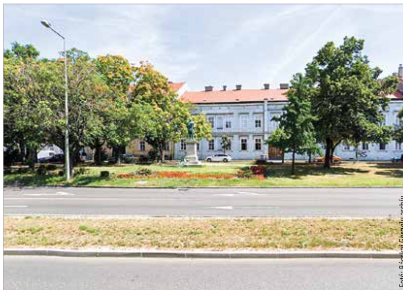
A park egész területét újrafüvesítik, és automata öntözőrendszert építenek ki

A park felújítása során a belső korhadástól rossz állapotban