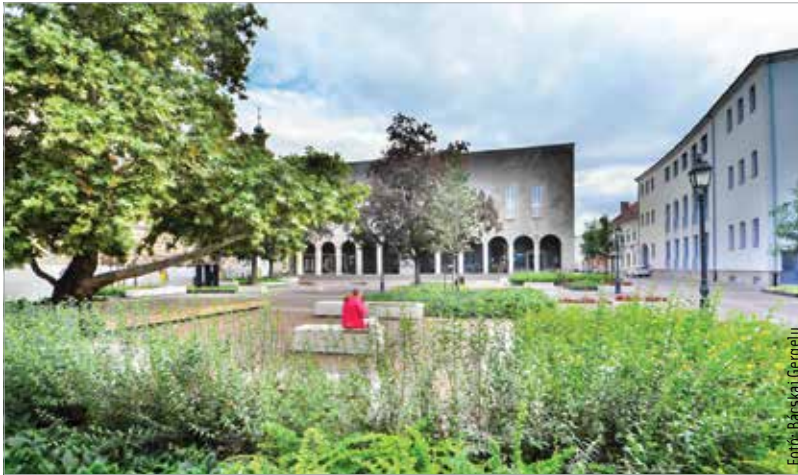
A munkák befejezése június végére várható. A lezárt területre érvényes behajtási engedélyeket a környező utcákban is elfogadják.

séges megjelenést ölthet, és igazi közösségi térként funkcionálhat. A burkolatépítéshez kapcsolódóan az Oskola utcában a forgalmi rend is megváltozott. A gépjármű-forgalom elől lezárásra került az Oskola utca Ady Endre utca és Szent János köz közötti, Bartók Béla térrel határolt szakasza. Az építési munkálatok időtartama alatt az Oskola utca az Ady Endre utca–Jókai utca–Városház tér útvonalon, a Hiemer-ház előtti útszakasz igénybevételeivel közelíthető meg, és hagyható el az ellenkező irányban.