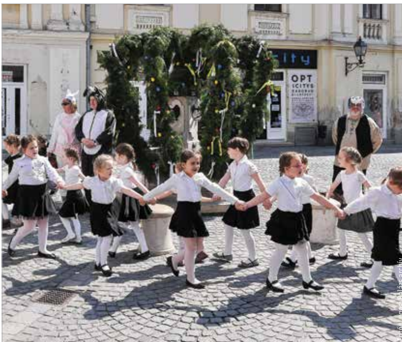
Három éve így avatták fel a kutat a belvárosban

ban ivókútként is szolgál. Szép hagyomány, hogy minden év tavaszán ünnepi díszbe öltöztetik a kutat. Így lesz ez idén is: a tojásfutó ünnepélyes átadására április tizenkettedikén, kedden délután fél kettőkor kerül sor. A műsorban felsővárosi óvodások szerepelnek, tekerőlantok közreműködik Varró János népzeneész.