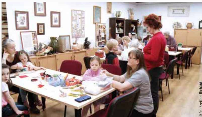
Kicsik és nagyok ismerhették meg a kézművesség rejtelmét

Ezen a napon az alkotóházak, műhelygalériák, nyitott műhelyek, kézművességgel foglalkozó egyesületek és közösségek helyszínei, műhelyei olyan egyedi programokkal jelentkeztek, melyekben a helyi területi népi kézművesség, a népművészet hagyományai és értékei, a népművészek alkotásai jelentek meg.