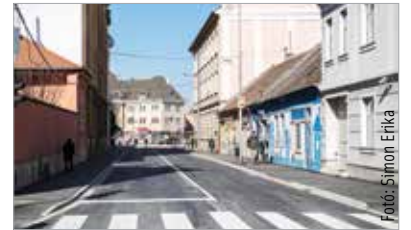
A közműveket is kicserélték, így remélhetőleg sokáig élvezhetjük az új útburkolatot!

A jelzett útszakaszt pénteken tehát ismét megnyitják a forgalom előtt, április 9-én, szombaton üzemkezdettől pedig a helyi és regionális járatok is újra az eredeti járatútvonalon közlekednek. Ez alól kivétel a 35-ös, a Vasútállomás irányába közlekedő 33-as, valamint a Fecskepart irányába közlekedő 34-es jelzésű autóbuszjárat, melyek továbbra is a Rákóczi út–József Attila utca–Deák Ferenc utca terelőútvonalon járnak, és a terelőútvonalon rendszeresített megállóhelyeken állnak meg. Kimaradó megállóhelyek: Zsuzsanna-forrás, Prohászka Ottokár út, valamint a Prohászka Ottokár-templom.