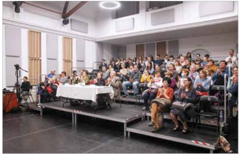
Megtelt a Táncház, a zsűri mellett meghatódott hozzátartozók hallgatták a szép dalokat

A hagyományoktól eltérően ebben az évben nem minősítették a kóru-