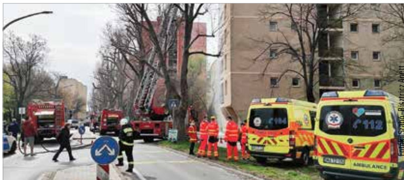
Egy társasház nyolcadik emeleti lakása égett Székesfehérváron, a Lövölde utcában

Kedden kigyulladt egy lakás a Lövölde úton. A tűzoltók nagy erővel, egy magasból mentő létrával, három fecskendővel vonultak a helyszínre. Kívülről és bentől egyaránt küzdöttek a lángokkal, és közben arra is figyeltek, hogy senki ne legyen az épületben.