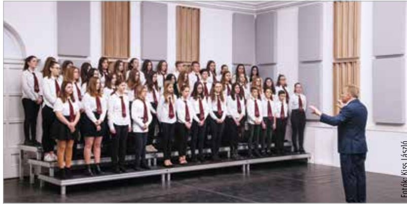
Közel ötszáz diák vett részt a hangversenyen