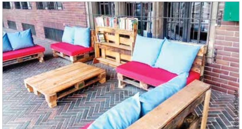
A hangulatos szellemi oázis nyitvatartási időben várja az olvasókat