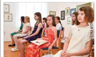
A pályázatról további részletek olvashatók a Gárdonyi Géza Művelődési Ház közösségi oldalán

A pályázaton 2007. január 1-je és 2013. december 31-e között született gyerekek vehetnek részt magyar nyelven írt történettel, melynek terjedelme maximum hater karakter lehet. A Word-dokumentumként szerkesztett szövegben tizenkettes méretű Times New Roman betűtípust és másfeles sorközt kell használni, a témát illetően azonban nincs megkötés. A meséket csatolmányként kéri elküldeni a tunderszopalyazat@gmail.com e-mail-címre április tizedikéig. Az eredményhirdetést és a díjátadót június negyedikén rendezik meg a Székesfehérvári Népmeseponton.