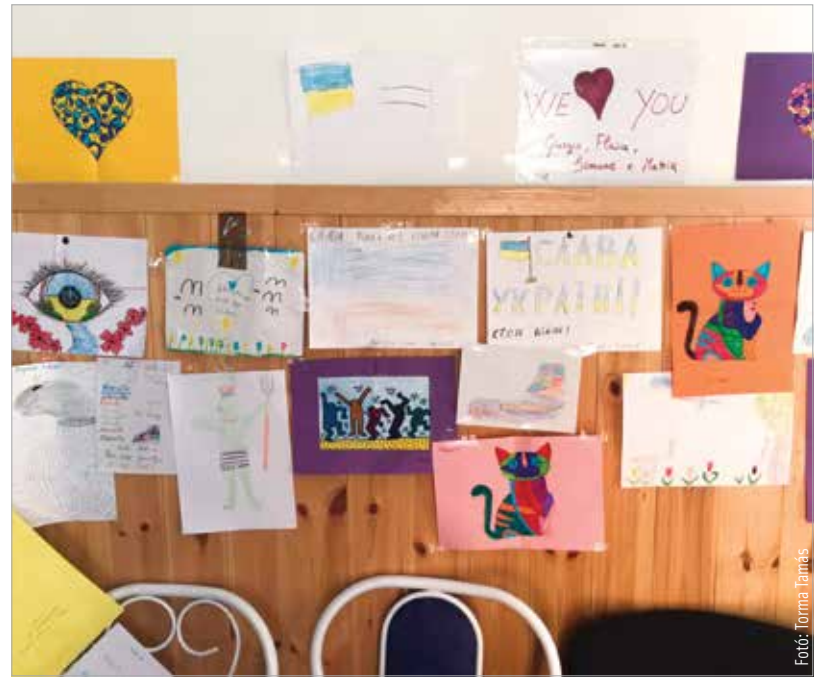
Menekült gyerekek rajzai a barabási segítőponton