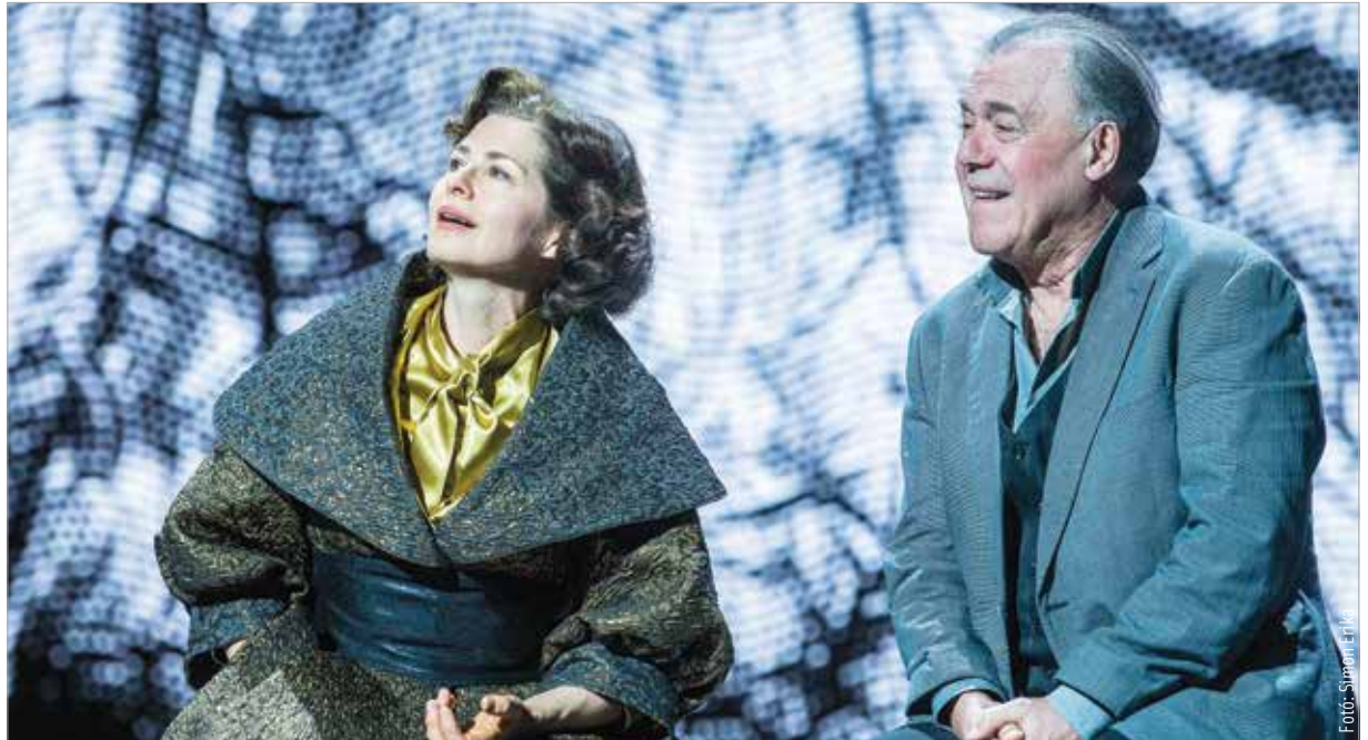
A régmúltban még minden szép volt...