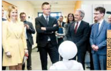
Az ünnepség résztvevői megismerhették, milyen fejlődésen ment át az informatika az elmúlt huszonöt évben

Nagy szerepe van a szolgáltatászektorban Magyarországon. Nagymértékben köszönhető ennek a nemzetgazdasági ágának, hogy gazdaságilag rekordév lett 2021 – hangsúlyozta Szijjártó Péter külügyminiszter az évfordulós emléktábla avatóünnepségén: „Százötvenhat szolgáltatóközpont működik ma Magyarországon, összesen hetvenezer embernek adnak munkát. Ha öt éves időtávlatban nézzük, ez azt jelenti, hogy ötvenhárom százalékkal nőtt az ágazatban foglalkoztatottak létszáma. Ezért aztán