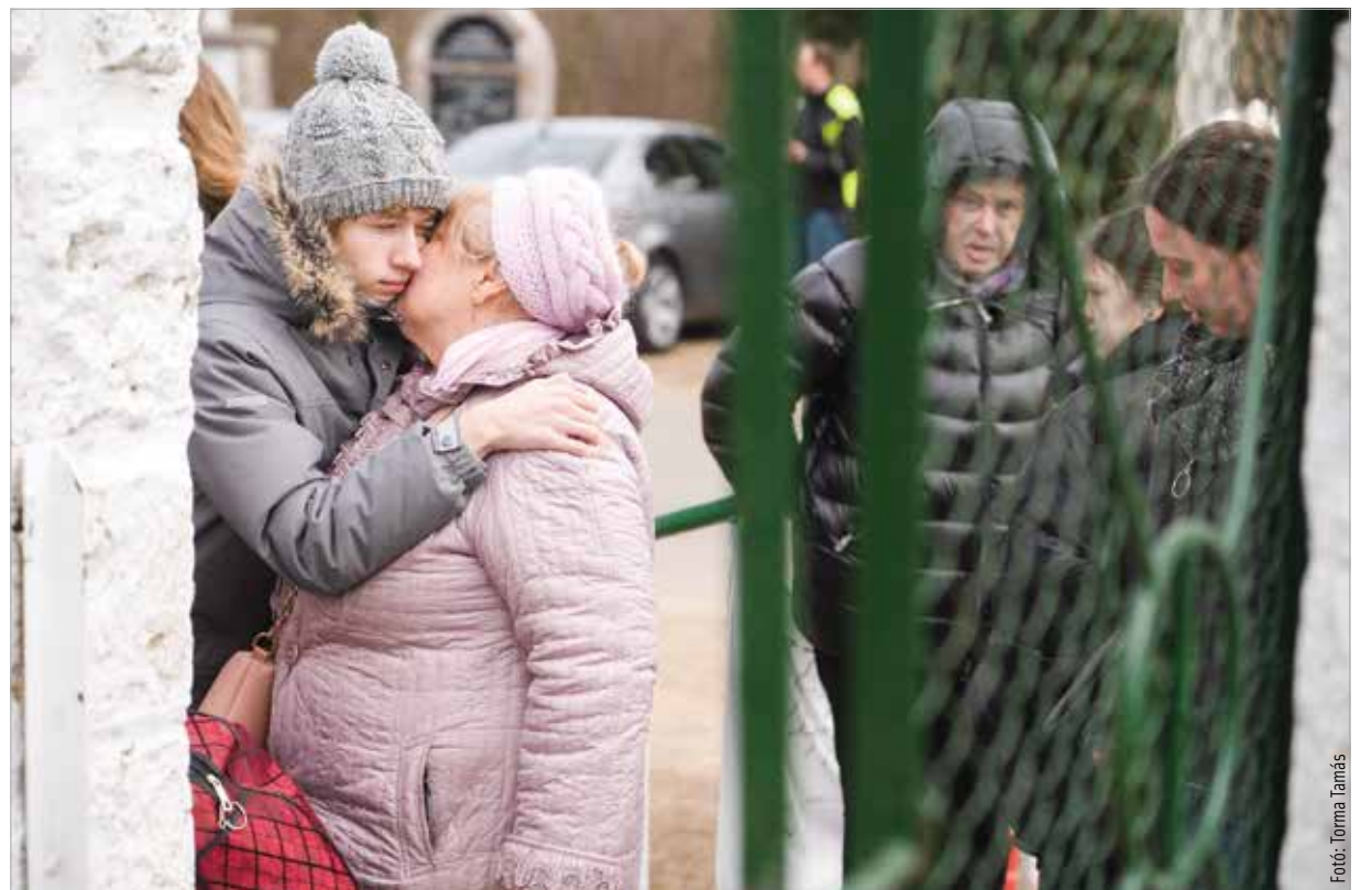
Találkozás a határnál

emberi oldal fogta meg: „Néztem a képeket, a videókat, és olyan tekinteteket láttam, amit valószínűleg a tükörben is láttam volna, ha én lettem volna ilyen helyzetben. Kettős érzés volt hazajönni: lelkileg nagyon megterhelő volt ez az egy hét, ugyanakkor örülök, hogy tudtam segíteni, és ez valamennyire feltöltött. Amikor visszaértünk Fehérvárra, befelé jövet elhajtottunk a Halesz mellett, a lakóházak mellett, és az volt a fejemben, hogy ezek az épületek még állnak! Beléptem az otthonomba, ami nem túl nagy, nem is túl gazdag, de mégiscsak az enyém. A biztonságot jelenti számomra, és közben tudom, hogy ezt mennyien elvesztették odakint!”