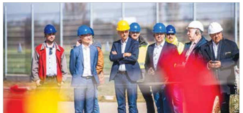
Az új létesítmény javítja az energiaellátás biztonságát

A polgármester hozzátette: a város déli részén az önkormányzat új, a fenntarthatóság jegyében épülő városrész kialakítását tervezi. A bővített állomásnak jelentős szerepe lesz ezen új városrész mellett a Velencei-tó és a megye déli részének áramellátásában is.