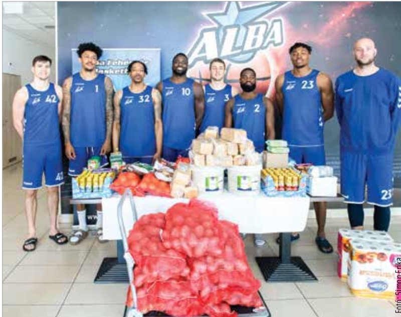
A fehérvári kosarasok is rengeteg adományt gyűjtöttek

a menekültek. A háború kitörése után két héttel érkeztek Odesszából és Kijevből nők és gyerekek. Jelenleg is laknak menekültek a kollégiumban, kilencen vannak, édesanyák, egy-két gyermekkel. „Az az érdekes, hogy Ukrajnában folyik a tanítás, és ezek a gyerekek online kapcsolódnak be. Biztosít szá-