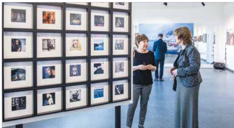
A Nánási-kiállításon különleges kompozíciókat láthatott a közönség

Megújult az épület földszintjének elektromos hálózata, gépészeti és építészeti átalakításon ment keresztül a földszinti férfi mosdó és a büfé, valamint – a színházterem kivételével – megújult a földszinti helyiségek padló- és falburkolata, mennyezete is. A büfé átalakításával, az új bútorokkal és lámpatestekkel tágasabb, barátságosabb lett a földszinti előtér. A színházterem előtt kialakítottak egy ruhatárat, a kiállítótermekben