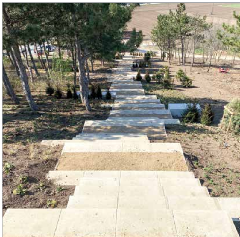
A meredek domboldalt lépcsőkkel tették járhatóvá

és bizonyos Volánbusz-jegyek tíz városban: Békéscsabán, Egerben, Nagykanizsán, Nyíregyházán, Pápán, Siófokon, Székesfehérváron, Szolnokon, Várpalotán és Zalaegerszegen. A szolgáltató közleményében kiemelte: a közlekedési társaság folyamatos fejlesztéseinek hosszú távú célja, hogy az utasok egységes felületen, egyszerűbben tudják megváltani menetvjegyeiket és bérleteiket – legyen szó akár buszos, akár vasúti, helyi vagy helyközi utazásról.