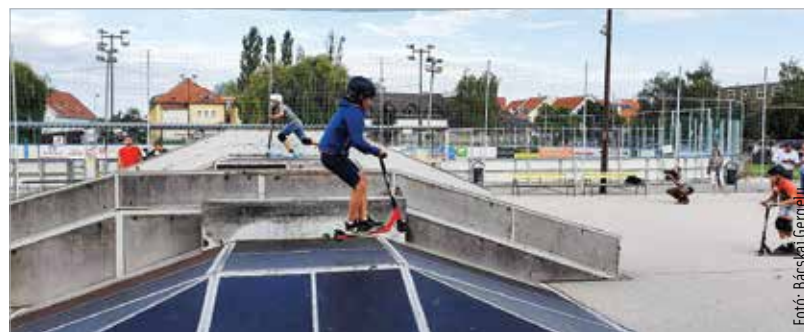
A pályán a sisak kötelező, és erősen ajánlottak a különböző védőfelszerelések is!

A görkorcsolya- és a BMX-pályára új, impregnált, csúszásmentesített lemezeket építettek be. Elvégezték a szerkezet statikai megerősítését is. A felújítás mintegy hárommillió forintba került. A belépők ára azonban nem változott.