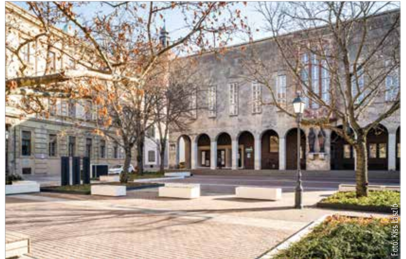
Kedvező kormánydöntés esetén a múzeum felújításából megmaradt összegből rendbe tennék a Bartók Béla téri épület homlokzatát, a bejárati lépcsőjét, de még a nyílászárók cseréjére is futná

A város polgármestere hétfő délutáni bejegyzésében úgy fogalmazott, hogy a szóban forgó kétszázharmincmillió forintot a Vörösmarty Mihály Könyvtár Bartók Béla téri épületének főhomlokzatára, a bejárati lépcső felújítására és a tetőszerkezet javítására költenék. Kedvező kormánydöntés esetén a pénzből jutna ezen felül még a könyvtár térre néző, főhomlokzati nyílászáróinak felújítására vagy cseréjére is.