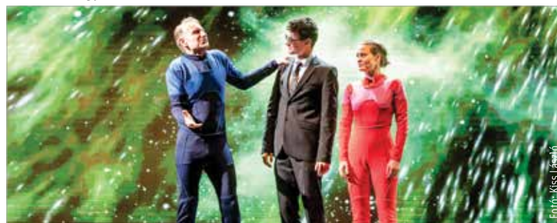
Az ember tragédiája 2.0 online is megtekinthető az eSzínház műsorán