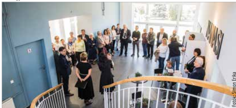
A Fanta-villa néven ismert, mintegy hetvenéves kultúrház esztétikai és műszaki renoválása, átalakítása januárban kezdődött, és a napokban fejeződött be. A földszinti rész megszépült, és vonzó közösségi téré alakult.