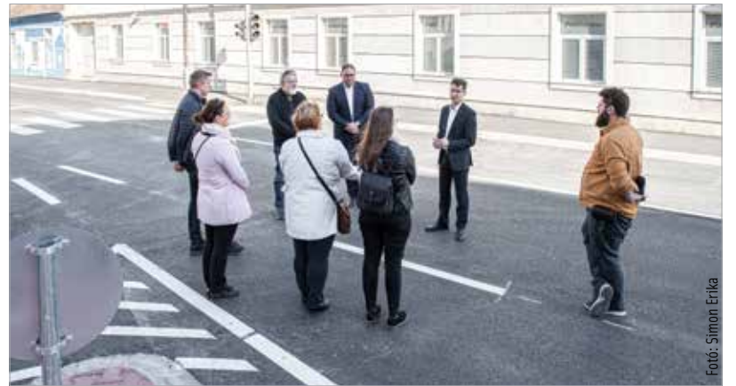
Cser-Palkovics András polgármester kiemelte: megérte a várakozás, hiszen mind a Budai út, mind a Prohászka út teljes egészében, a közművekkel együtt újult meg, így remélhetőleg hosszú ideig nem kell hozzájuk nyúlni

A nagyszabású fejlesztés során kicserélték az út- és járdaburkolatot, valamint kiszélesítették a belvárosi főút járdát. A Budai út már elkészült, a Prohászka úton még dolgoznak a szakemberek. A műszaki átadás április nyolcadikán várható.