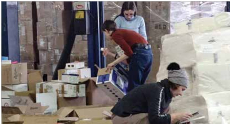
Önkéntesek válogatják a segélyszállítmányt

Kárpátaljára is kerül majd az adományból. A segélyakció lebonyolításának egyik felelőse a Magyar Ökumenikus Segélyszervezet, de az ungvári konzulátus minden munkatársa segíti a szállítmányok eljuttatását azokhoz, akik rászorulnak.