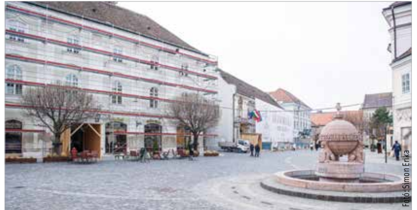
A kivitelezés az év végére készülhet el, ezzel a város főterének megújítása teljessé válik