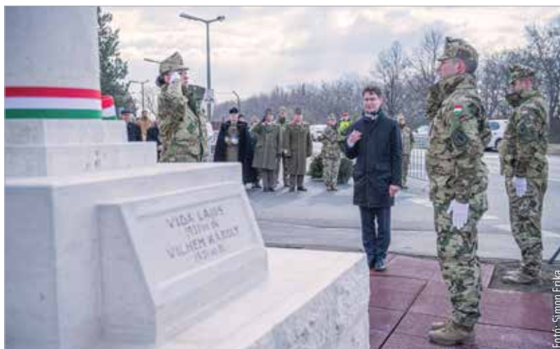
Az avatóünnepség koszorúzással ért véget