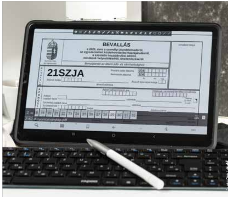
A NAV öt és fél millió adózónak készítette el az szja-bevallás tervezetét

Február tizennegyedikéig több mint hatszázötvenmilliárd forintot kaptak kézhez a családok. Most azokon a sor, akik az adóból