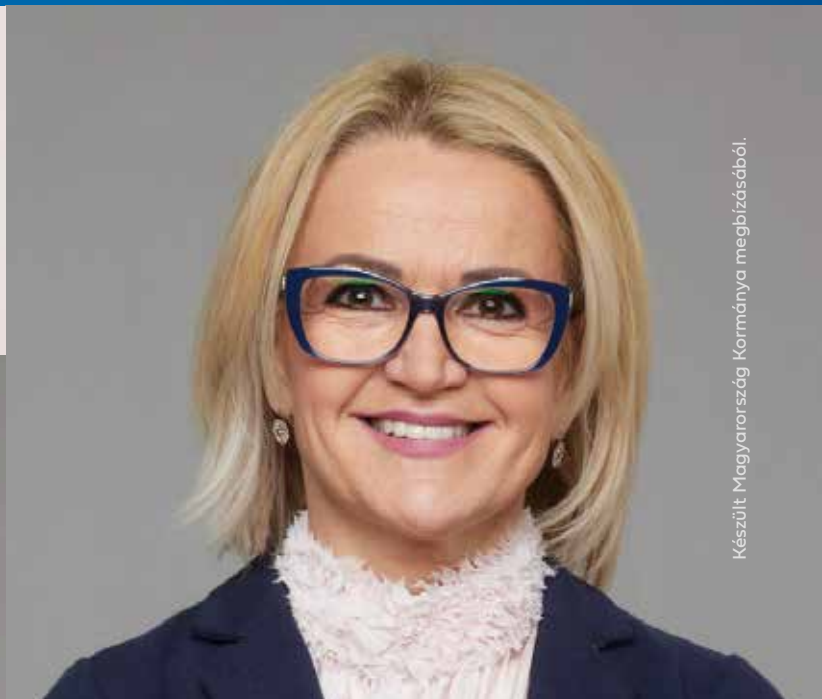
Készült Magyarország Kormánya megbízásából.