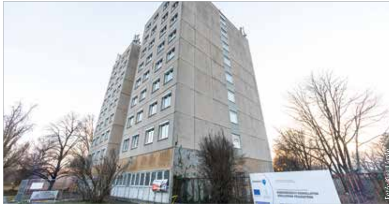
A Kikindai úti oltóponton is fel lehet venni a koronavírus elleni oltást

Az oltási akció ezen a hétvégén, vagyis pénteken délután és szombaton is folytatódik: ismét előzetes időpontfoglalás nélkül lehet menni oltásra a kórházi oltópontokra és a kijelölt járásközponti szakrendelőkhöz. A központi oltópontokon továbbra is öt vakcina közül lehet választani. Az akciónapokon a tizenkét év feletti korosztályt várják az oltópontokon. Az öt és tizenegy év közötti gyermekek oltása továbbra is csak előzetes időpontfoglalással lehetséges a kórházi oltópontokon vagy a házi gyermekorvosoknál. Izrael közben – elsőként a világon – elkezdte a negyedik oltást, mely az első tesztek alapján ötszörösére növeli az emberi szervezetben az antitestek