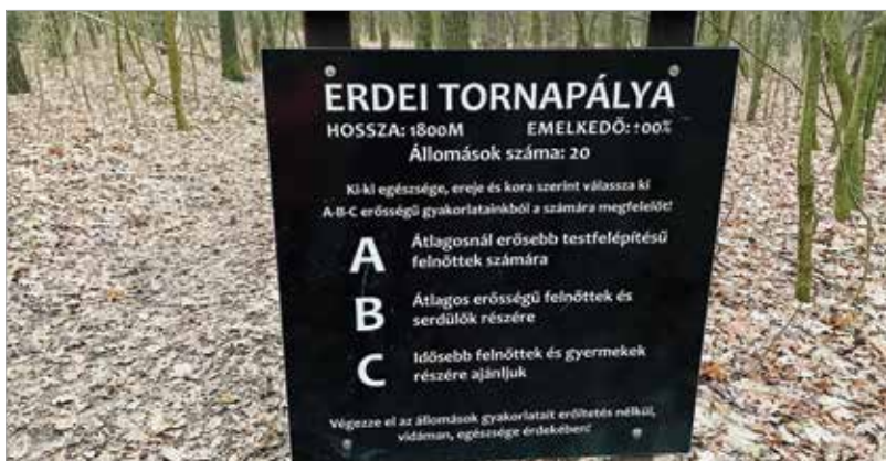
Nem lehet eltévedni, hiszen tájékoztató és ismeretterjesztő táblák jelzik, hogy hol és mi vár ránk