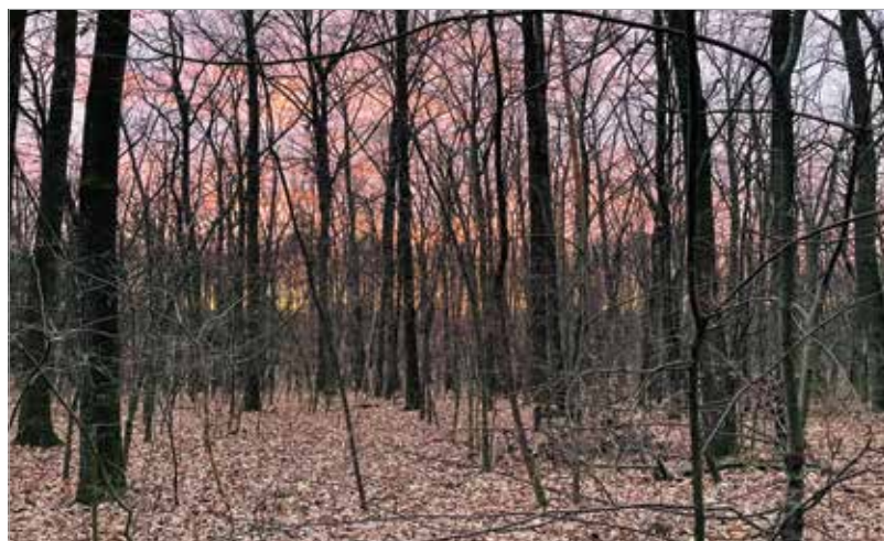
Mindig jó felkeresni a pentele parkerdőt!

Biztos sokaknak vannak emlékei Sárpenteletről, hiszen rengetegen jártunk oda az iskolai kirándulások alkalmával is. Többször voltam általános iskolásként, aztán középiskolásként is a parkerdőben. Nemcsak bebarangoltuk a tornapályát, de teljesítettük is a gyakorlatokat. Volt, hogy egész nap fociztunk, számháborúztunk, közösen bográcoztunk. Sok év kihagyás után nyolc-tíz éve fedeztem fel újra a parkerdőt. Azért is szeretek oda járni, mert ha csak egy óránk van, ott akkor is tartalmasan el tudjuk tölteni az időt. Mindig találunk valami új dolgot, érdekességet