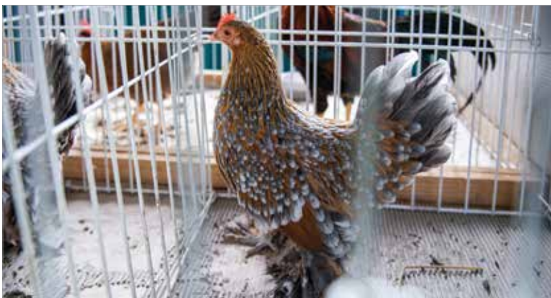
A tradicionális baromfifajták tenyésztése is népszerű hazánkban