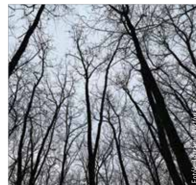
Érdemes néha letérni a járt utakraól, és felfedezni az erdő rejtett zugait!

1945 után az erdők közé zárt mezőgazdasági földek betelepítésével százötven hektárnyi új fiatalos nőtt a területre. Az erdő harmada középkorú, csak kis hányada idős állomány, többnyire tölgy, illetve fenyő, kisebb része akác és egyéb lombos fafaj. Egységét nádas, szántó, gyümölcsös, szőlő bontja meg – olvasható a fenntartó Vadex oldalán.