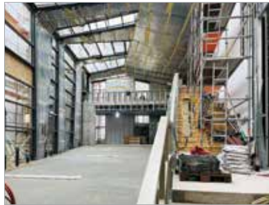
A gazdasági udvart beépítik, ott jön létre az új előcsarnok, a fogadóter

Még több fotóért és érdekességért keressék fel az fmc.hu oldalt!