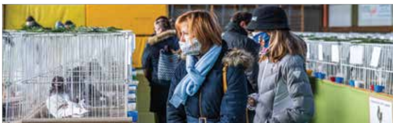
A város apraja-nagyja kíváncsi volt a színvonalas felhozatalra