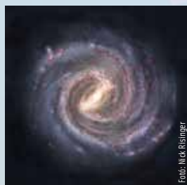
2022. jan. 13. – jan. 19.