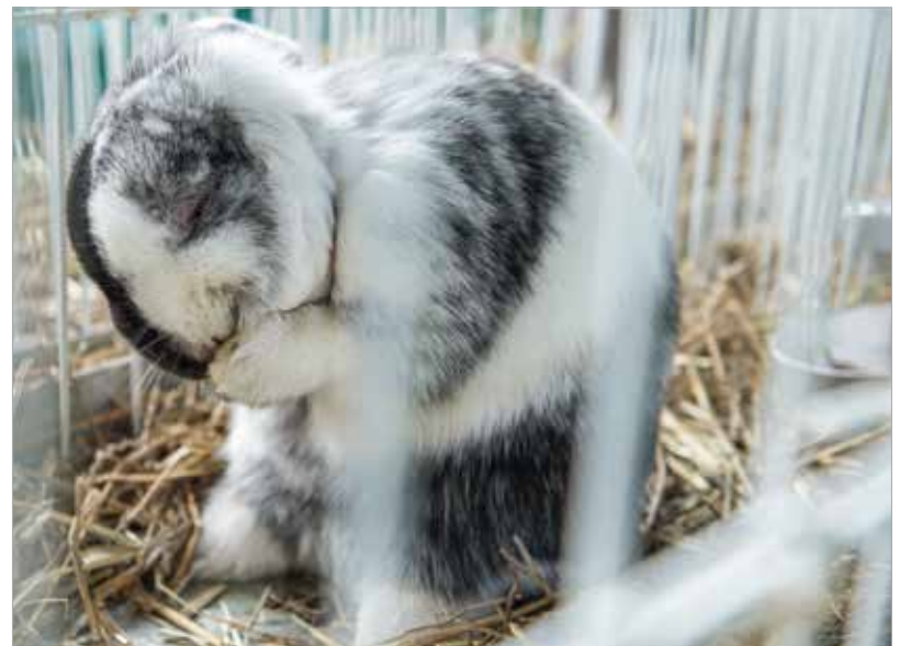
A magyarországi nyúltenyésztők is elhozták a különleges fajtákat Székesfehérvárra