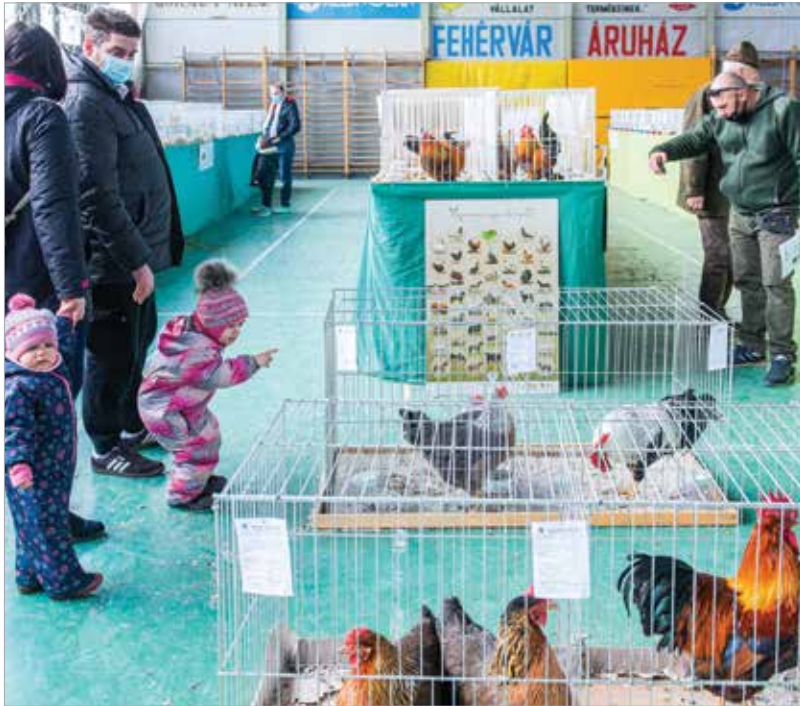
A családok számára is nagy élményt jelentett a kiállítás

A V-61 Alba Regia Galamb- és Kisállattenyésztők Egyesülete idén is a Volán-csarnokban rendezte meg hagyományos kiállítását, melynek keretében hetven fajta kisállat mintegy ötszáz példányát, díszmadarakat, egzotikus madarakat, díszbaromfiakat, különleges galambokat, illetve nyulakat tekinthettek meg a látogatók.