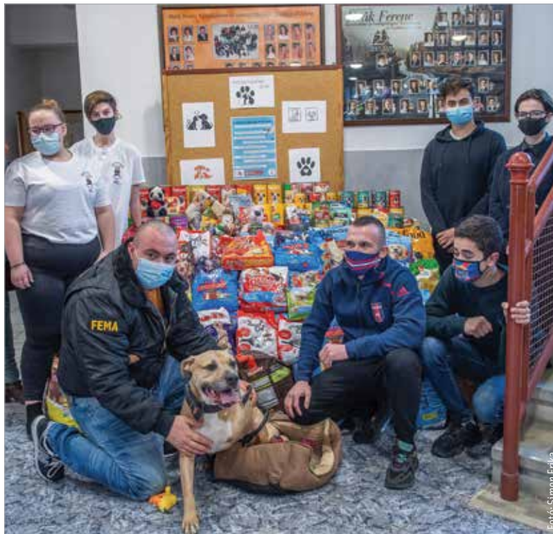
Októberben újraindította Staféta elnevezésű programját a Székesfehérvári Diáktanács. Az akció keretében hetente más és más fehérvári iskola gyűjt az ASKA, a HEROSZ, illetve a FEMA által működtetett menhelyeknek.

Boyka kutyával, a háromlábú pitbullal érkeztek a FEMA munkatársai, hogy a Deák Ferenc Technikumban átvegyék az adományokat. A mintegy kétszáz kiló száraztápot és közel száz konzervet ezúttal a FEMA állatmentői kapták, akik szándékosan olyan kutyával érkeztek, amelynek története minden előítéletet eloszlat. Példája annak, hogy egy harci kutya is lehet áldozat. Boykát egy kiképzőhelyről mentették, ahol verre menő harcra tanították az ebeket. Őt azonban nem tudták rávevni a támadó magatartásra, így a többi kutya rajta gyakorolt. Így vesztette el a lábát. Kedves, barátságos, szelíd kutya, aki százötven ebttársával és hatvan macskával él a FEMA menhelyén. „Egy évben tizenöt tonna állat-éledelet fogy el a telephelyünkön, így