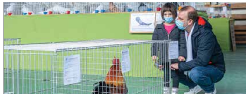
Fontos, hogy a gyermekek is megismerkedjenek a haszonállatokkal!