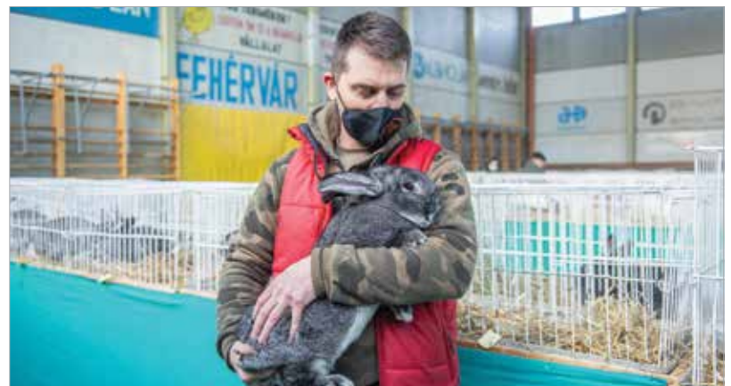
Az óriásnyulak nagy népszerűségnek örvendtek