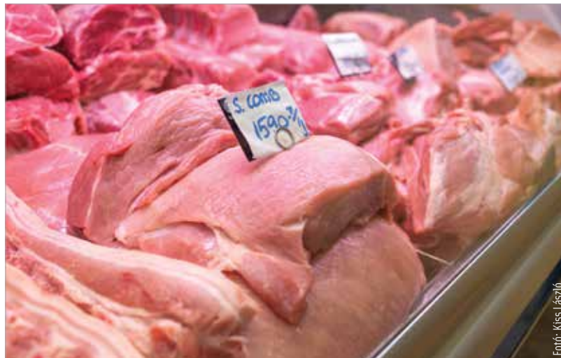
Az árstopot február elsejétől minden üzlet köteles betartani – jelentette be a miniszterelnök

„Ma úgy döntöttünk, hogy hat termék – a kristálycukor, a búza-finomliszt, a napraforgó-étolaj, a sertéscomb, a csirkemell és a 2,8 százalékos tehéntej esetében beavatkozunk az árak alakulásába. Ez azt jelenti, hogy ennek a hat terméknek az árát vissza kell vinni arra a szintre, ahol a tavalyi év október tizenötödikén állt. Ez minden üzletben meg kell, hogy történjen, február elsejétől kezdődően.” – mondta el a kormányfő.