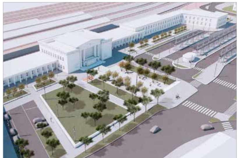
Új buszpályaudvar, parkolóház, felszíni parkoló, körforgalmak, kerékpárutak – ezek csak a főbb elemei a székesfehérvári vasútállomás intermodális átszállókapcsolatait fejlesztő óriásberuházásnak

célját. A tervezési és kivitelezési feladatokra nemrég írt ki ajánlattételi felhívást a NIF, vagyis a Nemzeti Infrastruktúra-fejlesztő Zrt. A fejlesztéssel Székesfehérváron nemcsak a vasút, valamint a helyi és a helyközi autóbuszok új találkozási pontja valósul meg, hanem a kerékpáros és a közúti közlekedés is fejlődni fog. A projekt Székesfehérvár és az egész megye közösségi közlekedését emelheti új szintre.