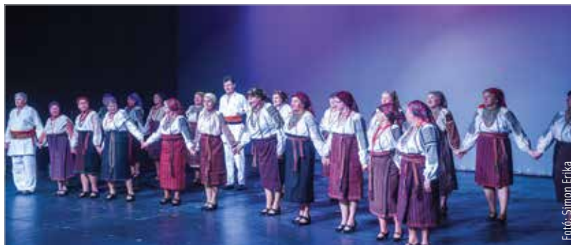
Mintegy három évtizedes hagyománya van már az időseket megszólító rendezvénynek

A kiállításra szánt tárgyakat február 7-én, hétfőn és 8-án, kedden 9 órától 16 óráig lehet leadni a Táncházban (Malom utca 6.), ahol a jelentkezők jelezhetik igényüket a zsűrivel való konzultációra is, amire február 18-án, pénteken lesz lehetőségük. A jelentkezésről és a programról bővebb információt a fehervarprogram.hu oldalon található!