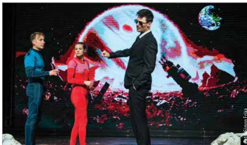
Az év drámája, Az ember tragédiája 2.0 idén is színre kerül a színházban