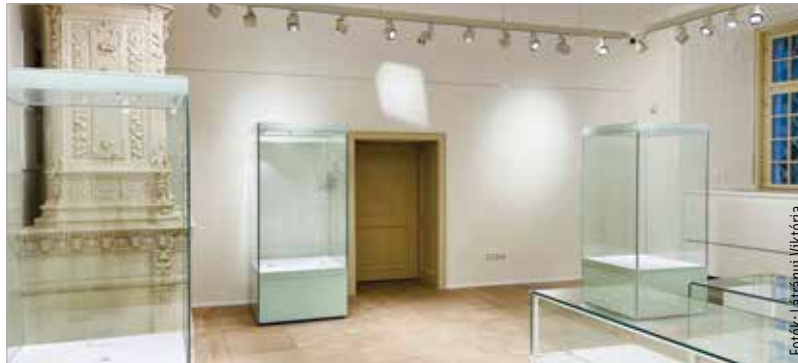
Az egykori rendházépületben szinte már minden készen van

A Szent István Király Múzeum rendházépülete az Árpád-ház-program keretében újul meg és bővül. A beruházás részeként egy korszerű múzeumi tér kialakítása valósul meg, amihez mintegy öt és fél milliárd forint-