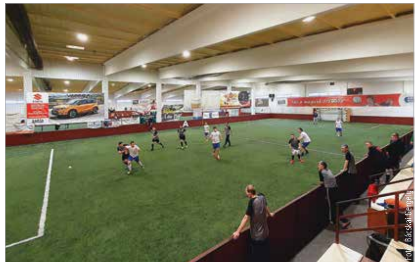
Öregfiúk fiatalos tempóban

rendelkező sportegyesülete az elmúlt időszakban komoly szintet lépett, és visszaszerezheti régi fényét ennek a közösségnek. Az öregfiúk tornáján tíz csapat vett részt, kora délelőttől délutánig zajlottak a meccsek a Főnix-csarnokban. A hangsúly tehát ezúttal a sok szakosztályt üzemeltető egyesület sportágai közül a focin volt. A tornát a Masterplast csapata nyerte, mögötte az ST Solar végzett a második helyen, a képzeletbeli dobogóra még a két harmadik helyezett, az Emerson és a házigazda MÁV Előre állhatott fel.