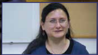
Felszállni és továbbmenni 16-17. oldal