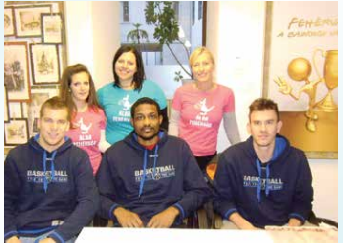
Idén is lesz dedikálás az Ajándékboltban december 7-én, 16 órától

az üzletben, és ide várják a szurkolókat is. A TLI Alba Fehérvár sportolói december 7-én vasárnap délután 4 és 5 óra között dedikálnak, és idei utolsó hazai mérkőzésük előtt igencsak számítanak a szurkolókra. És nem csak a nézőtéren, hanem az ilyen alkalmakkor is. Ugyanakkor azt is tudják, hogy az ő példájuk inspirálja a fiatal sportolókat a kemény munkára, ami a csúcsra vezet. A sportoló gyerekek most új relikviákat szerezhetnek be kedvenceikről,