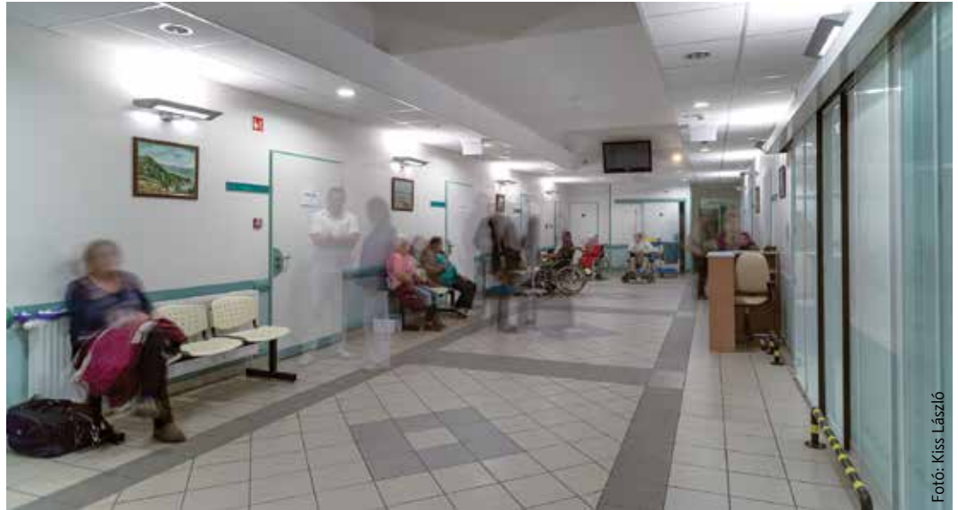
Ritka pillanat, pang a sürgősségi folyosója

Az egyszerű, banálisnak tűnő, valamint régóta fennálló, több hetes, hónapos krónikus panaszok esetén célszerű és indokolt, hogy a beteg a háziorvosi ellátást illetve a háziorvosi ügyeletet keresse fel.