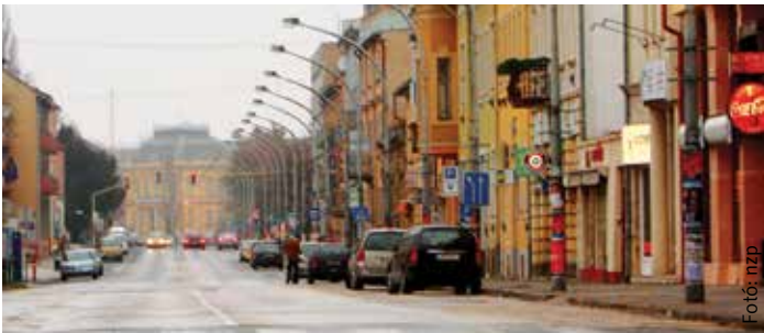
Várhatóan 2015 nyarára elkészül az új Várkörút, amit ilyennek többé már nem látunk

A városban működő nonprofit jellegű szervezetek részére pályázatot írt ki az önkormányzat úgynevezett miniprojektek megvalósítására, amit négymillió forintos keretből, vissza nem térítendő támogatásként juttat a szervezeteknek. A pályázatokat november 24-től nyújthatják be január 9-ig. A pályázattal kapcsolatos kérdéseket a 06-22-537-609-es telefonszámon vagy a balogh.agnes@pmhiv.szekesfehervar.hu e-mail címen tehetik fel.