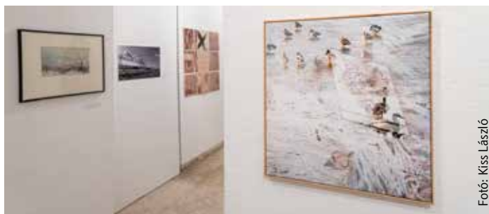
Fotó: Kiss László

láthatók a Pelikán Galériában most megnyílt tárlaton. Az ünnepi hangulat beköltözött a kiállítóterbe, hiszen ismét tárlat van télen, ahogy azt megszokhattuk. Ha csak megszakítani akarjuk egy kicsit a karácsonyi bevásárlást, akkor is érdemes körülnézni a Pelikán Galériában, ahol feltöltődhetünk, kikapcsolódhatunk, barangolhatunk a művészek által megteremtett színes kavalkádban. Ugyanakkor ajándékokkal is gazdagodhatunk, hiszen a tárlat egyben művészeti vásár is.