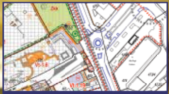
Várkörúti búcsú 4. oldal