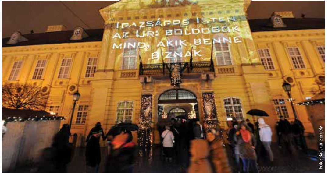
„Igazságos Isten az Úr: boldogok mind, akik benne bíznak” hirdeti a püspöki palotán megjelenő adventi fényfestés, mert az elkövetkezendő négy hétben a püspökség is fénnel köszönti a várakozókat

A adventet ma már nemcsak a vallásos emberek ünneplik. Az adventi koszorú nemcsak a keresztény emberek lakásait díszíti. A gyermekek adventi naptárat bontogatnak, levelet