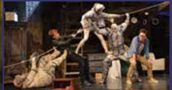
Örökre szépek 9. oldal