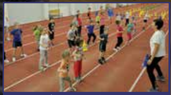
Hajrá Arakocská! 29. oldal