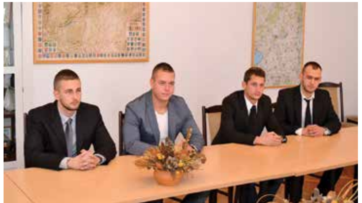
A fiatalok bátorságát oklevéllel és márkás karórával ismerte el a rendőrség

A fiatalok tettükért főkapitányi dicséretet kaptak. Az elismerést a megyei rendőrség főkapitányhelyettese adta át. Vörös Ferenc szerint határozott fellépésükkel rendkívüli bátorságról és önfeláldozásról tettek tanúbizonyságot. Az ezredes hozzátette, munkájukban a civil segítségnek óriási jelentősége van. A fiataloknak hála a rabló a közeljövőben biztosan nem látogat trafikokat.