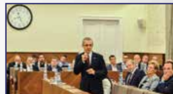
Megszűnik a telekadó 3. oldal