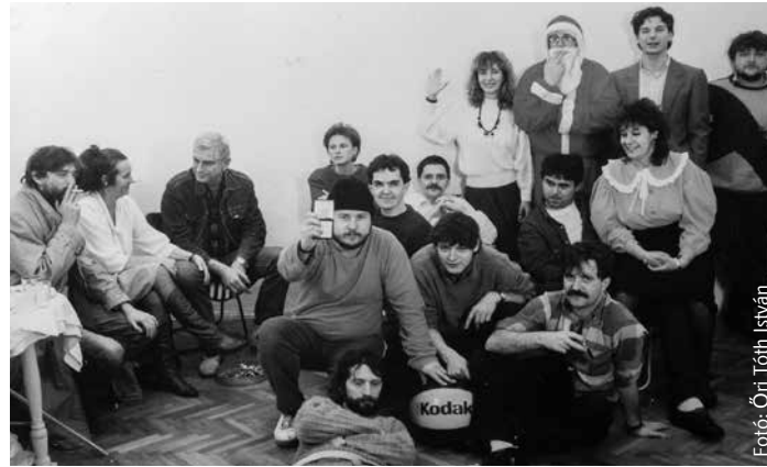
A Fehérvár TV stábjá 1989 decemberében. A képen egy bulira jöttek össze, de készen álltak az indulásra, hogy a helyszínen rögzítsék a romániai forradalom eseményeit.

legkisebb sajtóorgánium is hatalmas felelősséget hurcolt a hátán. A Fehérvár Televízió részese volt ennek a váltásnak, de ezzel nem elégedett meg. Stábot, stábot küldött az