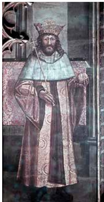
II. Ulászló király képe a prágai Szent Vencel kápolnában. A legenda szerint az elszegényedő udvar ébező királya a pórnéphez fordult élelemért, ezért azok gyorsétkezéket állítottak az utak szélére, amit a királyról lacikonyhának neveztek el.

a Rozgonyiak lettek. Azzal érdekeltek ki, hogy 1428-ban, amikor magyar kézre került Nándorfehérvár, Galambócot a török szerezte meg, és Zsigmond királyunk csak Rozgonyi István feleségének, a páncélba öltözött Rozgonyi Cecillének köszönhetette életét, aki hajójára vette és megmentette. Hálából a Rozgonyi család