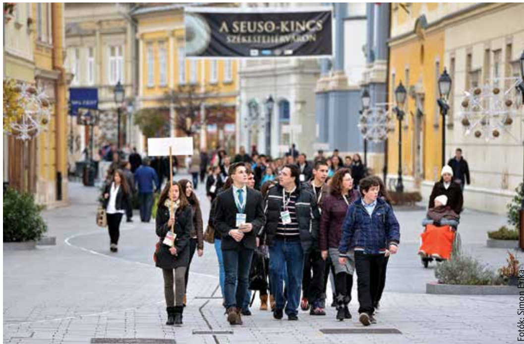
A Fehérvárra látogató Országos Diákszemélyiségfejlesztési Tanács tagjait lenyűgözte a megújult belváros, és elégedettek voltak a házigazdákkal

A pénteki megnyitót és a plenáris ülést a Vörösmarty Színházban rendezték, amit a felsőoktatási fórum követett ugyanitt és a Ciszterci Szent István Gimnáziumban.