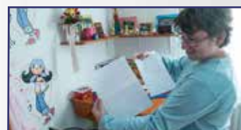
Gyermekvédelmi Napok Fehérváron 8. oldal