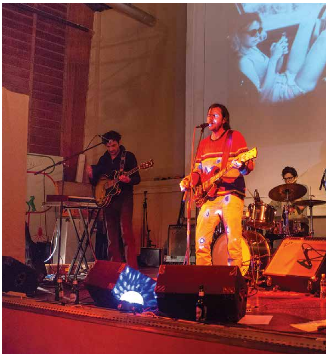
A Kistehén új lemezét a fehérváriak hallhatták először élőben

Nagyon jó programok vannak, szinte hetente járok ide, mert gyakran jön olyan zenekar, amit szeretek. Abhoz képest, hogy Fehérváron milyen az éjszakai élet, szerintem ide elég sokan járnak. Azt látom, hogy egyre több ember mozdul ki.