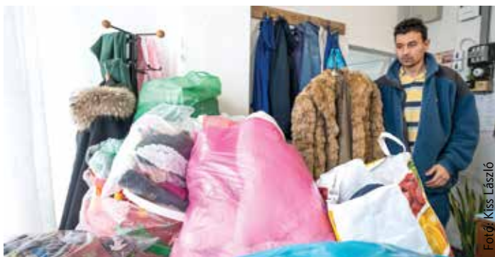
A felajánlások nagy része az akció utolsó napjaiban érkezett. Az adományokat a bétén eljuttatják a rászorulóknak.

mellett a zsákok és a dobozok. Rengetegen csatlakoztak az intézmény felhívásához, amellyel a rászorulóknak ünnepük is örömtelibbé varázsolhatták. Mondhatni az egész közösség megmozdult. A Szent Erzsébet-napi jótékonyági akció három évvel ezelőtt indult. Idén a Szegényeket Támogató Alapítványnak nyújtottak támogatást. Voltak, akik felnőtt- és gyermekruhákat, cipőket, ágyneműket vittek a Fantavillába. Érkeztek a háztartásban használatos eszközök, könyvek, játékok és sportszerek is a felhívásra. Öröm volt látni, ahogy megteltek az intézmény folyosói dobozokkal és zsákokkal.