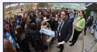
Fehérvár megérdemli a Szent Koronát 26–27. oldal