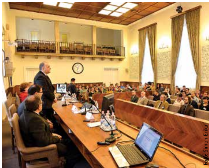
A műszaki tudás elengedhetetlen a székesfehérvári cégeknek