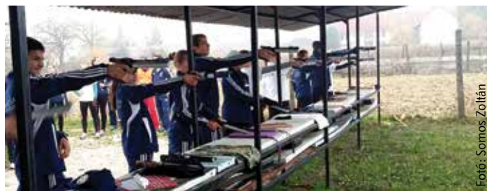
Fedett löllás az Alba Öttusa SE telepén