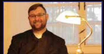
Egyedül, de nem magányosan 16–17. oldal