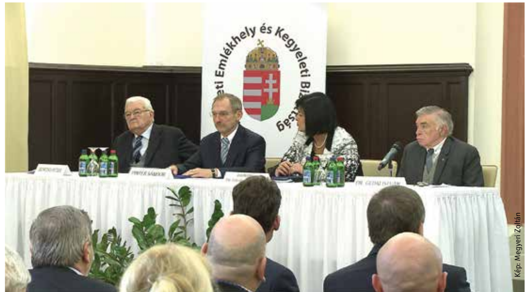
Hőseink emléke sose halványulhat el, hogy tetteik mindig példaként állhassanak az utókor előtt – mondta Pintér Sándor belügyminiszter

Cser-Palkovics András polgármester beszédében felhívta a figyelmet arra, hogy míg négy évvel ezelőtt a megkérdőjeleztek tíz százaléka, addig a legfrissebb felmérés szerint már harminc százaléka tartja fontosnak a fehérvári Nemzeti Emlékhely kérdését. „A székesfehérvári Nemzeti Emlékhely