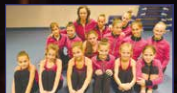
Tökéletes gyakorlat – csúcson a Futura SE 28. oldal

facebook Fehérvár Média centrum – minden, ami Fehérvár! • Keresz minket a facebookon is!