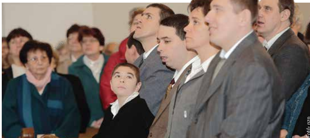
A dunaalmási gondozottak szeretetükkel felérték a felérhetlent a fehérvári református templomban