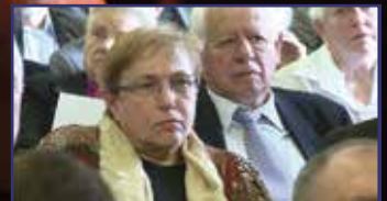
Kegyelet és Árpádház- program 4. oldal